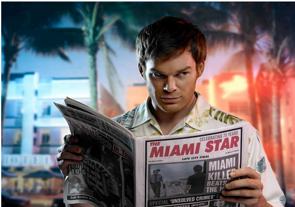
Fig. 3. Dexter

3); è in sostanza il componente di una squadra C.S.I., impegnato nella soluzione di casi criminali attraverso la ricostruzione in laboratorio e sul campo di prove e indizi. Ma Dexter nasconde un segreto. È, infatti, anche uno spietato serial killer, ma che è stato trasformato dal patrigno poliziotto in un "punitore", riuscendo così a deviare i suoi impulsi omicidi. Infatti, Dexter uccide solo criminali sfuggiti alla giustizia, ma a modo suo, dando soddisfazione alla propria crudele mente malata. Come in una sorta di "romanzo di formazione", nel corso delle diverse stagioni della serie, Dexter ritrova lentamente la propria umanità cercando di fare coincidere il personaggio diurno, il poliziotto della scientifica e il marito e padre amorevole, con il Dexter notturno, il sadico serial killer.