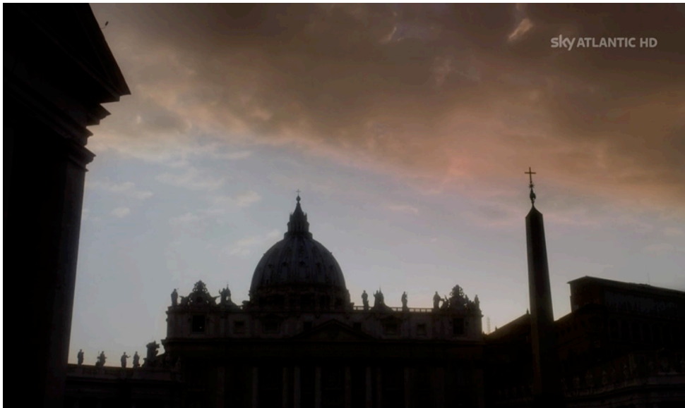
Fig. 6. La Roma di Sorrentino

Ma quale Roma costruisce Sorrentino? Le rappresentazioni della città data nella serie sembrano consistere in quelle che sono state definite le “cartoline” di Roma, così apprezzate dagli spettatori e dai critici statunitensi, ma che in questa prospettiva non sono state comprese nel loro vero significato (fig. 6). L’uso degli spazi in Sorrentino (vedi La grande bellezza ) è sempre riconducibile al tema della decadenza, al ricordo di un passato che è memoria di una grandezza perduta, meccanismo che è inevitabilmente presente anche in The Young Pope . Ci troviamo così di fronte all’uso della «monumentalità» decadente di Roma, di giardini e statue che seppure curati alla perfezione, sono spesso rappresentati come vuoti, abbandonati dall’uomo. Non è un caso se è in questi luoghi che avvengono i dialoghi più rilevanti per gli sviluppi della narrazione. Si tratta di una serie in cui è evidente la centralità dei dialoghi – dal ritmo lento e riflessivo –, e proprio i tempi e i modi di queste situazioni sono, di fatto, dettati dalle caratteristiche delle location. In questo caso, in un modo certamente diverso da Gomorra o dagli altri esempi citati, il luogo diventa cronotopo, definendo proprio quella caratteristica che ha connotato la serie, la lenta dialogicità. Ancor più che negli altri casi i luoghi qui dettano i tempi e i modi dello sviluppo narrativo trasformandoli in fondamentali cronotopi.