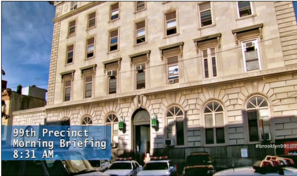
Fig. 1. Establishing shot dalla serie tv Brooklyn Nine-Nine (Fox, 2016–in produzione)

panoramica ( long shot ) di un luogo che definisce allo sguardo dello spettatore dove (e spesso anche quando) avviene l'azione a seguire (fig. 1).