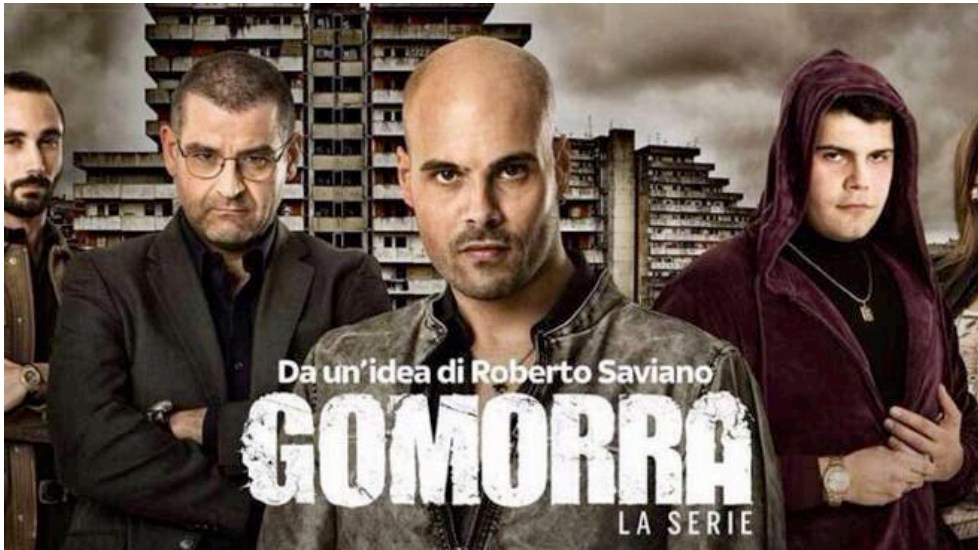
Fig. 4. I personaggi principali della serie Gomorra collocati sullo sfondo delle "Vele" di Scampia

Secondigliano, la Napoli nord, la Napoli del degrado più evidente e, a questo punto, significativo narrativamente (fig. 4).