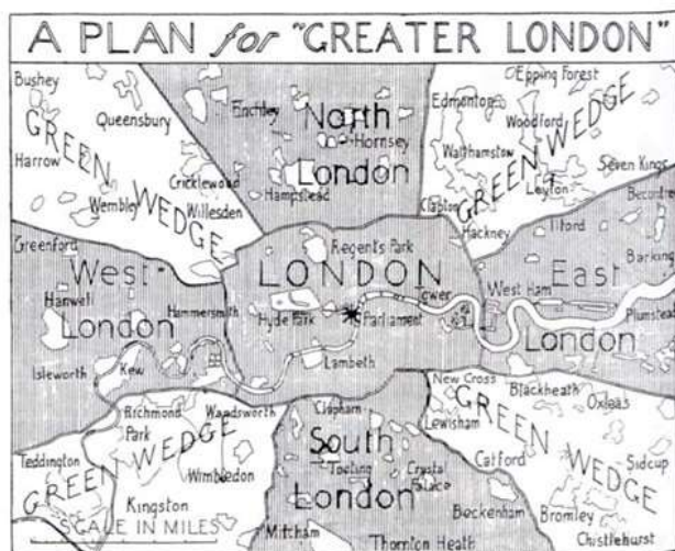
Fig. 1. The Trystan Edwards/ Hundred New Towns Association plan (Edwards 128)

secondo conflitto mondiale, assiste a una intensa trasformazione urbana. In questo periodo molte zone cambiano, si trasformano culturalmente e socialmente e, ad esempio, North Kensington da spazio periferico diventa luogo di negoziazione della cultura britannica postcoloniale (Brundson 68). Forse non è un caso se proprio in alcune delle periferie degli anni Cinquanta del Novecento della capitale inglese si innestano il romanzo di Colin Maclnnes, Absolute Beginners (1959), e il suo omonimo adattamento cinematografico (1986) diretto da Julien Temple. Ad ogni modo, le aree periferiche raccontate dai due artisti non coincidono con quelle della Londra contemporanea. Se negli anni Cinquanta, infatti, North Kensington, comprendendo le zone di Notting Dale, Notting Hill e Landbroke Grove (ovvero l'area metropolitana in cui si ambienta la maggior parte delle scene del romanzo e del musical), era una delle periferie della Londra post-bellica, oggi non è più così.