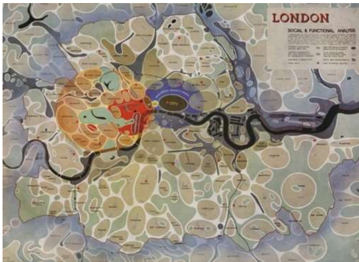
Fig. 2. Abercrombie F., The County of London Plan (1943)

I riots di cui parla Agostini avvennero nel 1958 proprio nel luogo in cui MacInnes ambienta il suo romanzo, ovvero, il West End, oggi la parte più urbanizzata di Londra con un'estensione a Ovest della City e principale distretto per i divertimenti e lo shopping. La maggior parte del West End è inclusa amministrativamente nella cosiddetta "City of Westminster", che è uno dei 32 distretti di Londra. Nel secondo dopoguerra, però, attraversare la zona che, nella figura 2, risulta cerchiata in arancio, significava passeggiare in un insieme di luoghi molto variegati e contraddittori. Da una parte, gli eleganti bar e bookshops di Covent Garden e Soho, i teatri lungo Shaftesbury Avenue, i cinema di Leicester Square, l'architettura classica e le facciate bianche delle case di Belgravia, Pimlico, Chelsea e Westminster.