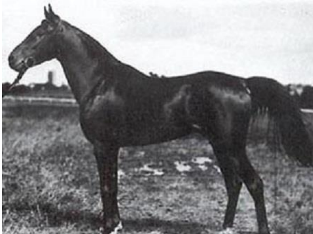
Fig. 2. Kuhaylan Afas, purosangue arabo antenato di Bohemien da Clodia.