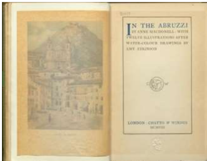
Fig. 1. Anne MacDonell, In the Abruzzi , Londra, 1908, frontespizio