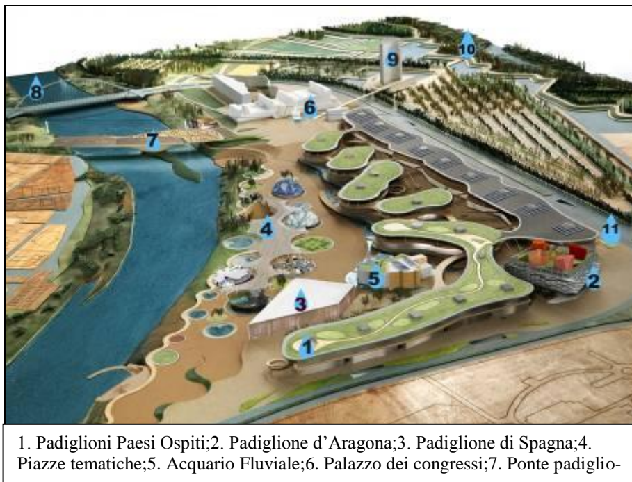
Figura 2 – Mappa del recinto dell'Expo.

L'area possedeva già una potenziale ottima accessibilità, che è stata implementata grazie alla costruzione della Ronda del Rabal , una strada a scorrimento veloce, che taglia l'area dell'Expo e che connette il meandro a est con il quartiere ACTUR e a ovest con il quartiere La Almozara , tramite il nuovissimo ponte del Tercer Milenio . Il meandro, inoltre, essendo conformato come un'area delimitata, quasi circondata totalmente dalle acque, ha costituito una zona ottimale per programmare un intervento puntuale sul territorio, che si opponeva spontaneamente ad una espansione a macchia, frutto di eventuali future speculazioni, ma che al contempo veniva progettato per divenire un'area integrata nel tessuto urbano, grazie alle opere per la connettività.