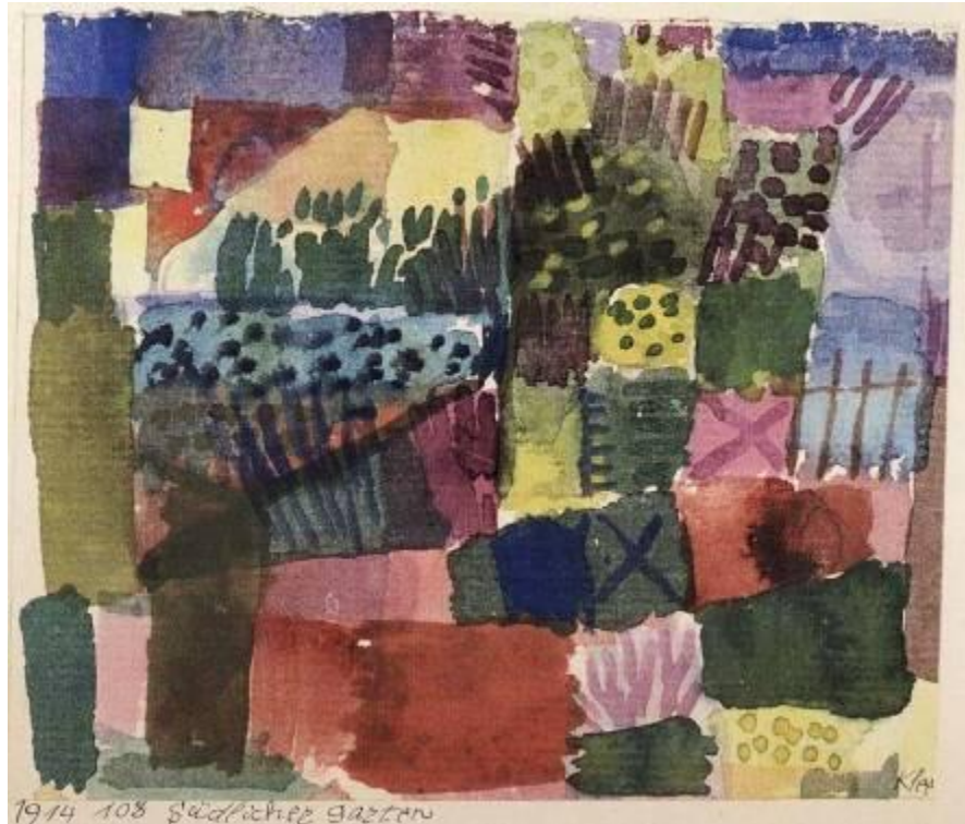
Figura 6. Paul Klee, 1914, Jardín mediterráneo , acuarela.

Estallido, epifanía y territorio existencial son también términos apropiados para describir el paisaje de María Luisa Bombal. En efecto, el paisaje de Klee guarda semejanzas con el de la escritora chilena, puesto que en ambos la perspectiva ha sido negada para modificar la mirada horizontal. En La última niebla , la perspectiva está anulada porque, tal como Goic lo expresa en Los mitos degradados (1997: 170), todo el mundo de la novela corresponde al mundo interior de la narradora quien ha renunciado a la omnisciencia y al dominio consciente del universo. La perspectiva desplazada, tal como Goic lo reconoce, se manifiesta en la ausencia de distancia espacial y temporal entre la narradora y el mundo narrado, proporcionando inmediatez y simultaneidad entre el hecho y la palabra.