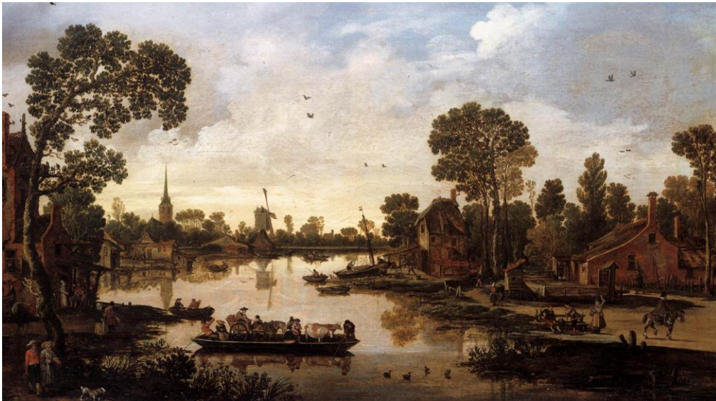
Figura 2. Esaias van de Velde, 1622, El transbordador de ganado , óleo sobre madera, Rijksmuseum, Amsterdam.

Esta mirada, que aúpa los fragmentos del lugar, ha presentado algunas variaciones a lo largo de la historia de este género pictórico. Por ejemplo, en el caso de la producción de los Países Bajos, tenemos el paisaje universal o panorámico, en el que el observador está a una altura superior con respecto al plano representado. Se le llama panorámico porque la vista que se obtiene desde tal posición permite obtener una visión global del lugar. Uno de los grandes representantes de este paisaje es el pintor Esaias van de Velde (1587-1630) y su obra titulada "El transbordador de ganado" (1622).