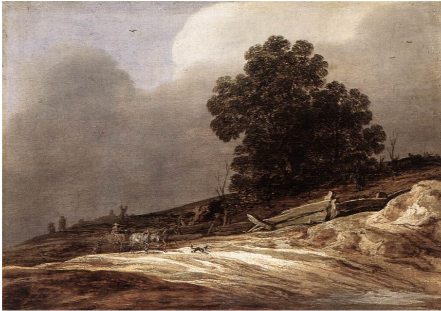
Figura 3. Pieter Molijn, 1626, Paisaje de dunas con árboles y carro , óleo sobre tabla, Museo Herzog Anton Ulrich, Braunschweig.

Dado lo anterior, la perspectiva puede ser definida como el punto de vista oficial en el cual el observador se localiza para que todo el espacio se remita finalmente a su singular subjetividad. En este sentido; Panofsky define la perspectiva como “la expansión de la esfera del yo” (1980: 51). Dado lo anterior, el paisaje es también el lugar desde el cual el sujeto se localiza, se identifica. Con ese lugar representado construye, por ejemplo, su yo nacional. Pienso desde luego en la importancia del paisaje en los discursos de la nación modulados en estéticas románticas y criollistas, al menos, en el caso chileno 3 . En este caso, se producirá un paisaje que exalta valores locales tales como la belleza de la tierra de la cual uno es oriundo para generar un sentimiento de pertenencia a esa tierra paterna que nos vio nacer y que deviene territorio.