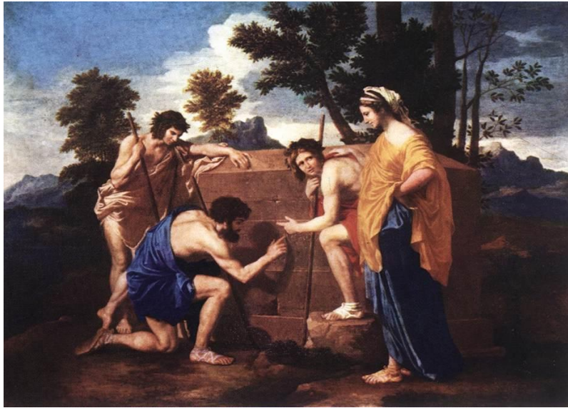
Figura 4. Nicolas Poussin, 1637-9, Et in Arcadia Ego , óleo sobre lienzo, Museo del Louvre, París.