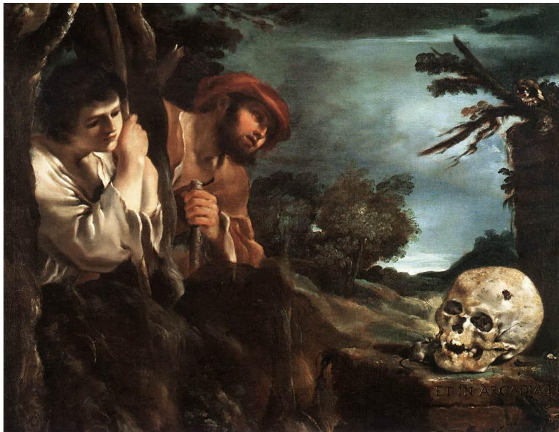
Figura 5. Guernico (Francesco Giovanni Barbieri), 1618, óleo sobre lienzo, Galería Nacional de Arte Antiguo, Roma.