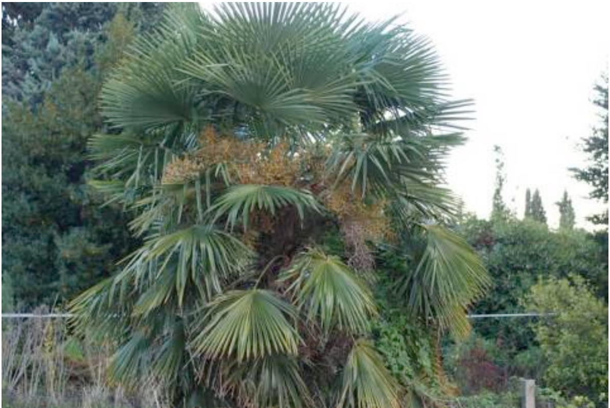
Fig. 2: palma di Zhou Shan ( Trachycarpus fortunei (Hook.) H. Wendl., Cina) naturalizzata in territorio lombardo.