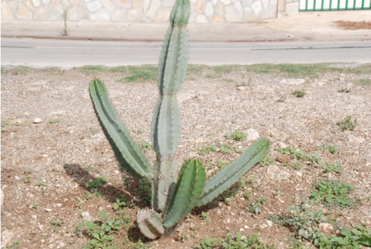
Fig. 1 – Cereus hildmannianus K. Schum. (Brasile) naturalizzato in Sicilia: esempio di ferale reverso.