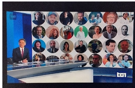
Fig 2 – TG1 maschile generico “eroi”

Nel telegiornale, talvolta l'effetto straniante del maschile sovraesteso è amplificato proprio dal contrasto con l'immagine, come ad esempio nel caso che segue, in cui la parola eroi (un termine su cui la propensione del pensiero a produrre referenti di genere maschile 40 potrebbe dirsi persino acuita in virtù del significato e della funzione che assume nella tradizione letteraria) è rappresentata nell'immagine da un gruppo evidentemente diversificato, cioè popolato sia da uomini sia da donne: «trenta eroi del quotidiano / il Presidente Mattarella ha conferito le onorificenze al merito della Repubblica / per l'esempio e l'impegno civile» (TG1 24.02).