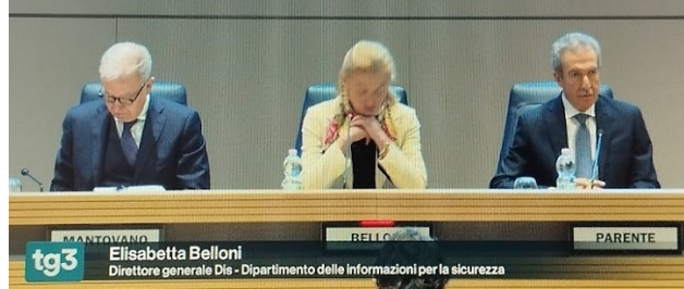
Fig.3 – Elisabetta Belloni - Direttore generale Dis

nell'immagine compare una donna, mentre nella didascalia il titolo professionale o istituzionale che ricopre è invece indicato al maschile.