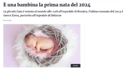
Fig.1 – TGR online Trentino Alto-Adige

Nel telegiornale, talvolta l'effetto straniante del maschile sovraesteso è amplificato proprio dal contrasto con l'immagine, come ad esempio nel caso che segue, in cui la parola eroi (un termine su cui la propensione del pensiero a produrre referenti di genere maschile 40 potrebbe dirsi persino acuita in virtù del significato e della funzione che assume nella tradizione letteraria) è rappresentata nell'immagine da un gruppo evidentemente diversificato, cioè popolato sia da uomini sia da donne: «trenta eroi del quotidiano / il Presidente Mattarella ha conferito le onorificenze al merito della Repubblica / per l'esempio e l'impegno civile» (TG1 24.02).