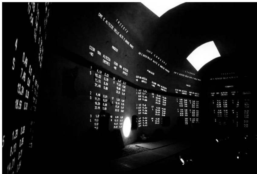
Fig. 4. Platea Variazione op. K 42°-06', 2013

L'artista lascia al visitatore, attivo protagonista della visibile esperienza, il compito di stabilire un nesso, solo apparentemente indeterminato, che si rende al momento certo. La performance esperita concretamente, con l'udito, con la vista, con l'immersione totale fisica in uno spazio non tangibile, speciale, che trascende i confini del contesto architettonico, fornisce solo in questo modo un contatto, una fusione tra la consapevolezza fisica e l'emozione sentimentale, affettiva, proiettando se stesso in un ambito altro, differente.