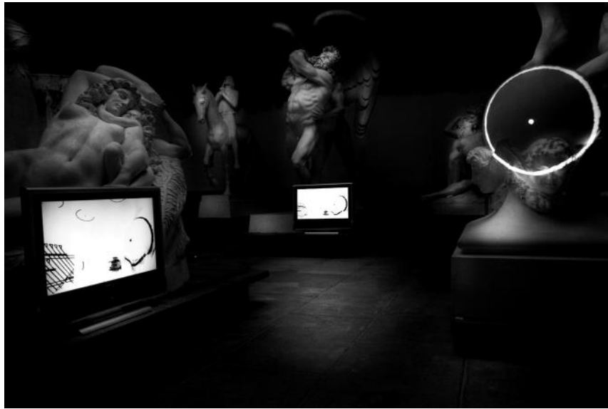
Fig. 1. Variazione op. K10°_ n Newport partitura di luce per macchinari ottici , 2011

del porto di Civitavecchia, ambienti molto diversi ma rideterminati con il medesimo interesse e il medesimo linguaggio di misurazione e scansione dello spazio, definito dalla luce, dalla musica e dalla matematica. L'artista disegna luoghi che proiettano lo spettatore al di fuori delle condizioni temporali contingenti; una dimensione che evoca processi mentali e razionali assimilabili alla dimensione teoretica umanistico-rinascimentale (figg. 1-4).