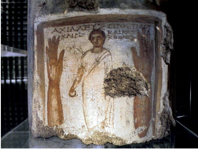
Fig. 2. Particolare