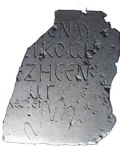
Fig. 3. Iscrizione funeraria da Messina (da ZAVATTIERI 2017, p. 170, fig. 3)