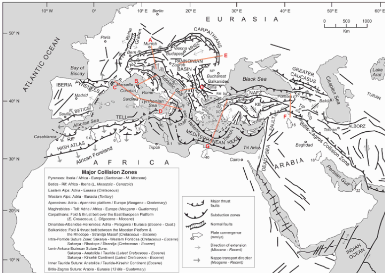
Fig. 2. (da DILEK 2006, p. 3)

In particolare, venendo all'area settentrionale della Siria dove alla fine del IV sec. a.C. venne fondata la città di Antiochia sull'Oronte, gli studi sulla topografia sismica del territorio hanno evidenziato una evoluzione geodinamica di lungo corso assai precisa. Come è stato brevemente ricordato da Yildirim Dilek: