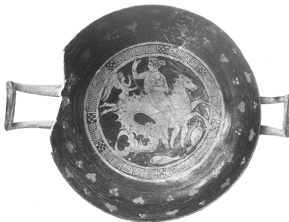
Fig. 8. S. Agata dei Goti, Coll. Mustilli.