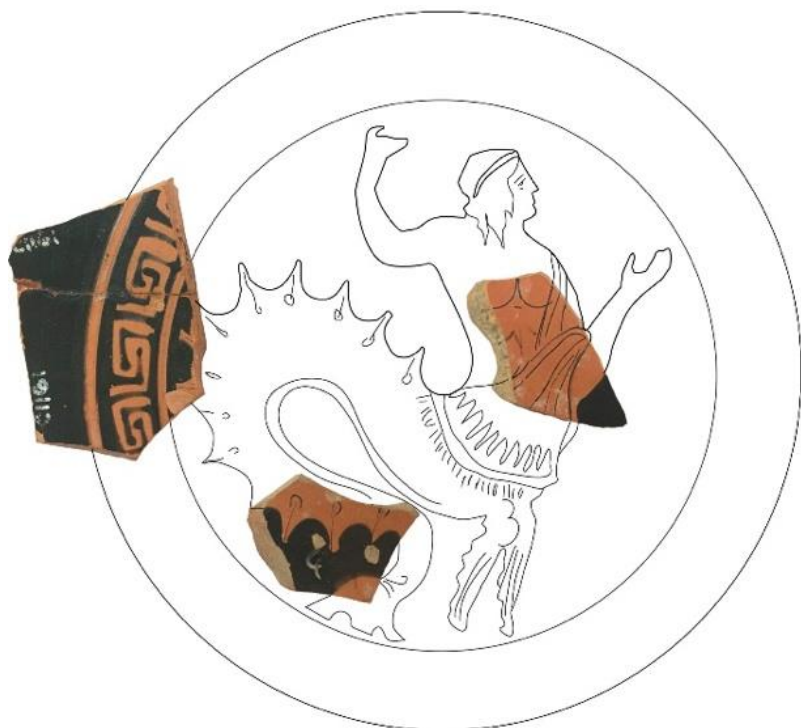
Fig. 4. Ricostruzione ipotetica della coppa tenendo in considerazione anche il frammento 3 di incerta attribuzione (interno). Attribuzione interno: Pittore AII, Bottega P. di Meleagro