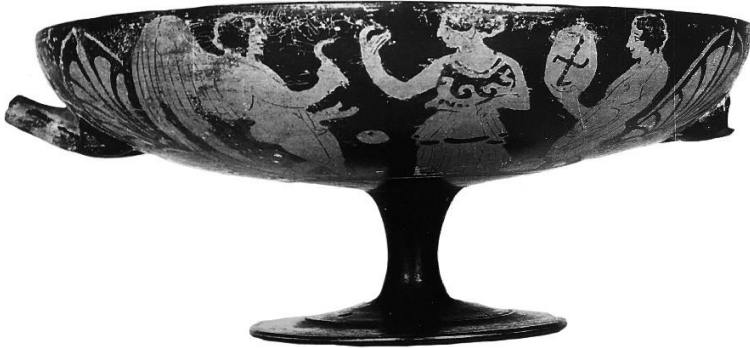
Fig. 7. Dublino, National Museum of Ireland, inv. 1917.45. (Foto rilavorata da CURTI 2001, p. 124, tav. 68)