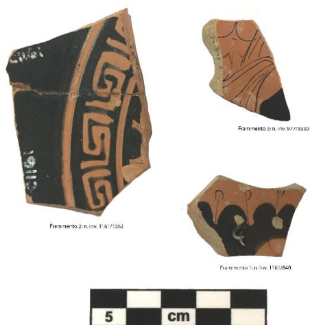
Fig. 1. I tre frammenti rinvenuti nel pozzo del 'complesso monumentale' di Tarquinia. Visione frontale (interno)