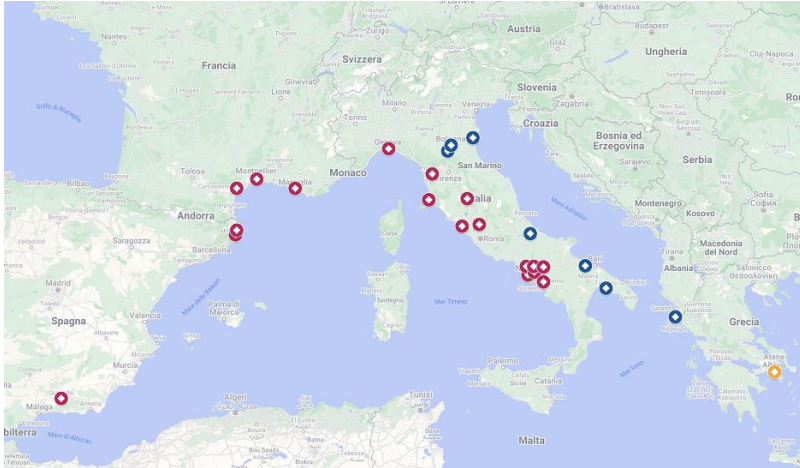
Fig. 10. Distribuzione dei prodotti della Bottega del P. di Meleagro da Atene (in giallo) verso Occidente. Rotta tirrenica (in rosso). Rotta adriatica (in blu). Giunti mediante la rotta Adriatica , si contano esemplari da: Corfù, Taranto (?), Ruvo, Chieti, Spina, Bologna, Marzabotto. Giunti mediante la rotta Tirrenica , si contano esemplari da: Calvi, Capua, Napoli e dintorni, Nola, S. Agata dei Goti, Pontecagnano, Tarquinia, Falerii Veteres, Chiusi, area sud etrusca in generale, Populonia, Bientina, Genova, Marsiglia, Ensérune, Lattes, Ampurias, Ullastret, Granada, Spagna in generale. Per le specifiche dei materiali rinvenuti in ciascun centro della rotta tirrenica. Vd. tabella 1