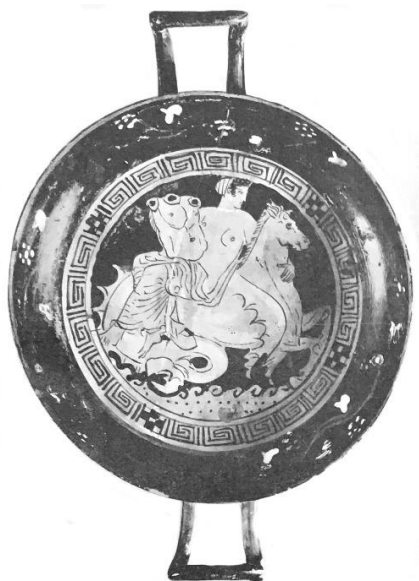
Fig. 9. Vienna, Kunsthistorisches Museum, 96.