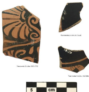
Fig. 2. I tre frammenti rinvenuti nel pozzo del 'complesso monumentale' di Tarquinia. Visione posteriore (esterno)