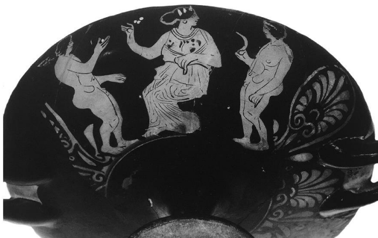
Fig. 6. British Museum, inv. E109, ex collezione Blacas. Bottega del P. di Meleagro. Interno: Pittore AII; Esterno: Pittore BVI. (Foto rilavorata da CURTI 2001, tav. 67)