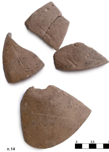
Fig. 12. Coppa emisferica con graffiti n. 11