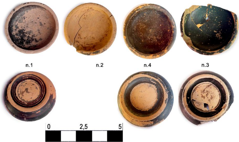
Fig. 8. Patere nn. 1-4