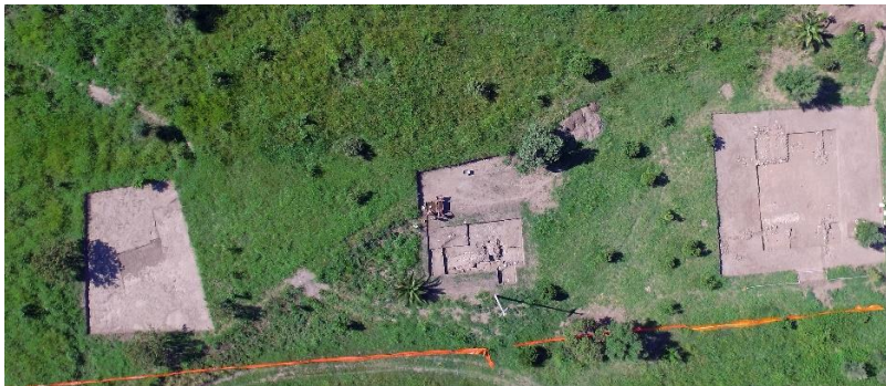
Fig. 2. Veduta da drone delle trincee aperte in corrispondenza dei crocevia 7-9 della plateia A