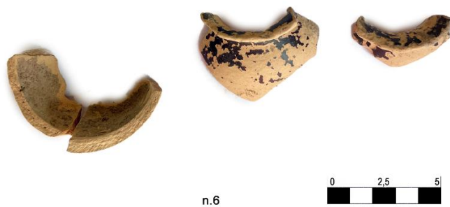
Fig. 10. Vaso miniaturistico n. 6