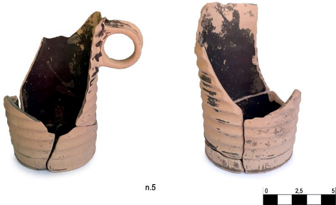
Fig. 9. Boccale attico a vernice nera n. 5