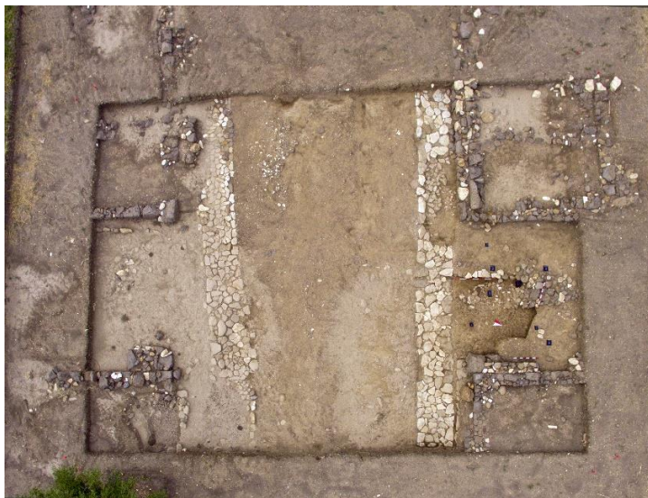
Fig. 3. Veduta da drone del crocevia tra la plateia A e lo stenopos 9