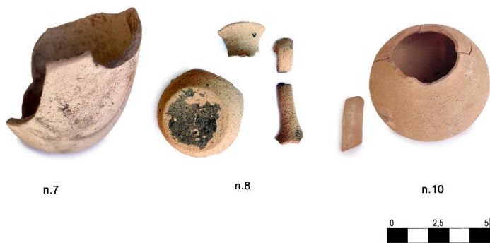
Fig. 11. Olpai nn. 7-8 e brocca n. 10