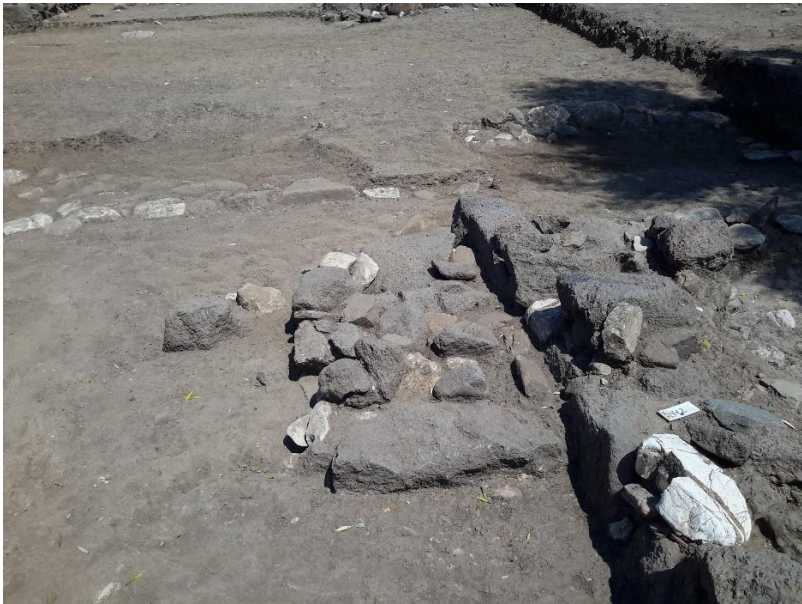
Fig. 6. Incrocio A9: particolare della base d'altare