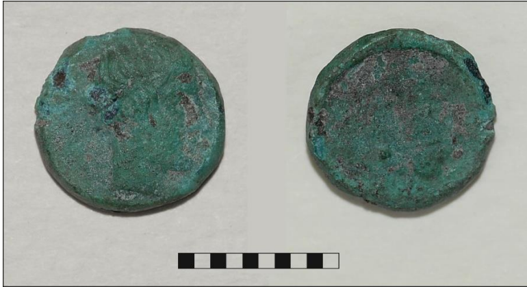
Fig. 16. Onkia in bronzo siracusana n. 17 (intorno al 415 a.C.)