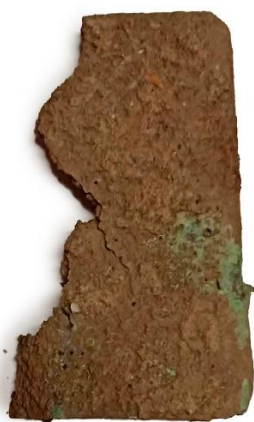
Fig. 14. Arula fittile n. 15