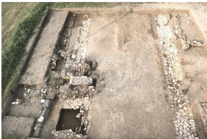
Fig. 4. Veduta da drone del crocevia tra la plateia A e lo stenopos 8