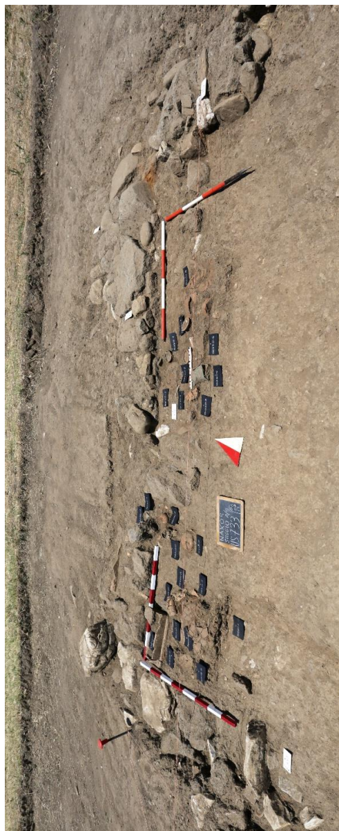
Fig. 7. Ortofoto del deposito di abbandono