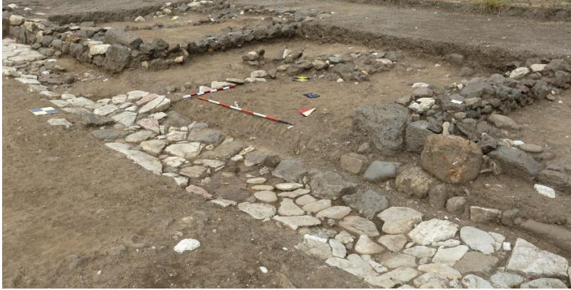
Fig. 5. Incrocio A9: particolare del versante nord (insulae C8-C9)