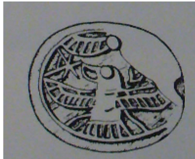
Fig. 6 – Scaraboide da Vetulonia (da HÖLBL 1979, II, tav. 147, fig. 7).