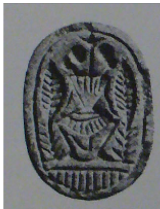
Fig. 7 – Scaraboide da Falerii (da HÖLBL 1979, II, tav. 147, fig. 4).