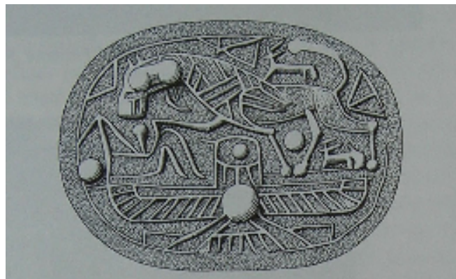
Fig. 2 - Scarabeo dall'Etruria (da BOARDMAN 1990, p. 6, fig. 10).