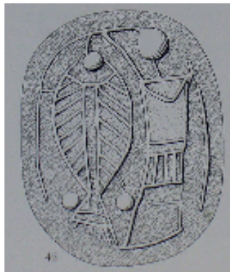
Fig. 4 - Scarabeo da Montalcino (da BUCHNER – BOARDMAN 1966, p. 24, fig. 30, 42).