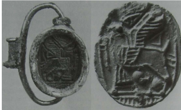
Fig. 5 – Scaraboide dall'Etruria (da BOARDMAN 1990, p. 2, figg. 1a, 2).