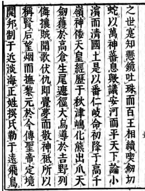
Fig. 3 – Page du Kojiki .

Paradoxalement, bien que le cinéaste soit en rupture radicale avec l'usage traditionnel que l'on fait d'une pellicule, il en fait, tout autrement certes, un usage fondamentalement ancré dans la tradition, et d'une certaine manière presque archaïque. Le film peut en effet être réalisé avec des restes, des pellicules (au sens presque de « peaux ») ratées qui ont été trouvées et récupérées, du found footage au sens le plus propre, pour autant que ces pellicules ne soient pas développées. Ensuite, et c'est la dimension essentielle, vu la longueur du film (121 mètres, soit 11 minutes, soit plus de 15 000 photogrammes), sa réalisation se conçoit comme l'expérience éprouvante et méditative d'un scribe. En quelque sorte, on a ici une posture moderne tributaire d'un retour aux formes originelles. Iimura en tant qu'auteur propose une œuvre d'art assujettie à une forme d'artisanat qui, se pratiquant dans l'anonymat, est l'une des plus traditionnelles. Le fait qu'il choisisse le premier texte écrit en japonais permet de souligner ce paradoxe.