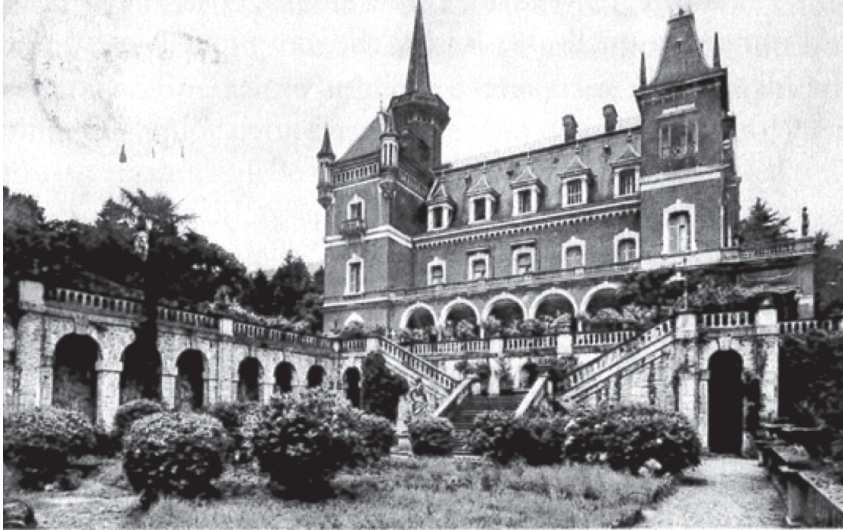
VILLA BRANCA (BAVENO) - Scalinata stile settecento

1. Villa Clara-Henfrey (oggi Villa Branca) a Baveno in una cartolina del 1931