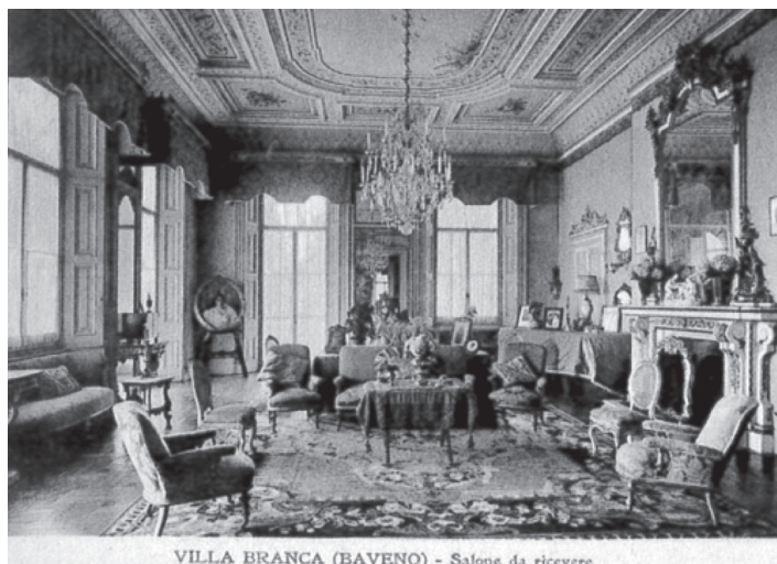
VILLA BRANCA (BAVENO) - Salone da ricevere 4. Il “salone da ricevere” di Villa Clara-Henfrey (oggi Villa Branca) in una cartolina del 1931