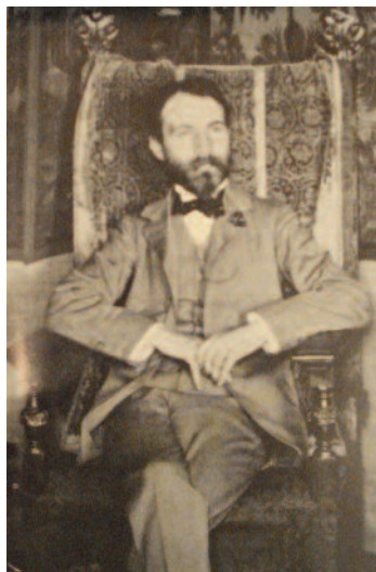
4. Bernard Berenson