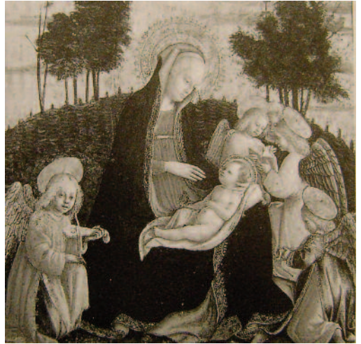
7. Vincenzo Foppa, Madonna della siepe , Settignano, Collezione Berenson, Villa I Tatti, The Harvard University Center for Italian Renaissance Studies

na ricevuta la lettera d'offerta: «fra una cosa e l'altra i giorni passano ed essendo ad ogni modo per me un dente da strappare è oramai parecchio che ho il dolore in vista» 33 .