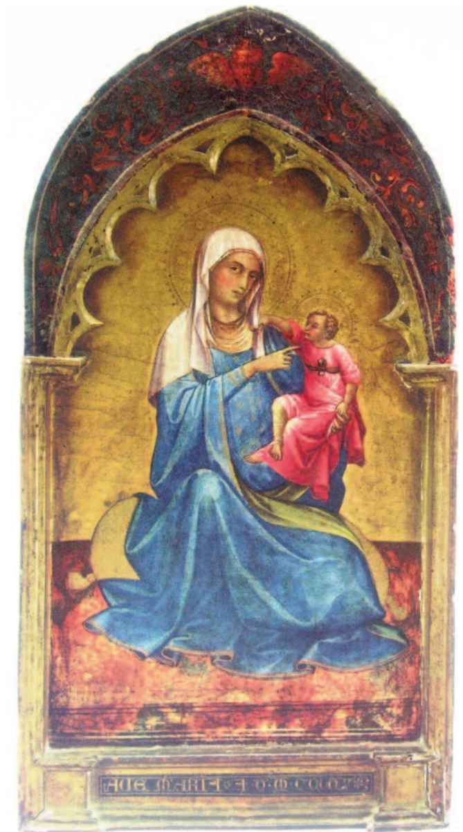
8. Lorenzo Monaco, Madonna dell'umiltà , Settignano, Collezione Berenson, Villa I Tatti, The Harvard University Center for Italian Renaissance Studies