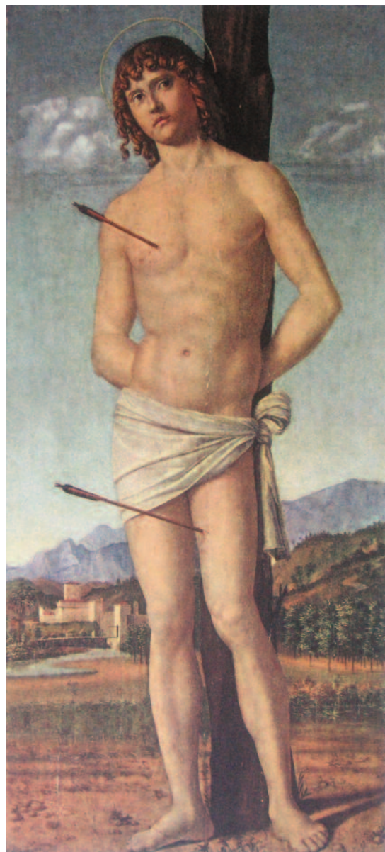
5. Cima da Conegliano, San Sebastiano , Settignano, Collezione Berenson, Villa I Tatti, The Harvard University Center for Italian Renaissance Studies