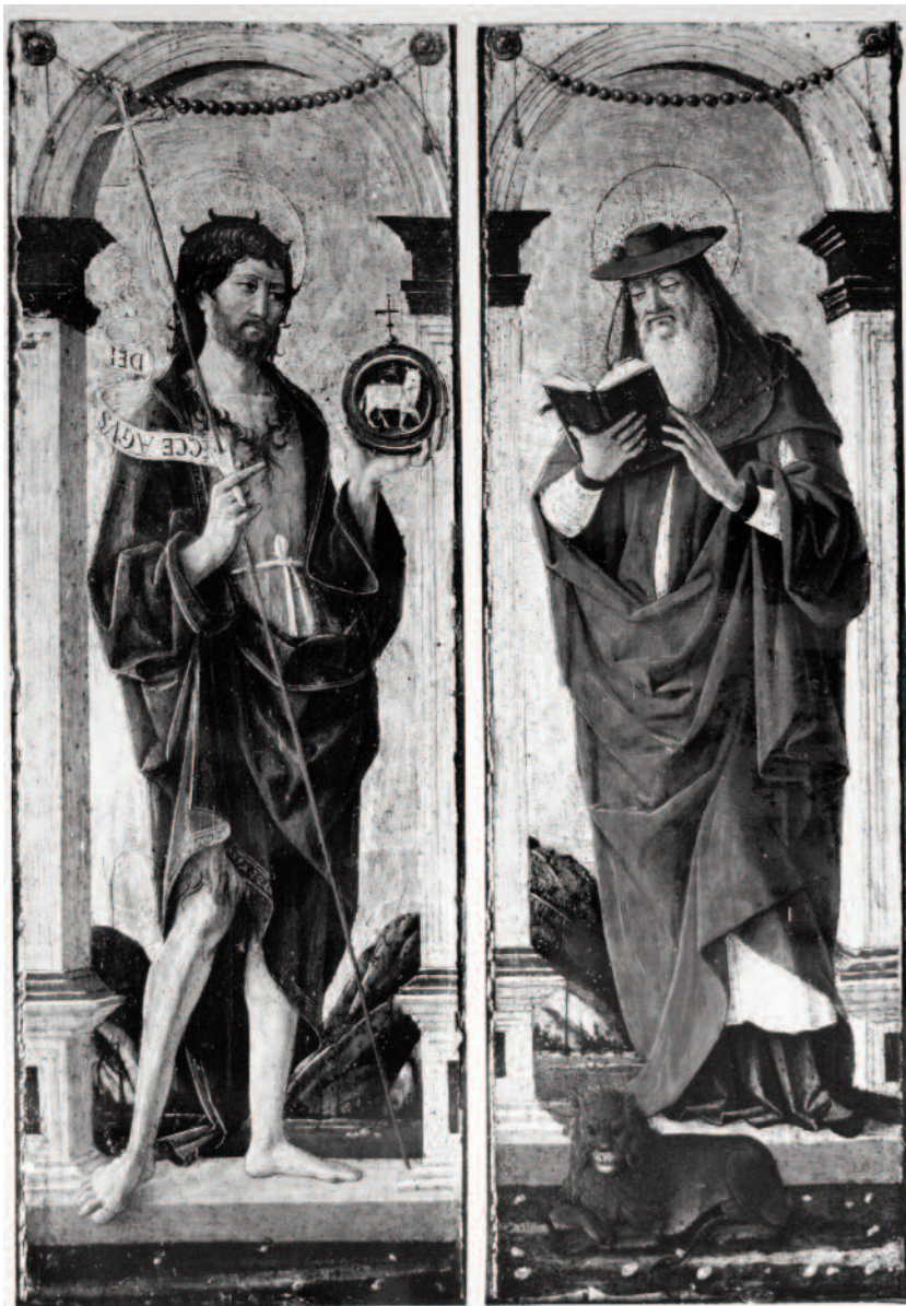
6 a/b. Vicino da Ferrara, San Giovanni Battista e San Gerolamo , Settignano, Collezione Berenson, Villa I Tatti, The Harvard University Center for Italian Renaissance Studies