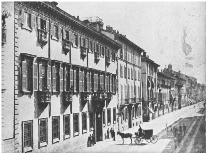
2. Milano, veduta di corso di Porta Romana, Palazzo Acerbi

risponde secondo la numerazione teresiana al 3994A, nella contrada dei Nobili, poi ribattezzata via dell'Unione, al civico 7, sotto la parrocchia di Sant'Alessandro. In un secondo momento, ma non prima del 1873, l'intero nucleo familiare si sposterà al numero 9 di corso di Porta Romana (fig. 2) dove «sorgeva un palazzetto a tre piani, con due portali simmetrici ad arco ribassato, inquadrato in una incorniciatura nelle forme del tardo '500; sopra, uno scudo araldico con corona, a modo di serraglia, circondato da stucchi posteriori formanti una conchiglia e vari fregi. Finestre contornate da intonaco, a sagome; quelle del secondo piano con bei balconcini di ferro. Due balconi a pianta mistilinea, con eleganti parapetti di ferro battuto. Il cortile aveva un portico di colonne toscane di granito, architravate; la scala a larga rampa, aveva il parapetto rifatto nel secolo scorso» 9 . Il palazzo, prima che i Nosedà ne entrassero in possesso, apparteneva alla famiglia Scotti Trivulzio 10 . Tra i Ricordi di gioventù che Giovanni Visconti Venosta, patriota e letterato, fratello di Emilio, raccoglie e pubblica nel 1904 si ritrova un aneddoto circa Casa Nosedà, riferito al periodo tra 1847 e 1848 e legato alle vicende precedenti l'insurrezione che avrebbe dato ini-