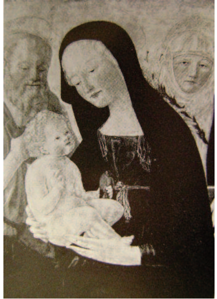
9. Neroccio de' Landi, Madonna con il Bambino, San Gerolamo e Santa Caterina da Siena , Filadelfia, Philadelphia Museum of Art