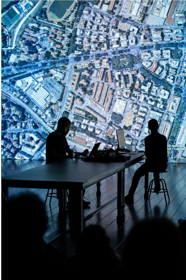
Fig. 1. Arkadi Zaides, Necropolis