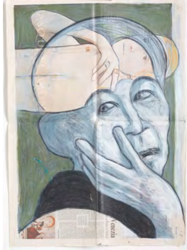
Fig. 2: Hannah Arendt. Pasquale Bruni - «Corriere della Sera», 29-4-2006.

‘éxodo’, más reciente, de aquel exilio de tantos jóvenes obligados a dejar su país. No obstante el énfasis de la referencia al gesto de la mano sobre el que se apoyan los rostros de las dos mujeres, con diferente técnica hermenéutica, la imagen de la filósofa —nuevamente una judía— que ha interpretado los totalitarismos del siglo veinte y ha sabido dar forma, la de un hongo, al mal y a su banalidad, se superpone, pero en oposición, a la de una pálida modelo, testimonio para la publicidad de las joyas de Pasquale Bruni; ella, testimonio al contrario de quien ha sido despojado de todo. Hannah Arendt, privada también de sus derechos civiles.