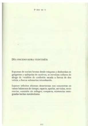
Fig. 2: Texto Procedimiento

El desmembramiento textual, bien a través de la eliminación de los artículos determinantes, bien a través de la supresión de ciertas letras o los espacios en blanco, nos remite, por un lado, a las fracturas que el 'yo' experimenta en el sistema deshumanizador de los centros clandestinos de detención reflejadas en las distintas voces que nos ofrece la autora, voces que balbucean, «canceladas» (30), a las que apenas les llega el aliento, convertidas muchas veces en agónicos estertores, y que, sin embargo, resisten para fijar su existencia: