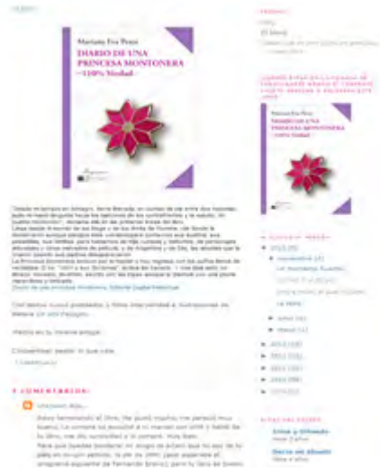
Fig. 1: captura de pantalla de http://princesamontonera.blogspot.com.es/

También, la consciencia de que el pre-texto de la publicación en forma de libro sea de carácter hipertextual, invita a mimetizar una mirada de interfa-ce , es decir de leer el libro abandonando la lectura lineal, permitiéndose los saltos que ya se han vuelto naturales en la recepción de información digitalizada. El Diario-libro , empero, no puede reflejar, aunque esté implícitamente inscrita en el, la compleja presencia de la comunidad que ‘siguió y sigue siempre’ a la princesa montonera en el espacio de la red.