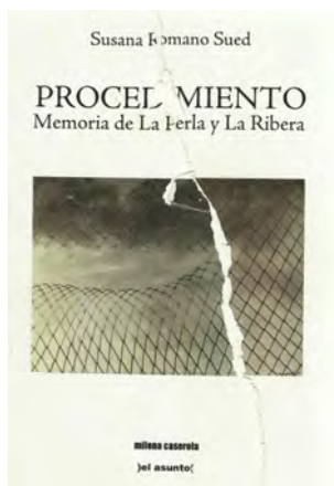
Fig. 1: Portada Procedimiento

La portada de Procedimiento [fig. 1] —diseño de Miguel De Lorenzi, quien rompió «con su propia mano cada uno de los ejemplares de la edición» (Romano Sued 2012: 6)— nos revela uno de los elementos medulares del discurso narrativo-poético del libro 1 : la rotura.