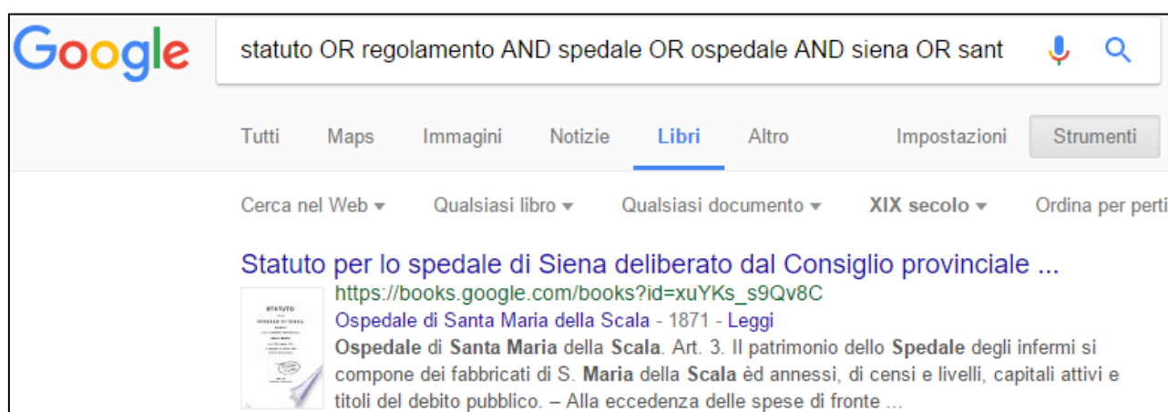
Figura 3: Ricerca con Google libri – Regolamento ospedaliero

Inserendo, e quindi combinando tramite gli opportuni operatori booleani, le parole come nell'esempio precedente, e impostando i limiti temporali (1800-1899), si otterrà, come primo risultato, lo Statuto del 1871 (Figura 3) disponibile in versione digitalizzata.