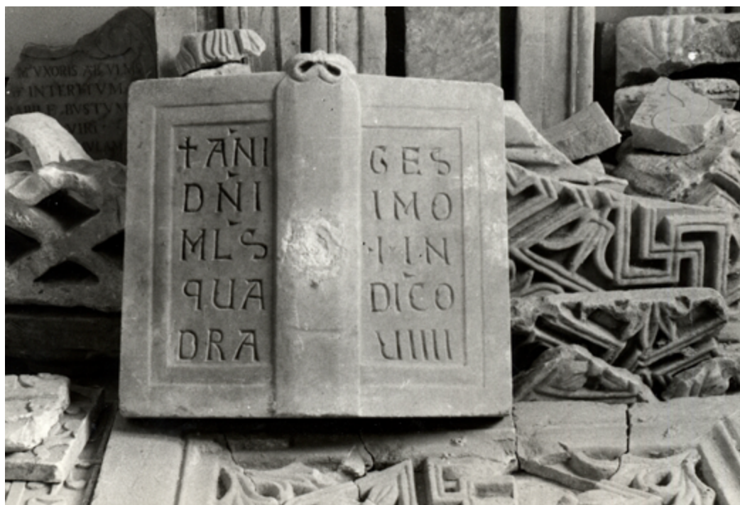
10 Monte Sant'Angelo. Rinvenimento del lettorino del pulpito di Acceptus , 1041.

Per lo studioso svizzero, la scultura pugliese dell'XI secolo derivava da influenze di varia natura fuse e rielaborate secondo caratteri originali 80 . Nell'ambito della Byzantinische Frage la posizione di Wackernagel era sostenuta dalle vicende storiche che avevano interessato il Mezzogiorno d'Italia. Nel segno di una continuità tra l'arte greco-romana e quella medievale, nell'arte pugliese le influenze bizantine erano state costantemente rielaborate in un contesto permeabile per natura, capace di una perfetta fusione tra le suggestioni che derivavano dal mondo arabo, attraverso la mediazione normanna, dal passato altomedievale o 'longobardo' e dagli elementi nordici variamente identificati ma sostanzialmente di influenza 'cluniacense'.