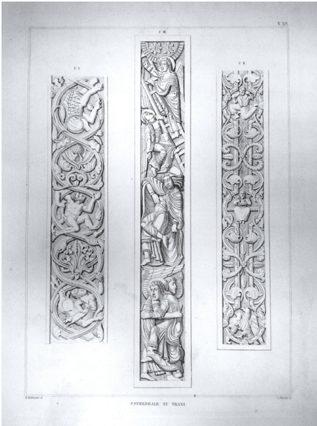
4 San Nicola Pellegrino, Trani. Particolari del portale principale, incisione (da Schulz 1860).

Anche le raffigurazioni dei particolari scultorei, scontornati e improntati alla sperimentazione del valore espressivo della linea, sono eseguiti con lo stesso principio, supportati dalle indicazioni delle misure 25 . È proprio il rilievo basato sull'analisi autoptica del monumento che consente a Schulz di leggere le architetture medievali, gli spazi interni degli edifici, gli arredi scultorei e liturgici, intuendone le forme 'originali'