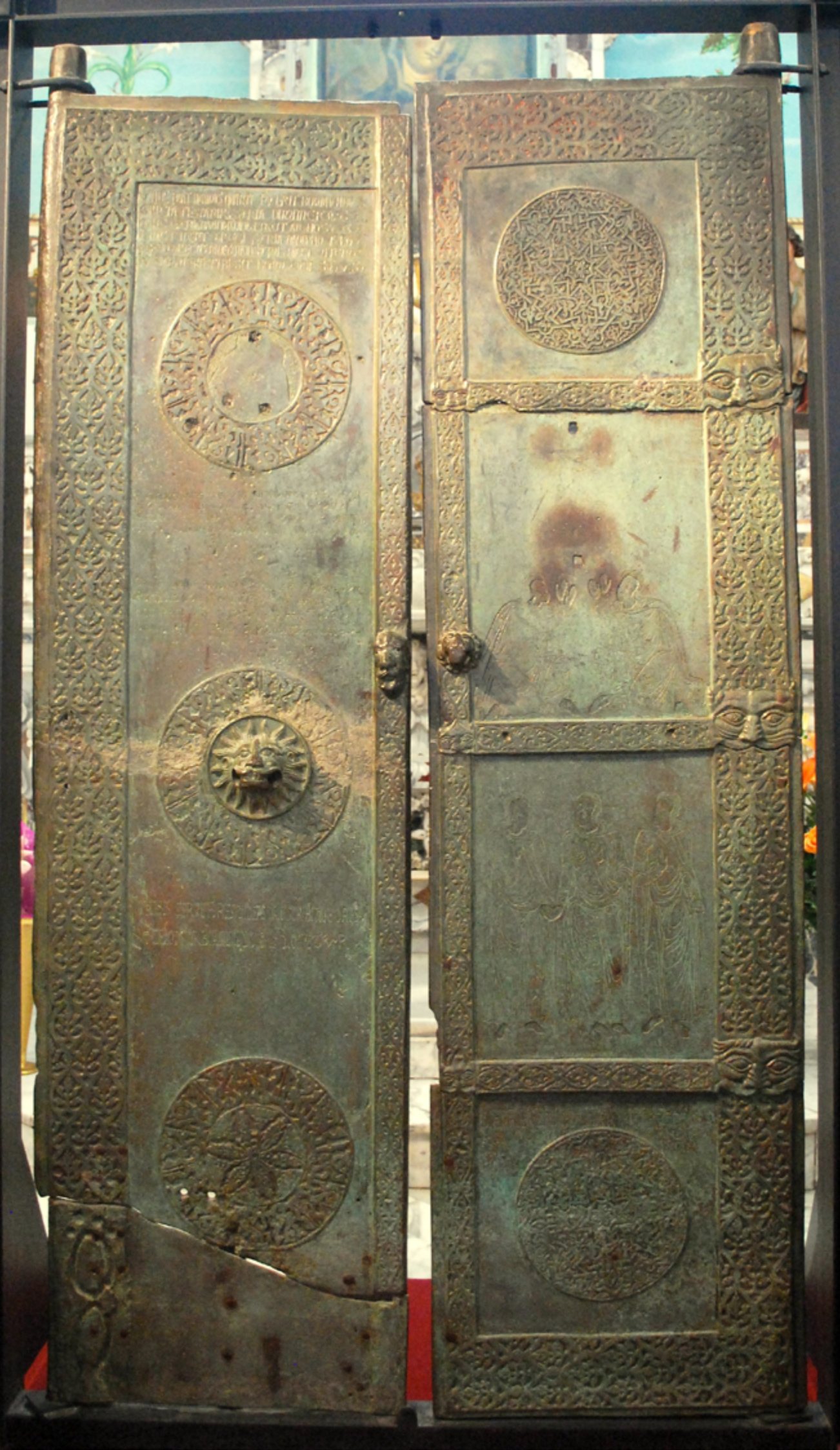
9 Mausoleo di Boemondo, Canosa. Porta bronzea (L. Derosa)