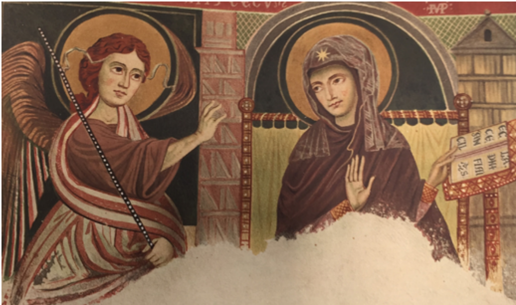
6 Santo Sepolcro, cappella superiore, Barletta. Particolare dell'Annunciazione, litografia a colori (da Salazaro 1877).

di Salazaro, che seguiva un criterio topografico come quella di Schulz, ebbe il grande merito di tratteggiare un profilo complesso della produzione figurativa italomeridionale, attribuendone un ruolo all'interno della cultura italiana e portando l'attenzione su opere fino ad allora del tutto sconosciute agli studi sull'arte medievale del Mezzogiorno.