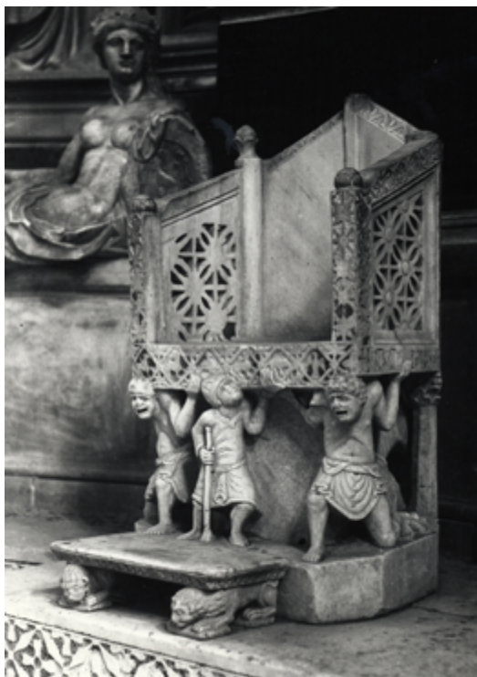
13 San Nicola, Bari. Cattedra di Elia.

Circa la teoria di Porter, aveva espresso le sue perplessità anche Pietro Toesca (1877-1962), che nel 1927 diede alle stampe il già ricordato volume Il Medioevo . Condividendo l'ipotesi di Wackernagel sulla possibile provenienza dello scultore dalla Francia meridionale, Toesca respinse le parentele stilistiche di Porter ancorate alla data del 1098, parlando piuttosto di analogie spiegabili con la «comune derivazione da prototipi classici» e assegnando al Maestro, con l'impareggiabile acutezza dello sguardo che lo contraddistingueva, anche il capitello della cosiddetta iconostasi di San Nicola 93 .