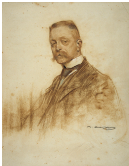
7 Ritratto di Émile Bertaux, pastello su carta di Ramon Casas (Museu Nacional d'Art de Catalunya, Barcelona).

diversa prospettiva storiografica, era stato per Schulz. La modernità dell'approccio dello studioso francese si può misurare dall'importanza che attribuiva alla moderna scienza della geografia umana, allargando i termini della ricerca di carattere storico-artistico alla società e all'ambiente, ben oltre i confini della storia politica 40 . « Pour l'histoire politique, il subsiste seulement des documents et des témoignages, qui ne sont que les signes des faits : les faits eux-mêmes ne sont plus. L'histoire de l'art, se trouve en présence de faits qui, au lieu d'être abolis à jamais, sont présents et visibles comme des êtres vivants. Ces faits sont les monuments et les œuvres » 41 . Il valore essenziale e ineludibile dei dati materiali su cui si fonda la storia dell'arte era stato ribadito da Bertaux nel 1902, in occasione della Prolusione al suo primo corso universitario a Lione 42 . Un concetto su cui interverrà in modo fortemente critico Benedetto Croce per il quale la storia dell'arte «non potrà essere mai altro se non la coscienza della genialità», e non una histoire de la civilisation così come la intendeva Bertaux 43 .