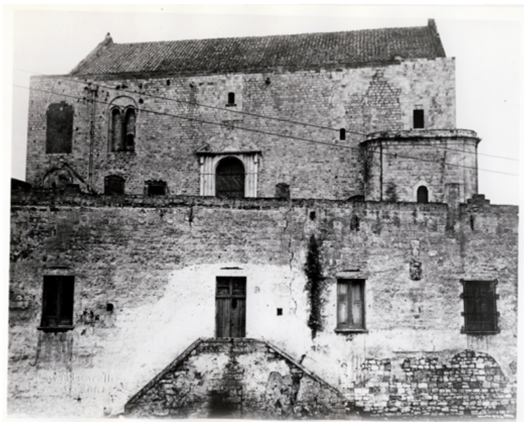
1 San Nicola, Bari. Veduta del prospetto est alla fine del XIX secolo (da Belli D'Elia 1985).

appariva un territorio eterogeneo, naturalmente proteso verso il Mediterraneo orientale, il cui patrimonio medievale era ancora in buona parte nascosto sotto secoli di restauri antichi, trasformazioni, riadattamenti, e in un pessimo stato di conservazione 14 .