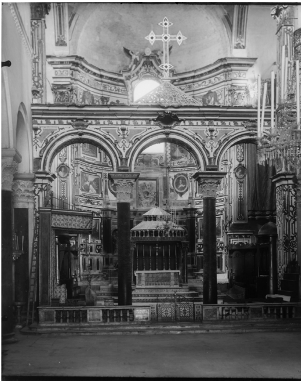
5 San Nicola, Bari. L'abside prima dei restauri degli anni Trenta del XX secolo.

battuta il settore della tutela e conservazione dei beni culturali, argomenti dai quali, in questi decenni, alla luce del grande stato di abbandono del patrimonio artistico locale, le élites intellettuali pugliesi non poterono prescindere nella costruzione di qualsiasi discorso di natura storica 32 .