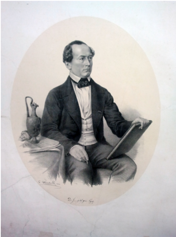
2 Heinrich Wilhelm Schulz (1855), litografia di George Weinold (da Zingarelli 2008).

meridionale da Carl von Rumohr, incontrato in Toscana nel 1832, condivise con lo storico dell'arte tedesco il metodo basato sull'uso storico-critico delle fonti e sull'analisi stilistico-formale delle opere in una prospettiva fortemente storicista 19 .