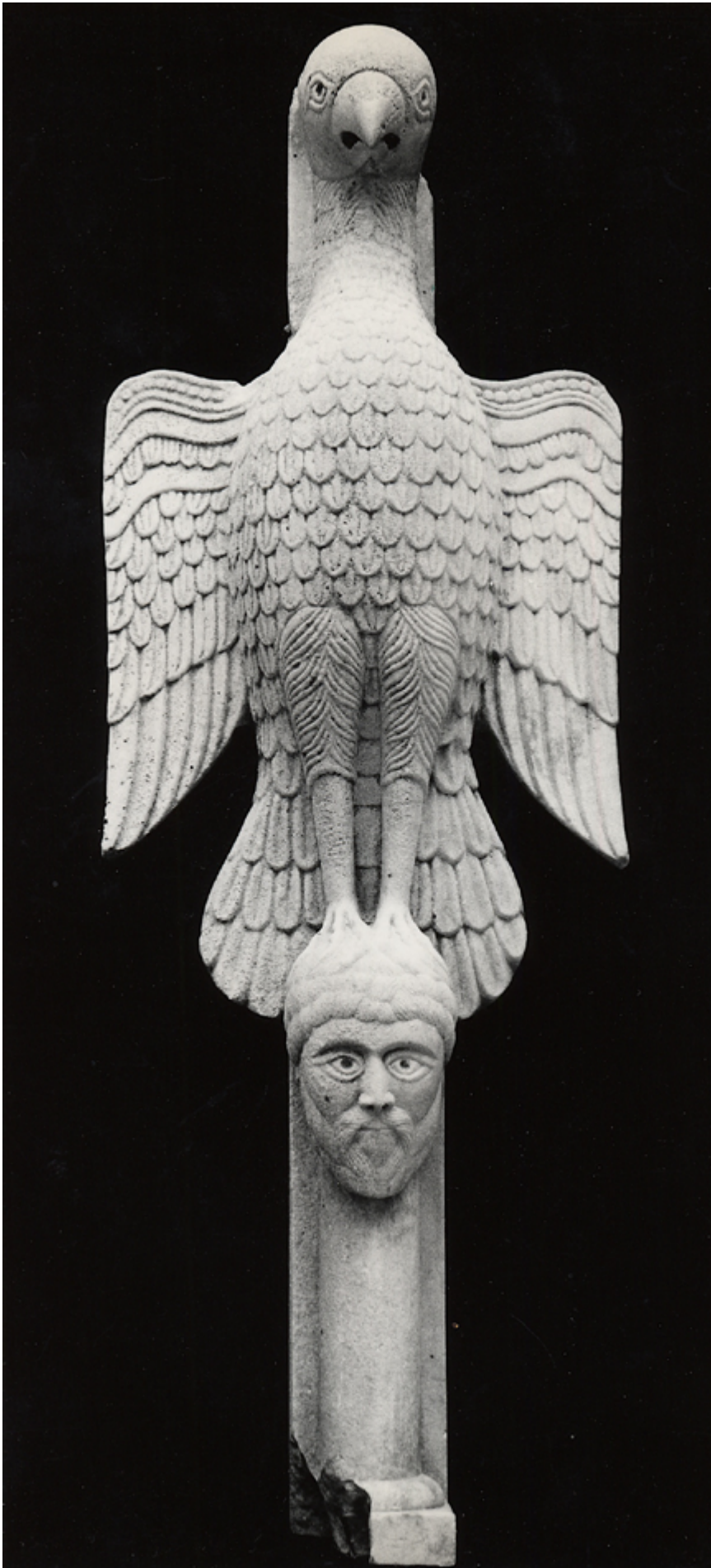
11 Museo lapidario, San Michele Arcangelo, Monte Sant'Angelo. Gruppo scultoreo del pulpito di Acceptus, 1041.