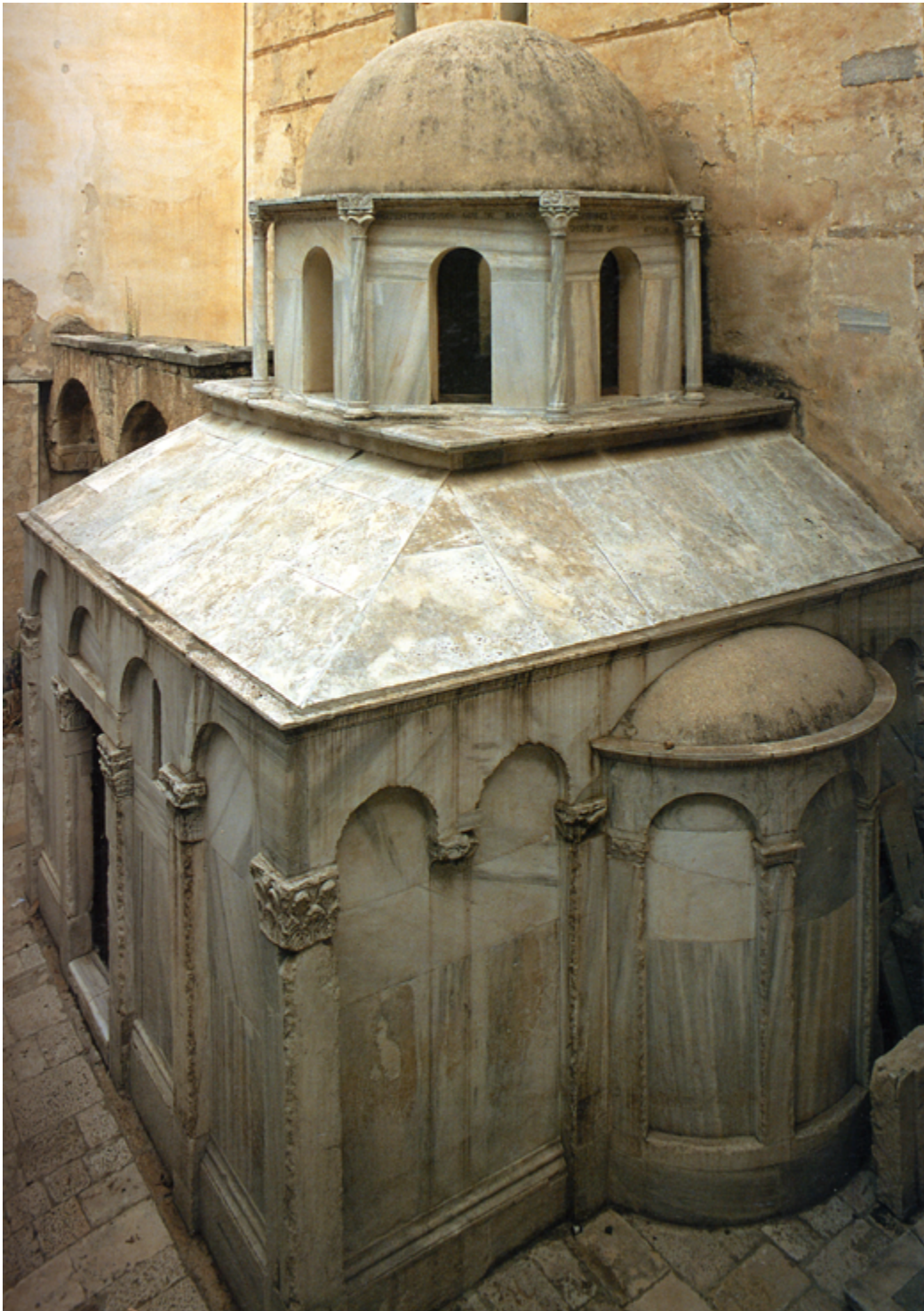
8 Mausoleo di Boemondo, Canosa (L. Derosa)