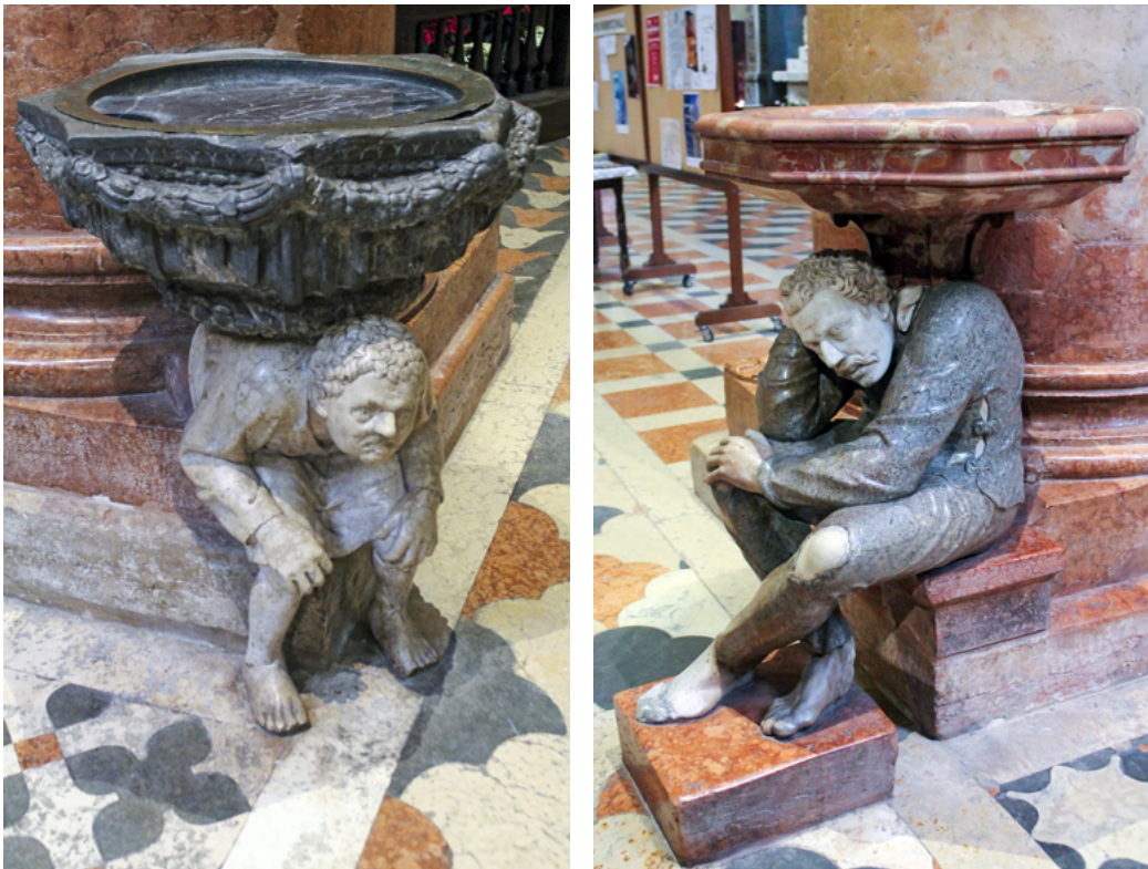
11 Acquasantiere, chiesa di Sant'Anastasia, Verona.

da figure maschili ripiegate su se stesse. La prima, seduta sulla base della colonna, rappresenta un rude popolano, scalzo e abbigliato con una semplice veste. Il volto, dai lineamenti fortemente espressivi, è contratto in un ghigno quasi grottesco, con la bocca aperta e la lingua fra i denti; la schiena è inarcata e le mani poggiano sulle ginocchia a simboleggiare lo sforzo compiuto per sostenere il peso. La seconda scultura, invece, più che gravata dal carico sovrastante appare pensosa, con una mano sul ginocchio sinistro e l'altra sulla testa. L'uomo sembra un «lavoratore abituato alla fatica», il cui viso è «sobrio nella stanchezza» 55 . Egli è ritratto con grande cura come emerge dai dettagli dei capelli e dei baffi che rimandano alla moda dell'epoca, mentre gli abiti usurati e il piede sinistro nudo (il destro è coperto da un calzare) esprimono l'indigenza e al contempo l'umiltà dell'individuo.