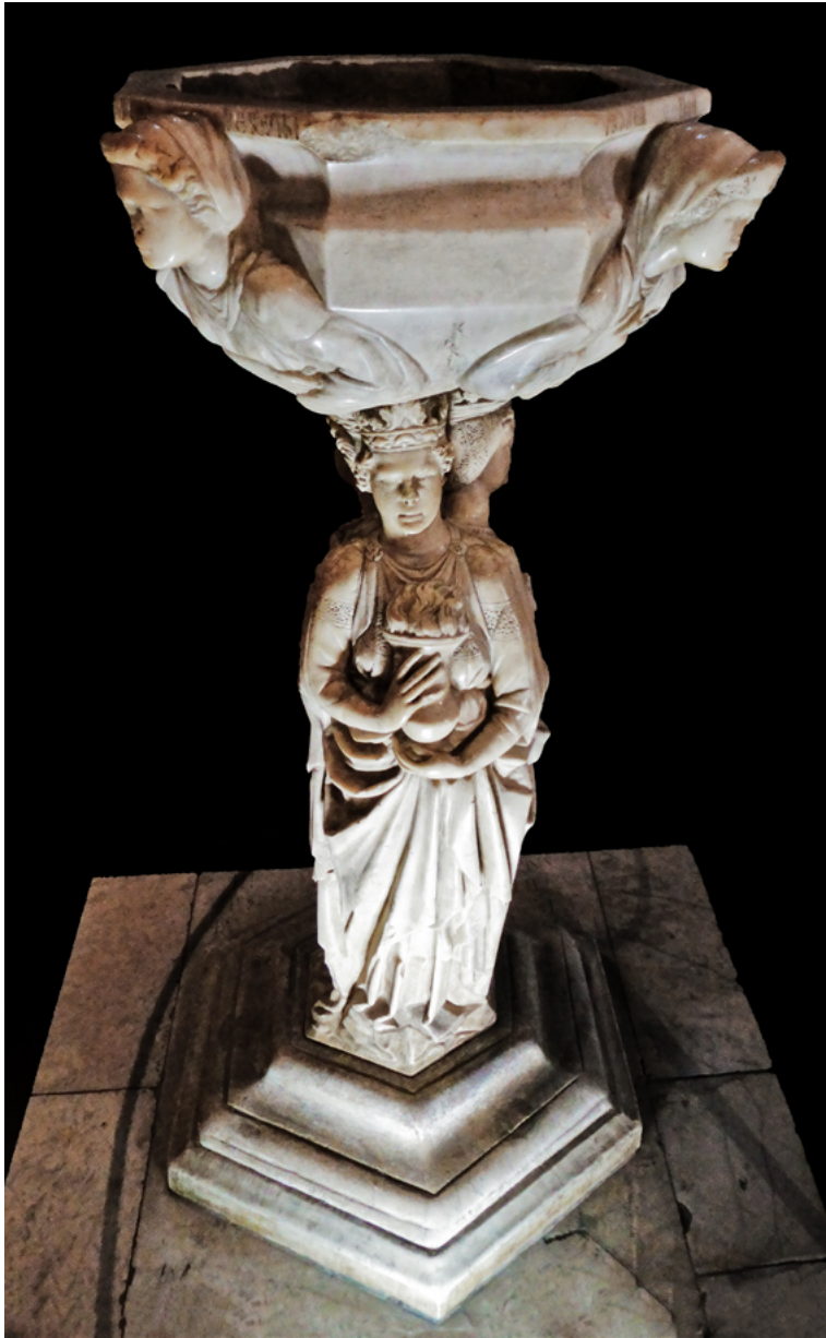
6 Acquisantiera, chiesa di San Giovanni Fuorcivitas, Pistoia.

L'opera consta di un bacino marmoreo ottagonale articolato in specchiature convesse e sorretto da un fusto composto da tre statue di donne stanti, che poggiano su una