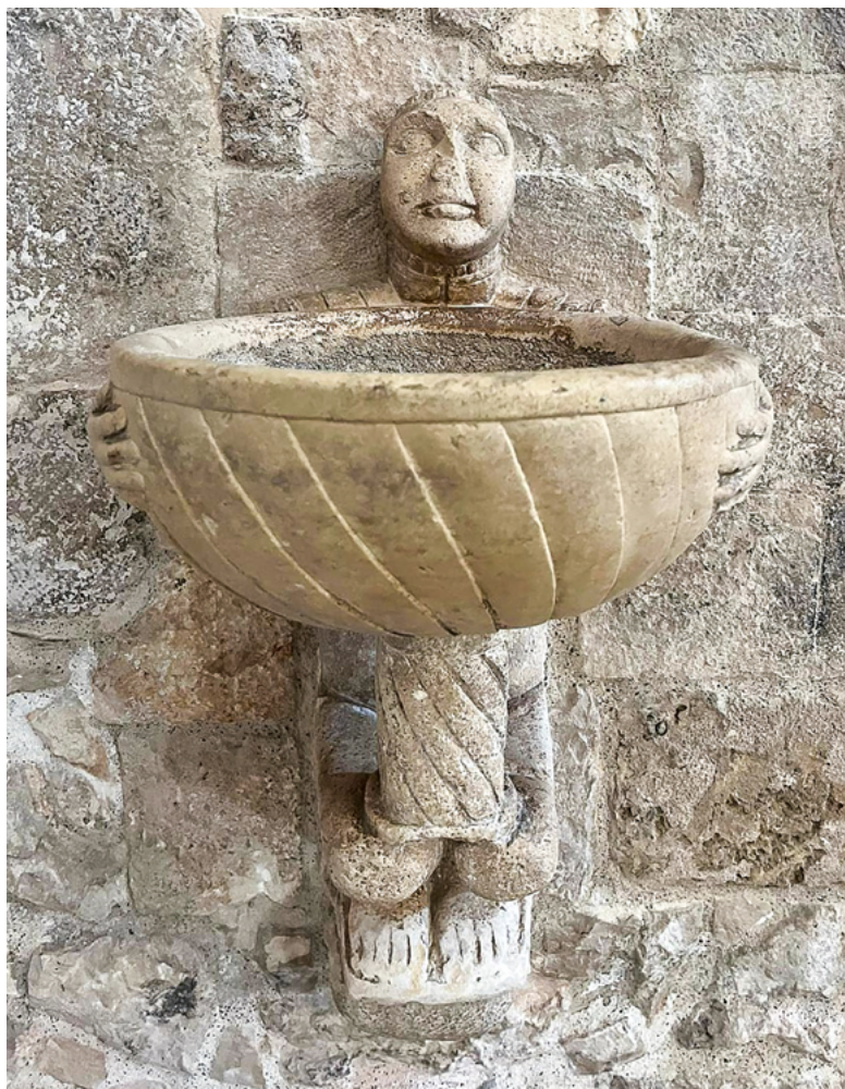
9 Acquisantiera, chiesa di San Corrado, Molfetta (BA) (G. Amodio, © Diocesi di Molfetta-Ruvo-Giovinazzo-Terlizzi).

costituito da un gruppo scultoreo con più figure - una configurazione che si poneva come possibile evoluzione del tipo romanico con i quattro telamoni disposti a croce - bensì da un unico personaggio che assolve interamente la funzione portante. Malgrado ciò, l'impostazione del soggetto, il panneggio anticaggiante, l'espressione ieratica dei volti e le capigliature dal sapore classico osservabili nelle pile due e trecentesche manifestano l'esistenza di una chiara linea di continuità con il periodo successivo.