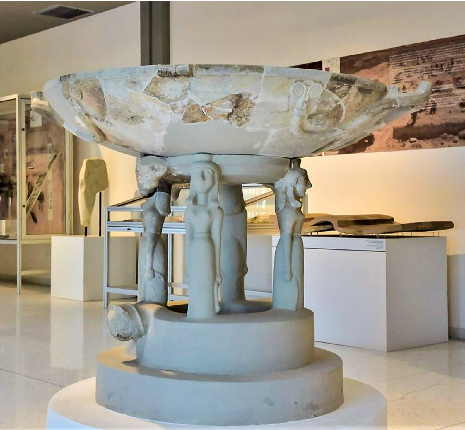
13 Perirrhaterion ricostruito, Museo Archeologico, Isthmia.

piuttosto il ruolo attivo di sentinelle che sorvegliano il limite dello spazio rituale e, attraverso il loro sguardo (che, come nel caso della dea Ecate, si affaccia verso tutte le parti) e la loro stessa presenza, autorizzano il passaggio da uno stato impuro a uno purificato 70 . La loro funzione è, dunque, tanto strutturale quanto simbolica: esse non sostengono soltanto fisicamente il bacino dell'acqua ma ne custodiscono la sacralità, rendendo il gesto dell'abluzione un atto che avviene sotto l'occhio del dio. Il modello antico, sia nella sua forma che nel suo significato, appare in una certa misura assimilato dalle cariatidi delle acquasantiere medievali, che potrebbero in parte derivarne non solo per via tipologica ma anche per la comune carica simbolica, connessa alla difesa della sacralità e alla mediazione tra il mondo umano e la sfera divina 71 .