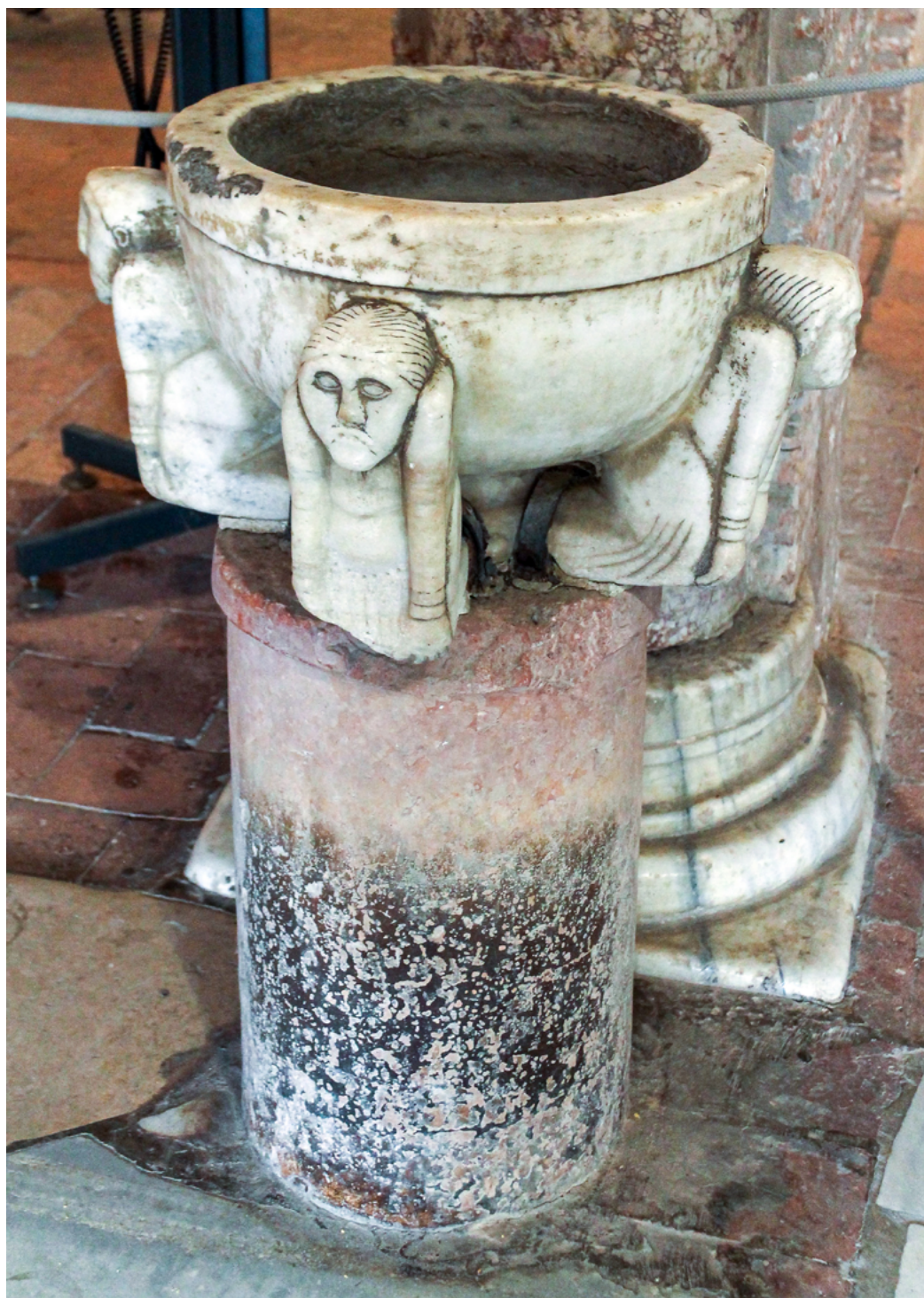
3 Acquisantiera, chiesa di Santa Maria, abbazia di Pomposa, Codigoro (FE).

formano morbide pieghe attorno alle cosce 13 . Malgrado l'affinità tipologica con la pila torcellana, possiamo notare come in questa circostanza i telamoni siano posizionati più in alto e raccordino con migliore disinvoltura le due parti dell'oggetto (catino e fusto) grazie alla loro posa maggiormente realistica e sciolta.