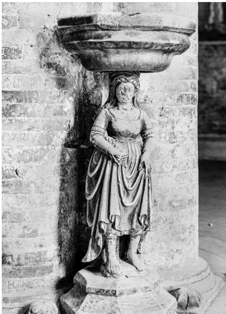
10 Acquisantiera, duomo di Santa Maria Assunta, Atri (TE) (ICCD-Gabinetto Fotografico Nazionale, Fondo GFN, n. inv. E002057).

Un'ulteriore variante del telamone, riconducibile al medesimo filone espressivo caratterizzato da accenti vernacolari e attenzione al dato reale, si incontra nelle due 11 acquasantiere rette da 'gobbi' nella chiesa di Sant'Anastasia a Verona, che nel secolo scorso suscitavano particolare curiosità tra i visitatori 52 . Diverse sono le attribuzioni e le cronologie proposte per le due opere: quella di sinistra fu presumibilmente realizzata nel primo Quattrocento da un anonimo scultore locale oppure di provenienza lombarda, mentre quella di destra, nota come il 'Pasquino' in quanto venne collocata entro l'edificio nella Pasqua del 1591 (data incisa sul bacile), fu commissionata da un tale Paolo Orefice 53 e forse eseguita da Angelo Rossi, padre del pittore Giovanni Battista Rossi detto il Gobbino 54 . Le due pile sono costituite da vasche mistilinee, in marmi colorati, sorrette