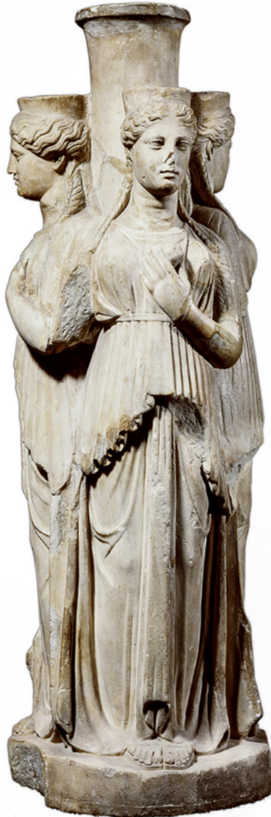
12 Statua di Ecate triforme, Rijksmuseum van Oudheden, Leiden.

12 Esempi eloquenti in tal senso sono la pila pistoiese di San Giovanni Fuorcivitas e la sua filiazione calabrese, nel cui schema è stato riconosciuto un chiaro riferimento a modelli provenienti dall'immaginario greco-romano, in particolare alle statue di Ecate costituite da un gruppo di tre figure muliebri stanti, addossate le une alle altre attorno a un asse centrale a significare la presenza della dea in ogni direzione 63 . Ella, infatti, è ritenuta la protettrice degli incroci, delle porte e in generale degli ingressi, una divinità 'liminare' che agisce come custode dei passaggi e delle soglie fra diverse realtà 64 .