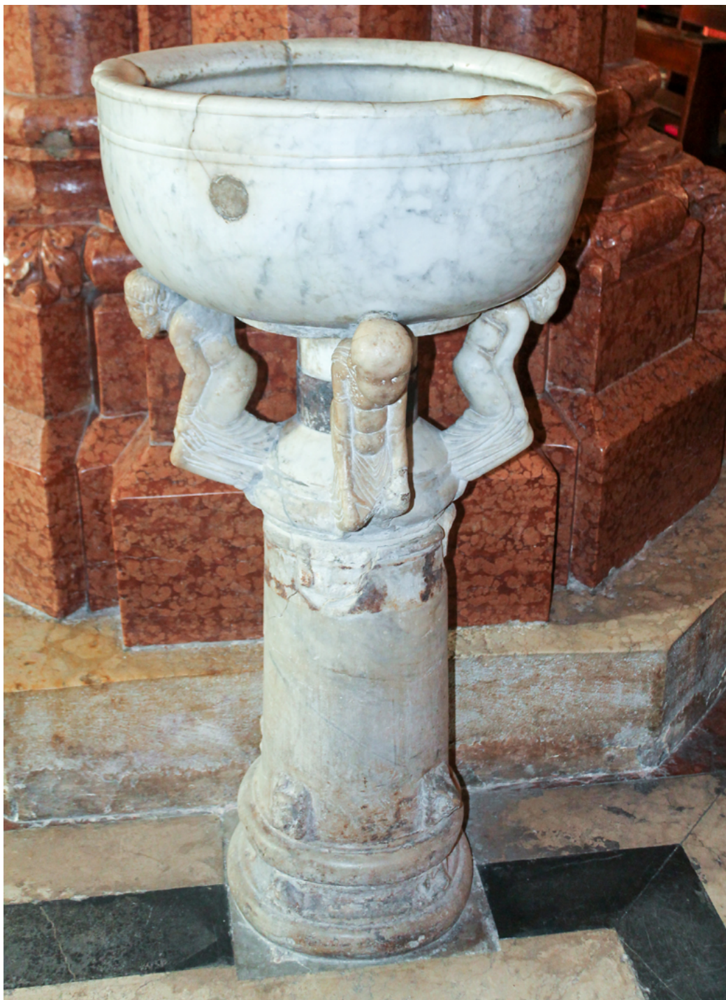
2 Acquasantiera, cattedrale di Santa Maria Assunta, Verona.

2 La componente continentale risulta ancora più evidente nell'acquasantiera della cattedrale di Verona 12 , generalmente riferita alla metà del XII secolo, che ripropone lo stesso schema: il bacino superiore, di forma circolare, è posizionato sulle spalle di tre telamoni che si incurvano sotto il suo peso. I personaggi (originariamente in numero di quattro e disposti a croce) poggiano sopra un fusto di colonna con base cilindrica, profilata in basso da una scozia e due tori e circondata da teste animalesche a rilievo. Gli atlanti sono rappresentati con la schiena inarcata per lo sforzo e le gambe spinte in avanti: le mani afferrano le ginocchia, strette una contro l'altra, sollevando le vesti che