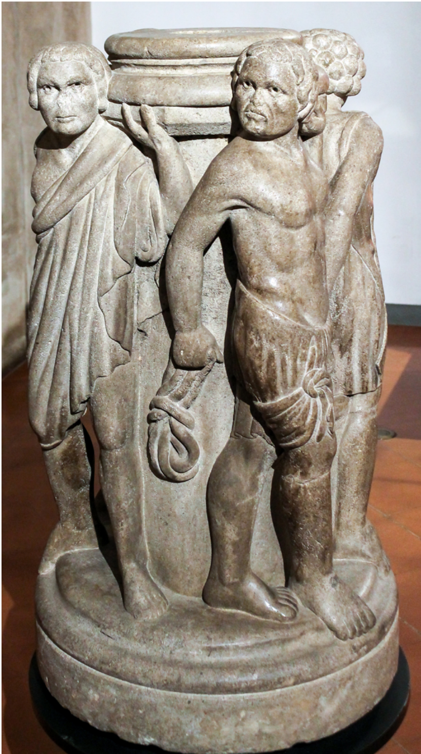
5 Base di acquasantiera, Museo Civico Medievale, Bologna (G. Amodio, © Musei Civici d'Arte Antica di Bologna).

Essi sono raffigurati seminudi, con addosso solamente abiti dimessi, da schiavi o manovali, sotto i quali emergono turgide muscolature dal sapore classicheggiante, rese con grande naturalismo 24 . L'abbigliamento essenziale e gli strumenti - un utensile