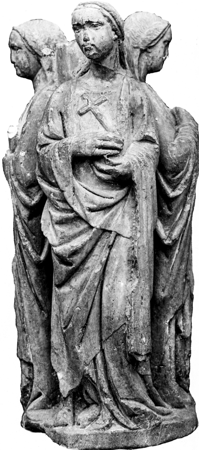
7 Base di acquasantiera, Galleria Nazionale, Palazzo Arnone, Cosenza (ICCD-Gabinetto Fotografico Nazionale, Fondo GFN, n. inv. E016230).

Originariamente situata nella parrocchiale di Sant'Agostino a Cassano allo Jonio (CS), la base fu alienata abusivamente nel 1925 dal parroco della stessa chiesa e sequestrata l'anno successivo presso un antiquario di Firenze; venne quindi trasferita al Museo Nazionale di Reggio Calabria, dove rimase alcuni anni prima di giungere alla sua