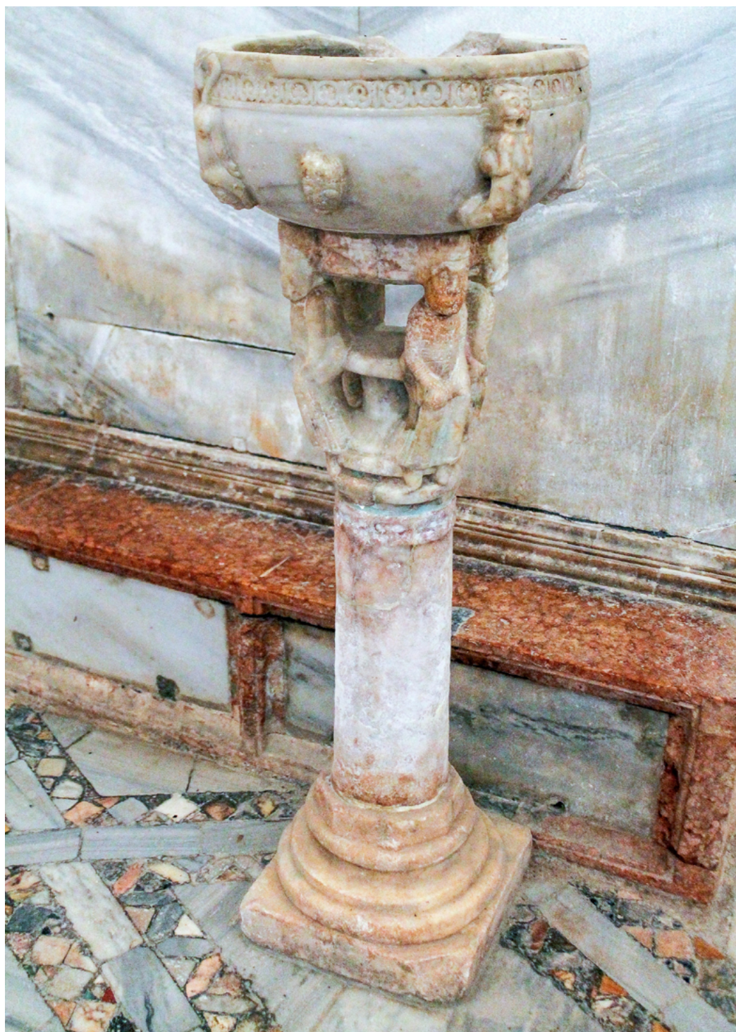
1 Acquanteria, basilica di Santa Maria Assunta, Torcello (VE).

Nell'opera, la cui datazione oscilla tra gli ultimi decenni dell'XI e i primi del XII secolo, sono state individuate sia suggestioni lagunari (per la decorazione delle cornici) 10 , che di carattere 'continentale' (per la presenza del telamone) 11 .