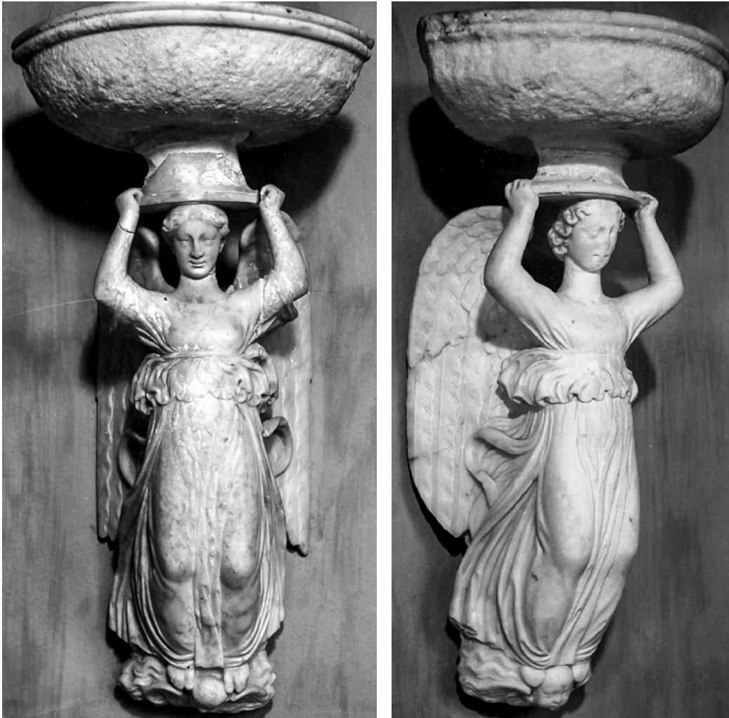
8 Acquasantiere prima della dispersione, Villa Medici, Careggi (FI) (da Gentilini 1994).

di Filippo Brunelleschi e alla mano di Andrea di Lazzaro Cavalcanti detto il Buggiano, esse consistono in una coppia di vasche dalla forma 'a barchetta' sostenute con le braccia da figure angeliche a tuttotondo che si ergono, in una posa precaria, sulla testa di un cherubino. Si tratta, a differenza degli esemplari fin qui citati, di due pile pensili, concepite per essere innestate a una certa altezza nella parete. Le sculture, riferibili agli anni successivi al 1445 - quando il Buggiano realizza il suo secondo lavamani per la cattedrale fiorentina - mostrano una ripresa puntuale del modello delle vittorie alate così come vengono rappresentate in alcuni bronzetti antichi: con le braccia alzate, il panneggio mosso dal vento e i piedi che posano instabilmente su un globo.