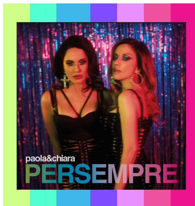
Paola & Chiara PER SEMPRES.