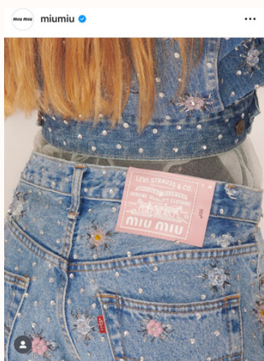
Miu Miu x Levi's; Instagram

Da qualche anno il Gruppo Prada si impegna nella realizzazione di una moda sostenibile e circolare, specialmente con i suoi marchi più iconici, Prada e Miu Miu. Nel 2020 lancia il progetto Miu Miu Upcycled selezionando 80 abiti vintage non firmati risalenti al periodo dagli anni Trenta agli anni Ottanta, dando inizio ad una vera e propria tradizione. Ad aprile 2021, infatti, il marchio Miu Miu collabora con Levi's nella reinterpretazione di alcuni capi iconici del brand, come i jeans Levi's 501 da uomo e la Trucker Jacket , rivisitati seguendo l'estetica di Miu Miu: spiccano ricami in cristallo, perle e fiori, le maniche a palloncino in duchesse, la pelle lavorata a intarsio ispirata