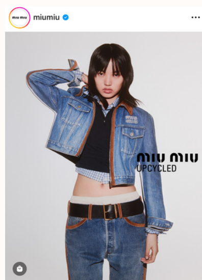
Miu Miu Upcycled, Instagram

La campagna viene accompagnata anche da una capsule collection che celebra il Capodanno cinese, all'insegna di polo, cardigan, slip di cachemire e le celebri borse Wander e Arcadie. Per la prima volta il progetto comprende anche le borse: Miu Miu Upcycled Patch è realizzata con i residui di lavorazione della pelle di alcuni prodotti Miu Miu, seguendo i principi della decostruzione. Inoltre, la partnership con l'AuraBlockchain Consortium, associazione no-profit che monitora la trasparenza dell'industria del lusso, garantisce ulte-