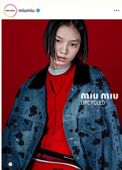
Upcycled Miu Miu: Denim; Instagram

Da qualche anno il Gruppo Prada si impegna nella realizzazione di una moda sostenibile e circolare, specialmente con i suoi marchi più iconici, Prada e Miu Miu. Nel 2020 lancia il progetto Miu Miu Upcycled selezionando 80 abiti vintage non firmati risalenti al periodo dagli anni Trenta agli anni Ottanta, dando inizio ad una vera e propria tradizione. Ad aprile 2021, infatti, il marchio Miu Miu collabora con Levi's nella reinterpretazione di alcuni capi iconici del brand, come i jeans Levi's 501 da uomo e la Trucker Jacket , rivisitati seguendo l'estetica di Miu Miu: spiccano ricami in cristallo, perle e fiori, le maniche a palloncino in duchesse, la pelle lavorata a intarsio ispirata