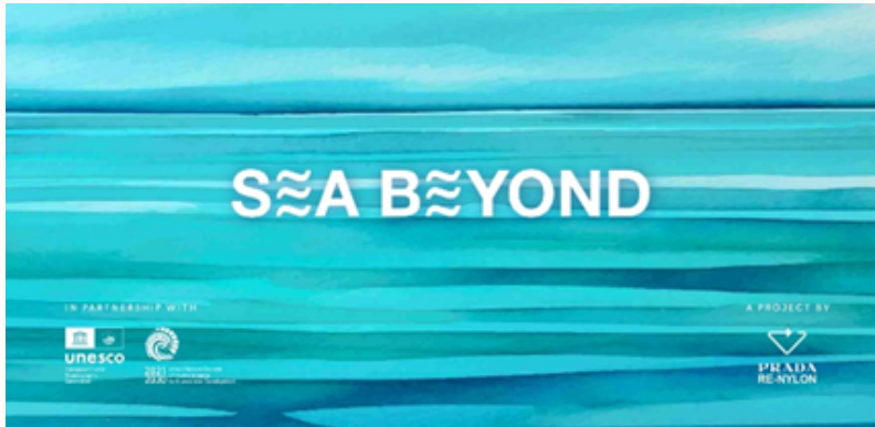
Progetto Seay Beyond, Prada group

Consapevolezza e conoscenza riguardo le questioni ambientali e sociali sono due pilastri fondamentali nel settore del fashion, e le aziende questo lo hanno ben intuito. Collante fra le due questioni è Prada che, attraverso il progetto “sea Beyond”, ha rappresentato il filo conduttore per molteplici altre. Condotto a Venezia dal 2019, il grande progetto si propone l’obiettivo di combinare l’impegno nel mondo della moda al supporto ambientale, tangibile alla tutela degli oceani e del mare.