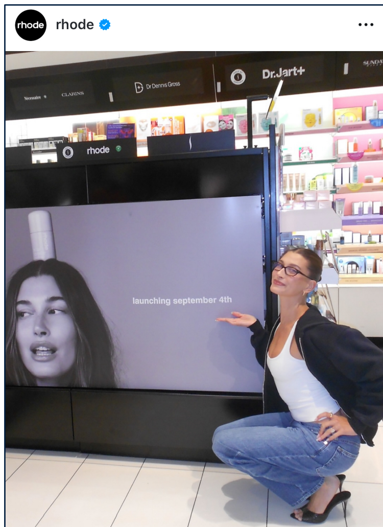
Post Instagram @rhode