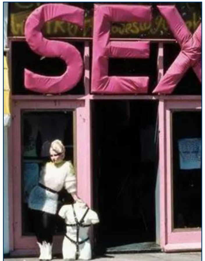
Il negozio SEX di Vivienne Westwood, dal sito Cultura Colectiva