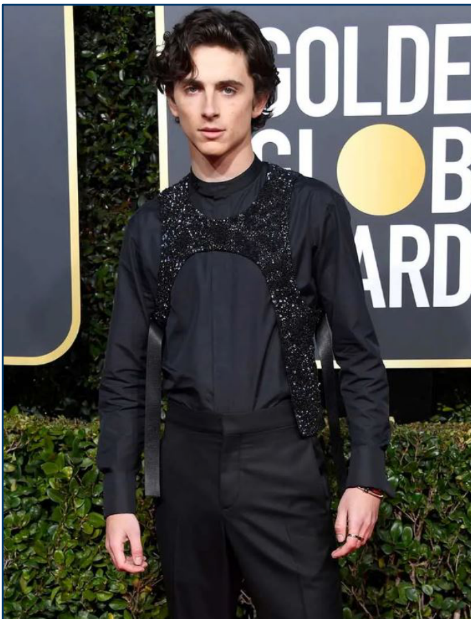
Timothée Chalamet da British Vogue

I feticisti adorano il vinile, il lattice e la pelle, tant'è che nel secondo dopoguerra, in USA, nacque la sottocultura del leather fetish, il cui look trasgressivo si diffonde poi fuori dai club. Il boom avviene negli anni '80, complice anche il femminismo grazie a cui il sesso è divenuto argomento di conversazione. È il momento del corsetto-motocicletta di Mugler e del bustier con il seno a cono di Jean Paul Gaultier; Vivienne Westwood inaugura il negozio SEX, specializzato in vestiario fetish in chiave punk, che così entra nello streetwear.