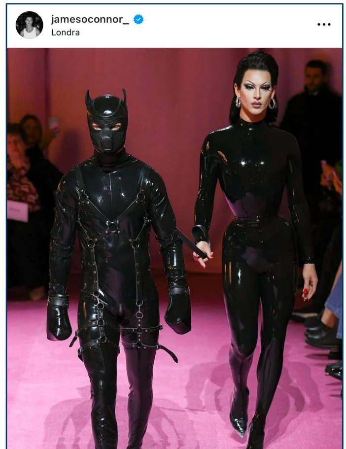
Richard Quinn FW22.