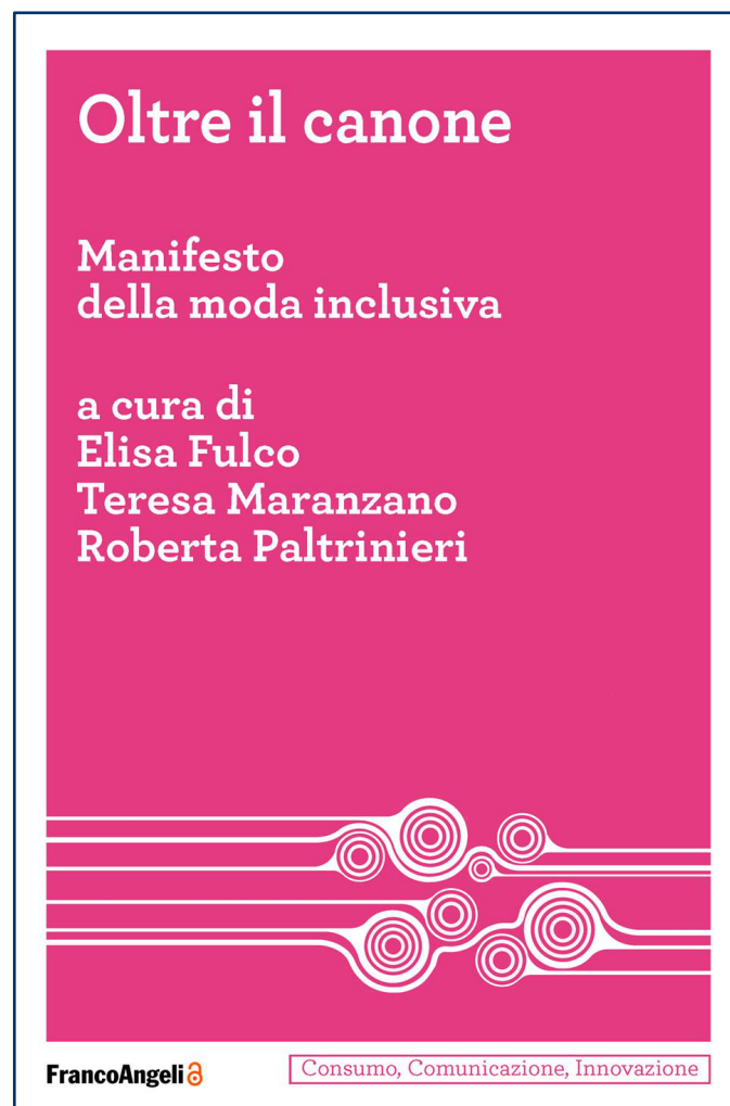
Immagine di copertina del manifesto "Tu es canon"

grazie alla quale sono state realizzate interviste con i propri pazienti, in merito alla questione dello stile per tutti. Le interviste, in seguito pubblicate sul volume, hanno evidenziato l'opinione comune fra i pazienti, secondo i quali il diritto allo stile dovrebbe essere considerato primario e universale. Il volume si trova online, in formato PDF, ed è gratuito, affinché chiunque voglia attingergli possa farlo in maniera accessibile e senza costi aggiuntivi.