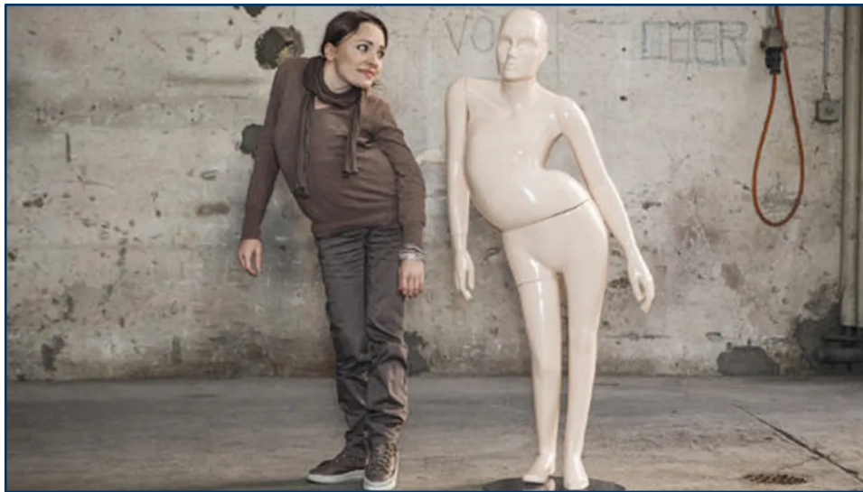
Immagine di un manichino dalla mostra “Nessuno è perfetto”, realizzata dall'associazione svizzera “Pro Infirmis”

Le interviste proposte all'interno del manifesto mostrano come la società e l'industria della moda, con l'aumento delle disuguaglianze, necessitino di una sempre maggiore preparazione e di una sempre più attenta riflessione sulle risposte alle istanze sociali, a cui è richiesto uno spostamento verso l'ambito pubblico, al fine che diventino vere e proprie manifestazioni e atti politici».