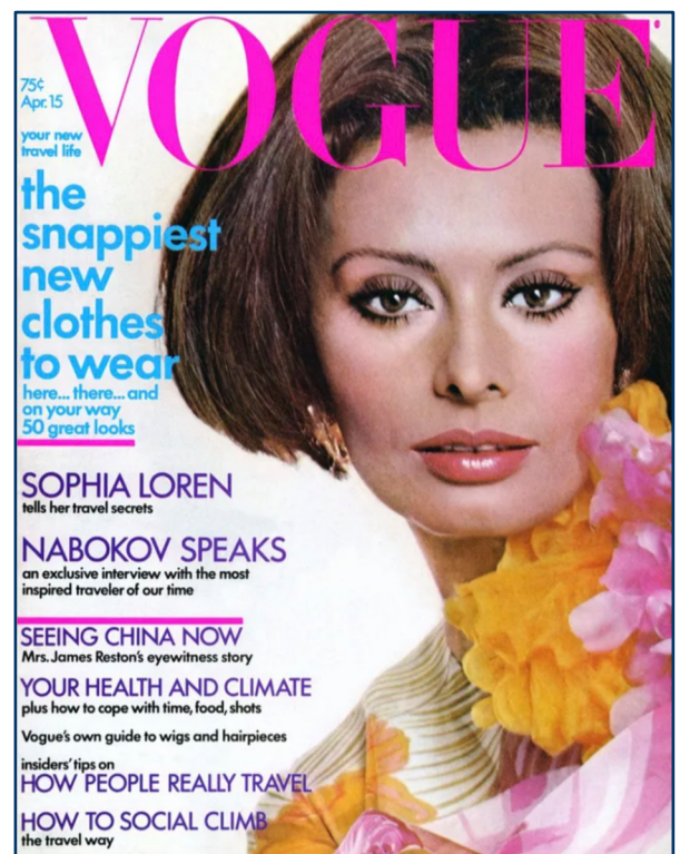
Cover di Vogue, Aprile 1972

Un'altra grande differenza riguarda il consumo: negli anni 70' si comprava meno e i capi si utilizzavano per più tempo, oggi il fenomeno del fast fashion ha reso l'abbigliamento più accessibile ma allo stesso tempo più effimero. Allo stesso tempo però cresce una grande consapevolezza che riguarda il rispetto per l'ambiente, dunque molto spesso vediamo incentivato il riuso e il recupero di capi d'abbigliamento.