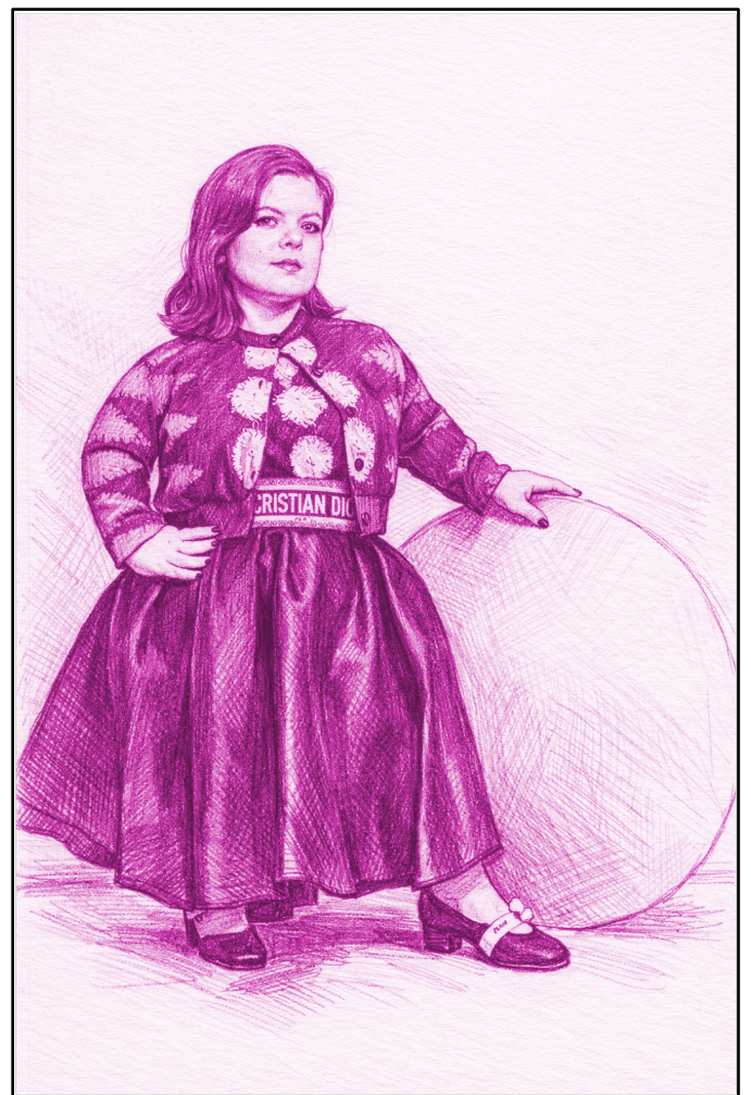
Immagine generata artificialmente

Per una persona che soffre di una malattia simile a quella di Burke, la propria fisicità è spesso ridicolizzata, e per questo, nella realizzazione del vestito, il brand si è adoperato per assicurarsi che esso non avrebbe dovuto avere unicamente la funzione di "costume", ma anche quella di un riflesso della personalità della donna, grazie al quale sarebbe stata in grado di trasmettere i propri pensieri.