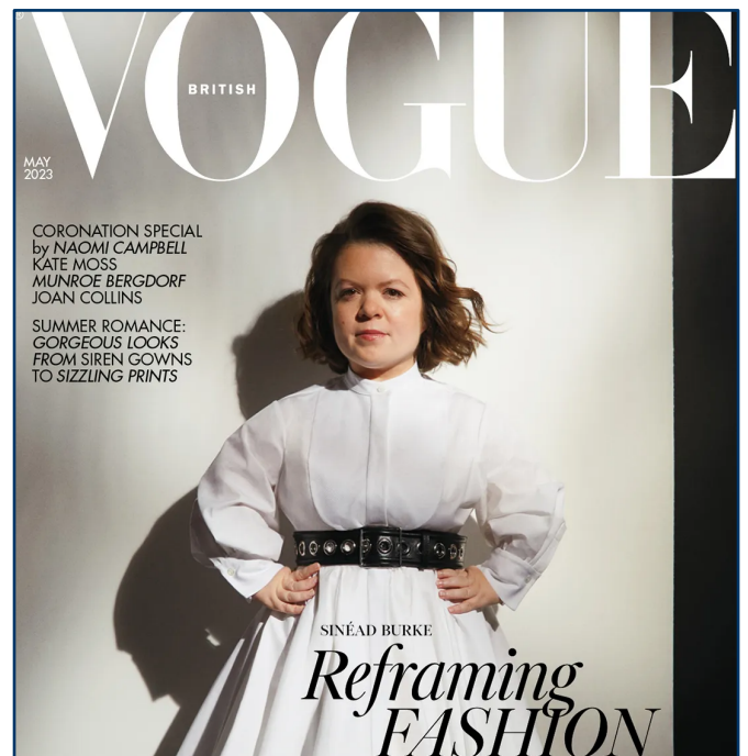
Sinead Burke sulla copertina di British Vogue , issue " Reframing Fashion "

Da sempre le copertine di Vogue riscuotono grandissimi successi, soprattutto grazie alle proprie grafiche, ai protagonisti, o alle proposte presentate, e apparirvi, per Sinead, ha significato un notevole aumento di visibilità a livello internazionale e, di conseguenza, una crescente sensibilizzazione sul tema dell'inclusione e delle disabilità all'interno del mondo del fashion.