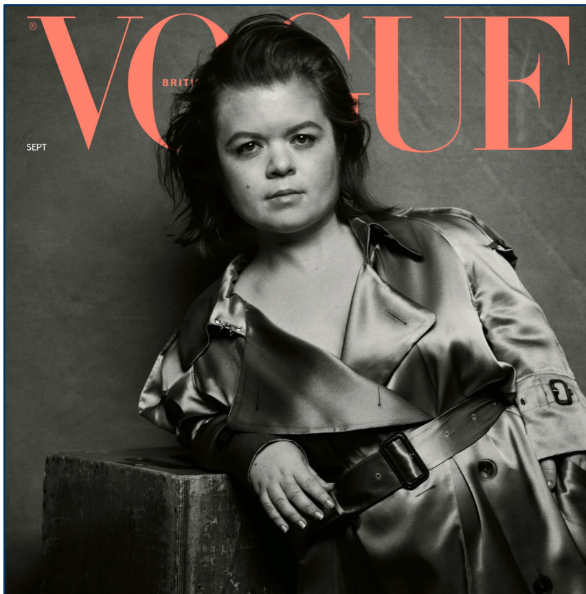
Issue "Forces for change", Vogue

Ad oggi, Sinead Burke lavora come membro del consiglio di stato d'Irlanda, vive a Dublino e, occasionalmente, partecipa a diversi talk show in giro per il mondo, nei quali si ritrova a dibattere e parlare di temi cardine nella sua esperienza di attivismo, come l'inclusività nell'industria della moda e, in generale, in ambienti prettamente esclusivi o tendenzialmente canonici.