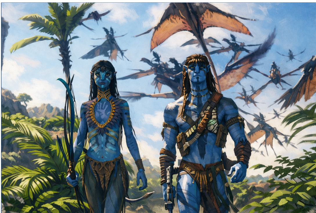
Immagine generata artificialmente

Con Fire and Ash, James Cameron trasforma il cinema in uno strumento critico potente: un'arte capace di interrogare la diversità non come slogan, ma come esperienza reale, dolorosa e necessaria. Pandora diventa così uno specchio del nostro mondo, ricordandoci che equità e inclusione non sono mai automatiche, ma scelte continue.