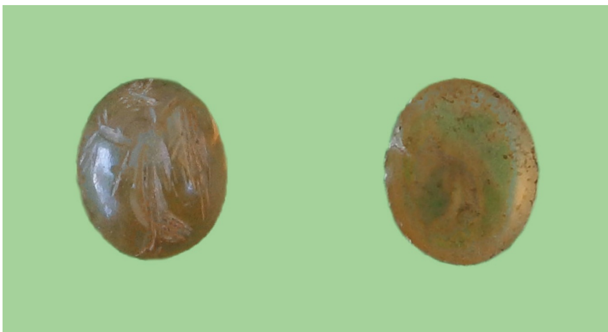
Fig. 1. La corniola con Vittoria (fronte e retro).