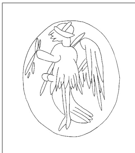
Fig. 2. La faccia convessa con l'intaglio raffigurante Vittoria, (disegno di D. Nebuloni)