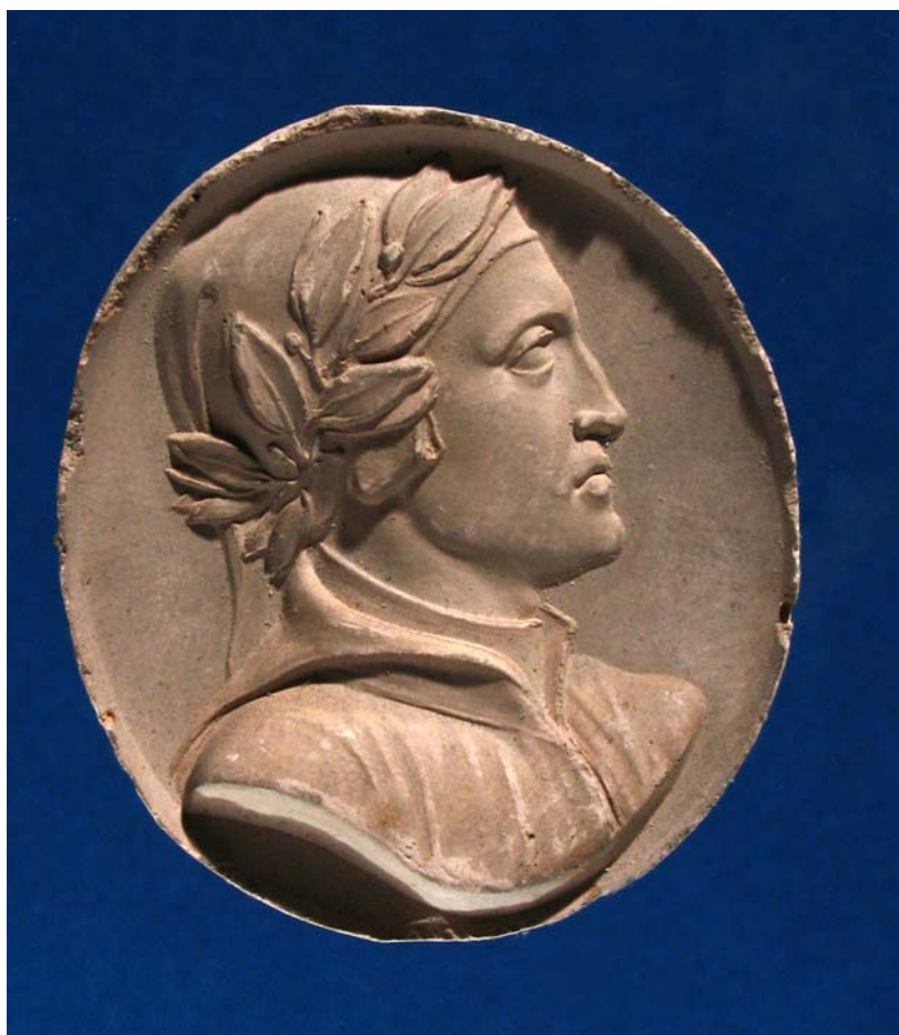
Fig. 14. Cammeo. Dante. Calco.

Il calco ottagonale con il ritratto del Petrarca (n. 8031; fig. 15) testimonia un intaglio in agata bianca orientale, non conservato in originale, bensì documentato da quattro pezzi uguali, ottagonali, in un materiale difficilmente definibile (pasta vitrea? ceralacca?), firmati BER nel taglio del busto, disposti in fila su un cartoncino rettangolare su cui sono annotati alcuni versi del poeta 158 . Il pezzo alquanto bizzarro, per l'iterazione dell'immagine del Petrarca (quattro profili in bianco spiccano sui fondi del colore corrispondente ai versi del poeta: verde, rosso, marrone, rosa), conservato nei Musei Civici di Pavia, dovrebbe provenire dal legato del 1833 (che quindi sembra fornire una datazione ante quem per il ritratto stesso) del marchese Luigi Malaspina di Sannazzaro (1754-1835), colto collezionista e mecenate che giocò un ruolo di primo piano nella vita pubblica e culturale pavese.