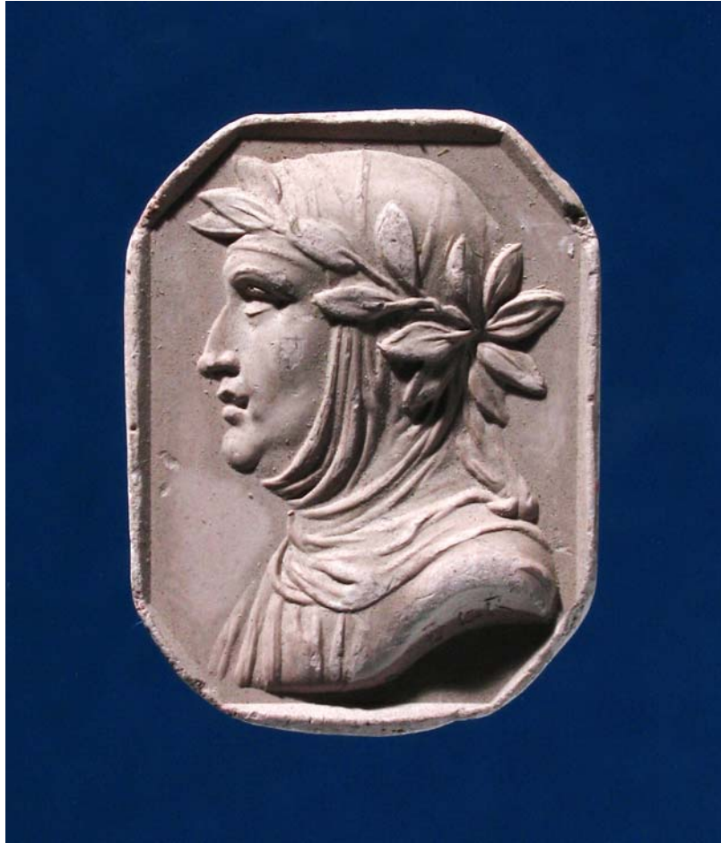
Fig. 15. Antonio Berini. Intaglio. Petrarca. Calco. Trieste, Civici Musei di Storia ed Arte.

Di altre immagini della galleria di Uomini Illustri proposta da Berini la raccolta triestina conserva i calchi: ancora Dante (due impronte uguali: nn. 8026, 8028) (fig. 16), Raffaello (n. 8014) (fig. 17), Michelangelo (n. 7949) (fig. 18).