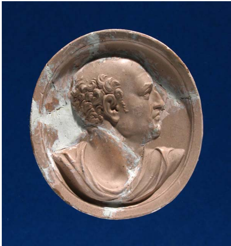
Fig. 7. Antonio Berini. Cammeo. Mecenate. Calco. Trieste, Civici Musei di Storia ed Arte.

Si distingue una serie di cammei, dal rilievo piuttosto alto, con gli Uomini Illustri (nn. 7952-7953, 7958, 8010, 8020, 8022-8023, 8029-8030, 8033-8035), di cui rimangono le impronte in scagliola anche nel contenitore n. 63 a forma di libro, conservato nella collezione di calchi del Medagliere delle Civiche Raccolte Numismatiche di Milano 156 . Sono ritratti Mecenate (così è specificato sul retro del calco milanese) (fig. 7), Dante (fig. 8), Petrarca (fig. 9), Leonardo da Vinci (fig. 10), Michelangelo (fig. 11), Shakespeare (fig. 12) e, assai probabilmente, Raffaello (fig. 13) 157 .