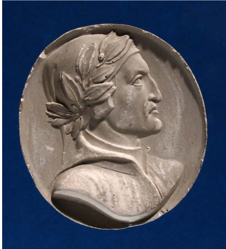
Fig. 8. Antonio Berini. Cammeo. Dante. Calco. Trieste, Civici Musei di Storia ed Arte.