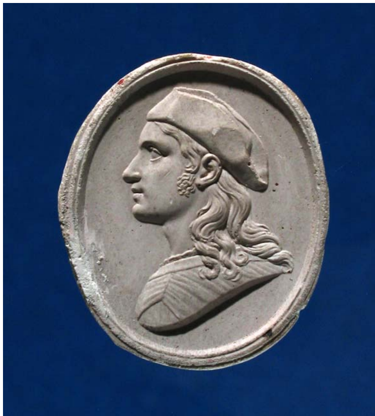
Fig. 17. Antonio Berini. Raffaello. Calco. Trieste, Civici Musei di Storia ed Arte.