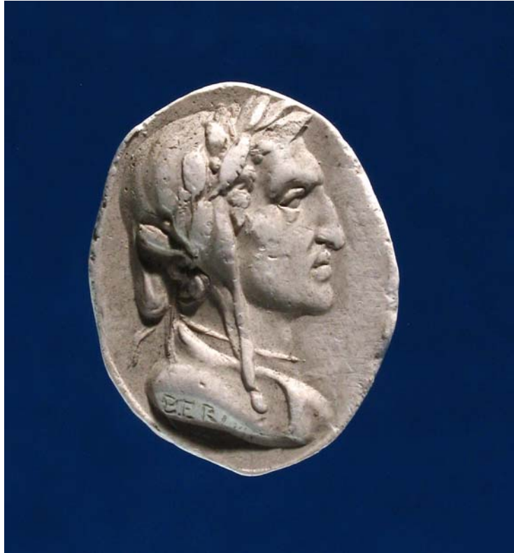
Fig. 16. Antonio Berini. Dante. Calco. Trieste, Civici Musei di Storia ed Arte.