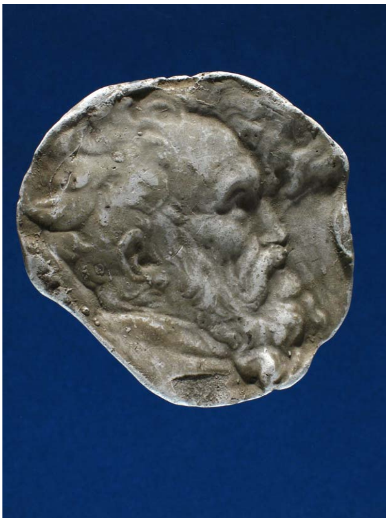
Fig. 18. Antonio Berini. Michelangelo. Calco. Trieste, Civici Musei di Storia ed Arte.

Grazie al cammeo di Giovanni Antonio Santarelli (disperso, ne rimangono i calchi e una cera) 159 , con l'iscrizione "ALEXANDER TASSONIUS", si può specificare che è ritratto appunto il poeta Alessandro Tassoni nelle quattro impronte (nn. 7969-7972) identiche tra loro e quasi uguali all'esemplare del Santarelli (fig. 19).