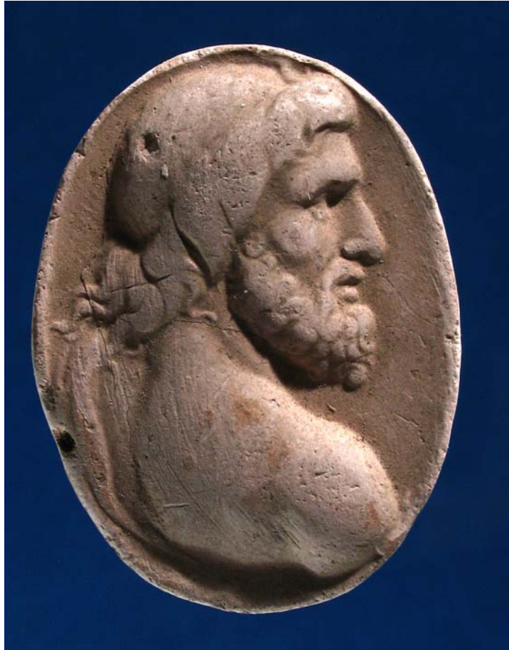
Fig. 5. Antonio Berini. Esculapio. Calco. Trieste, Civici Musei di Storia ed Arte.

intagli di Giovanni Pichler - entrambi d'invenzione, del tutto somiglianti tra loro, uno databile tra il 1766 e il 1771 - 125 e un cammeo dello stesso 126 , un intaglio di Luigi Pichler 127 , un pezzo di Giovanni Beltrami 128 , un cammeo e due intagli non firmati, attribuiti a officine italiane della seconda metà del XVIII secolo 129 .