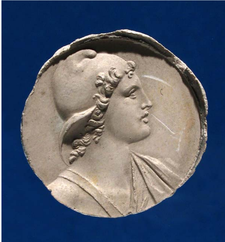
Fig. 6. Antonio Berini. Paride. Calco. Trieste, Civici Musei di Storia ed Arte.