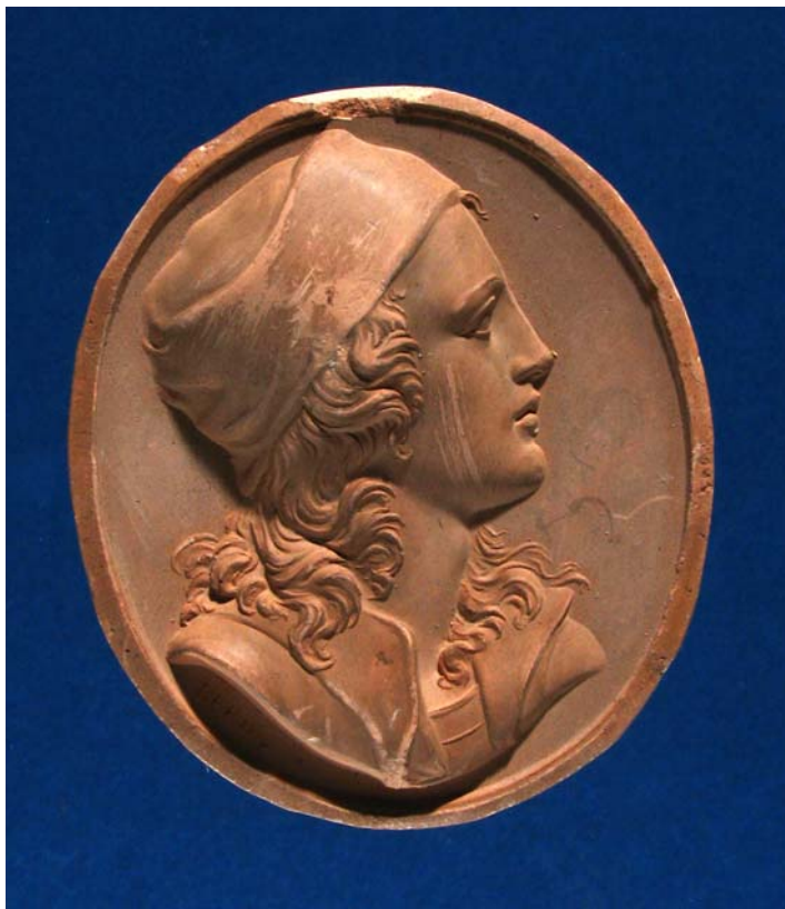
Fig. 13. Antonio Berini. Cammeo. Raffaello. Calco. Trieste, Civici Musei di Storia ed Arte.