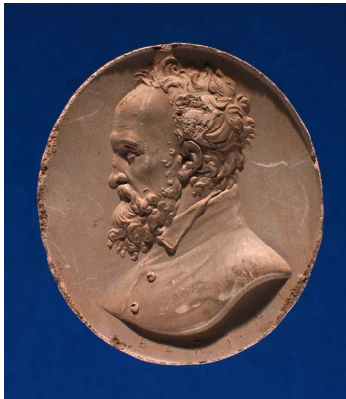
Fig. 11. Antonio Berini. Cammeo. Michelangelo. Calco. Trieste, Civici Musei di Storia ed Arte.