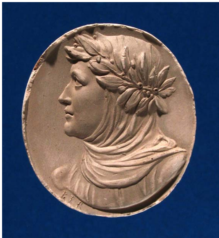
Fig. 9. Antonio Berini. Cammeo. Petrarca. Calco. Trieste, Civici Musei di Storia ed Arte.