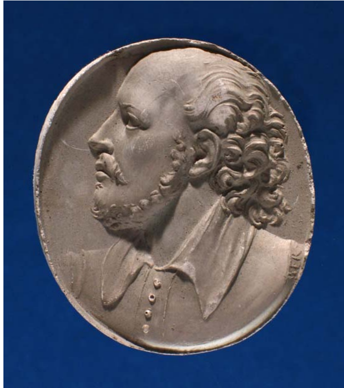
Fig. 12. Antonio Berini. Cammeo. Shakespeare. Calco. Trieste, Civici Musei di Storia ed Arte.