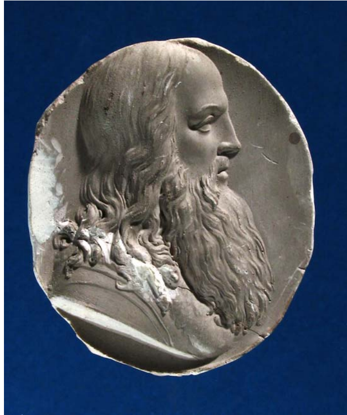
Fig. 10. Antonio Berini. Cammeo. Leonardo da Vinci. Calco. Trieste, Civici Musei di Storia ed Arte.