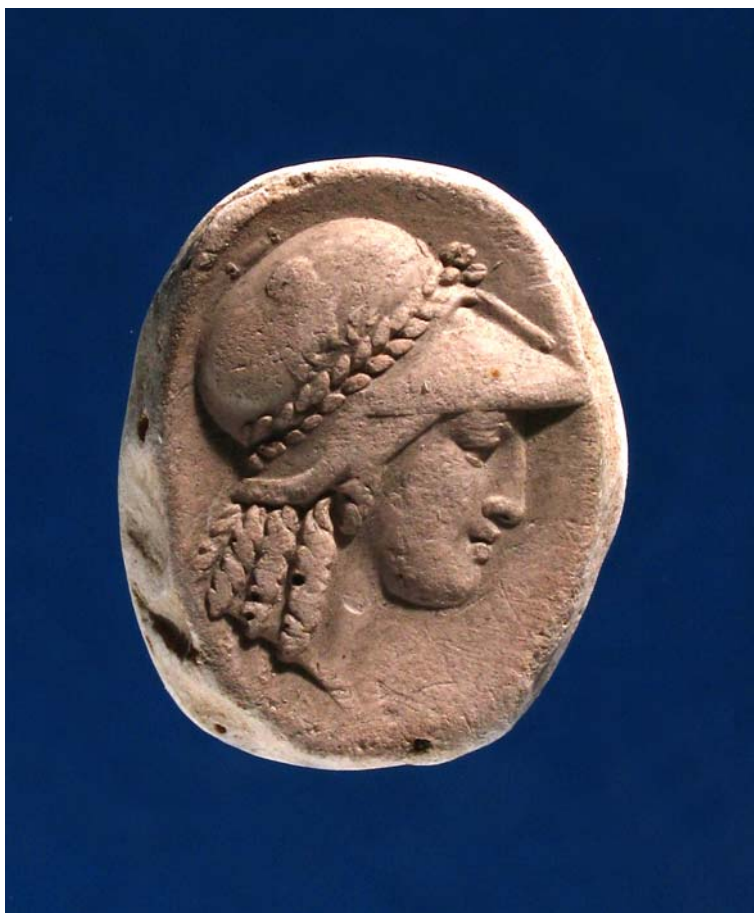
Fig. 2. Antonio Berini. Atena/Minerva. Calco. Trieste, Civici Musei di Storia ed Arte.

Anche nel calco n. 8062 (fig. 3) Minerva ha le chiome coperte da un elmo corinzio; sul petto, di cui si vede un'ampia porzione, il peplo e l'egida. Vicini sono un pezzo non antico 108 e due paste vitree settecentesche (che ritraggono lo stesso originale, peraltro non identificato) nelle collezioni dei Civici Musei d'Arte di Verona 109 .