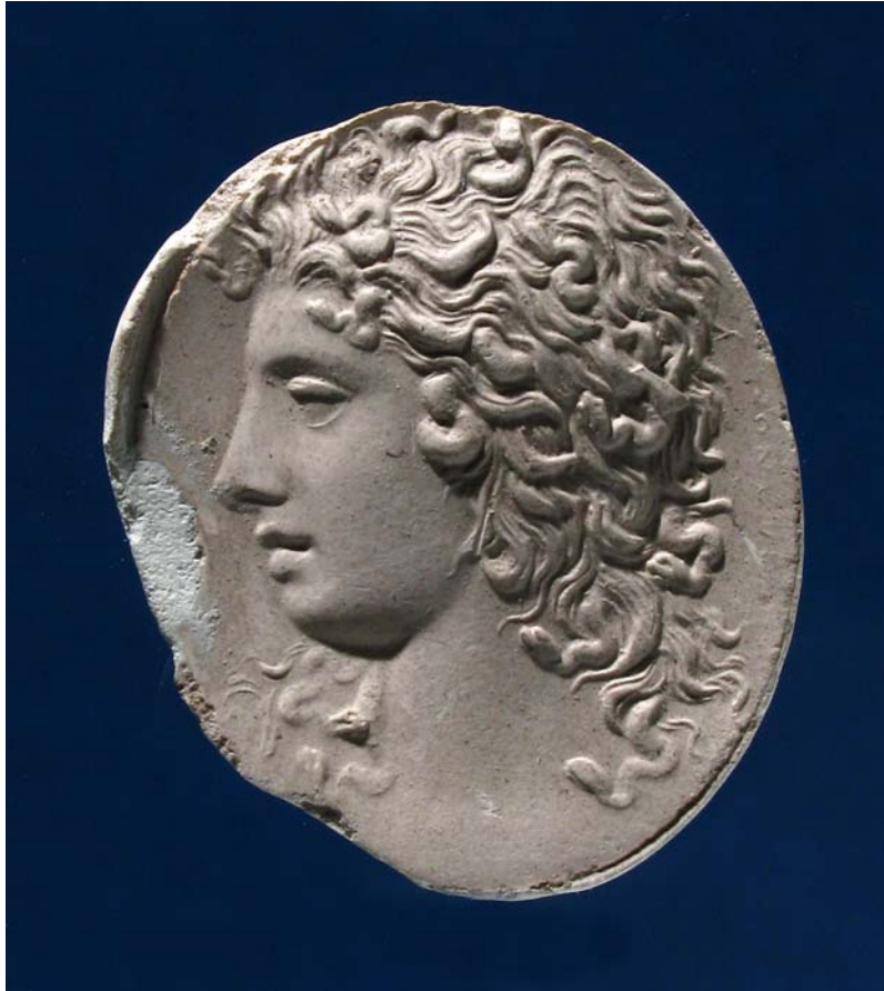
Fig. 1. Intaglio. Medusa Strozzi, con firma ΣΟΛΩΝΟC. Calco. Trieste, Civici Musei di Storia ed Arte.

Non sono chiare le notizie sulla provenienza dell'intaglio in calcedonio firmato da Solone 67 , che sarebbe stato rinvenuto a Roma agli inizi del XVIII secolo; comunque fu acquistato dall'antiquario Marco Antonio Sabatini e in seguito passò nella collezione Strozzi poi nella Blacas e infine, nel 1886, al British Museum 68 . L'intaglio è celeberrimo e vanta un'estesissima bibliografia 69 , dovuta anche alla serie di infinite e mai sopite discussioni concernenti l'autenticità della gemma e/o della firma 70 ; ora l'antichità dell'intaglio è generalmente accettata (in particolare è stato datato, sulla base di confronti stilistici, tra il 70 e il 50 a.C. 71 ), mentre la firma viene da alcuni ritenuta un'aggiunta settecentesca 72 . Diffusa attraverso