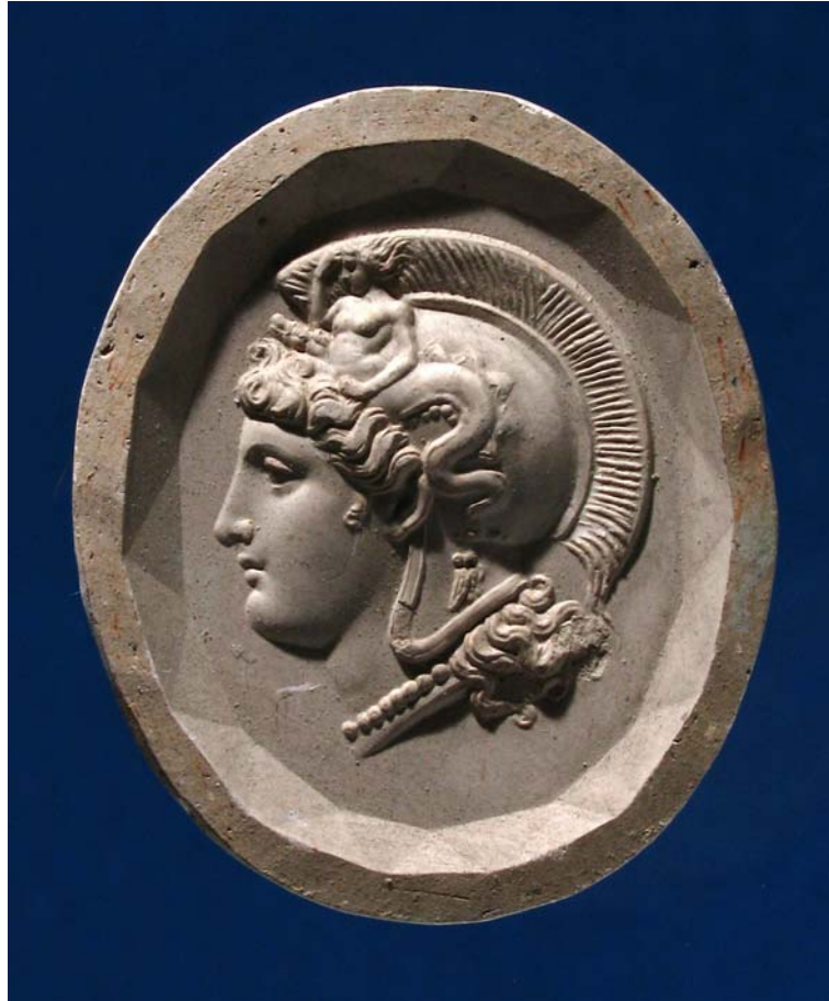
Fig. 4. Antonio Berini. Atena/Minerva. Calco. Trieste, Civici Musei di Storia ed Arte.

riprodotte, nelle diverse varianti, dagli incisori post-classici 119 . Ricordiamo una cera di Benedetto Pistrucchi 120 e tre pezzi, molto simili tra di loro, che si differenziano dall'opera del Berini solo per minimi particolari: un intaglio di Luigi Dies 121 e due intagli non firmati, non antichi, di cui uno attribuito al XVIII secolo 122 .