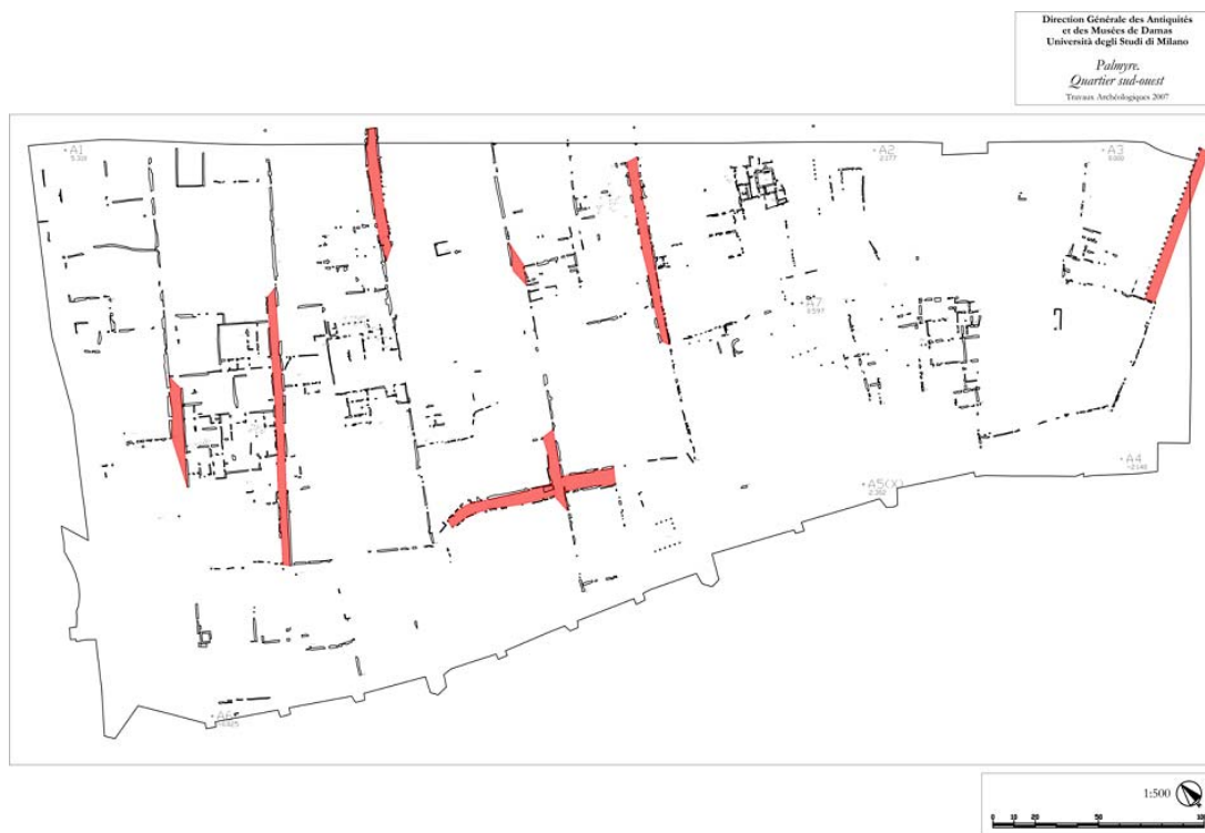
Fig. 2. Palmira, quartiere sud-occidentale: il nuovo rilievo effettuato dalla Missione italo-siriana nel 2007, con il colonnato UR 2 e le piccole strade in evidenza.

Delle 5 strade identificate sul terreno con orientamento NE/SO, le prime 3 (da est) hanno un'inclinazione di circa 90° (in gradi centesimali) rispetto all'allineamento della Grande Via Colonna; le ultime 2 di circa 95° (fig. 2). Tale mancanza di regolarità si riflette, evidentemente, anche sugli isolati compresi tra queste strade, che non presentano misure uniformi 8 , al contrario di quanto è stato accertato per il quartiere a nord della Grande Via Colonnata, con la sua fitta serie di lunghe vie parallele 9 .