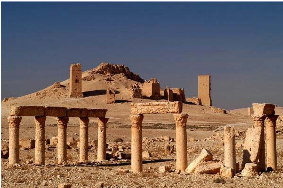
Fig. 6. Palmira, quartiere sud-occidentale: il peristilio UR 89.

La struttura più imponente dell'area, a quanto è possibile giudicare dalle evidenze sul terreno, è costituita da un peristilio di forma grosso modo quadrata (UR 89, qq. Jg, Jh), con 6 colonne su ogni lato (ne rimangono in situ 12, su tre lati, in gran parte interrati) (fig. 6) la cui estensione pare delimitata da due piccole strade con orientamento Nord/Sud. In corrispondenza del peristilio, che si trova nel settore meridionale del quartiere, le mura tardo-antiche della città presentano una singolare deviazione del percorso, forse resa necessaria proprio dalla presenza di questo importante edificio (una conferma in tal senso, attraverso lo scavo, costituirebbe anche un terminus ante quem per la costruzione dell'edificio stesso). (In corrispondenza del lato ovest di questo peristilio è stato avviato lo scavo nel novembre 2008, nel quadro della seconda campagna di ricerche della Missione italo-siriana nel quartiere).