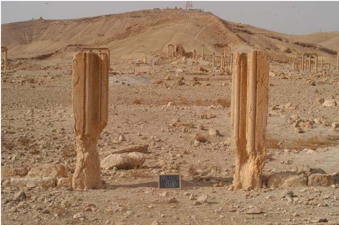
Fig. 5. Palmira, quartiere sud-occidentale: gli stipiti lungo l'allineamento UR 142.

Talora la presenza di soglie e di stipiti, ancora in situ , segnala i punti di accesso agli edifici e/o a qualche ambiente (fig. 5). Anche se naturalmente per il momento non è possibile definire la precisa planimetria e la destinazione d'uso di tali unità edilizie, emerge con chiarezza già fin d'ora, in alcuni settori del quartiere, la presenza di complessi ampi e strutturati.