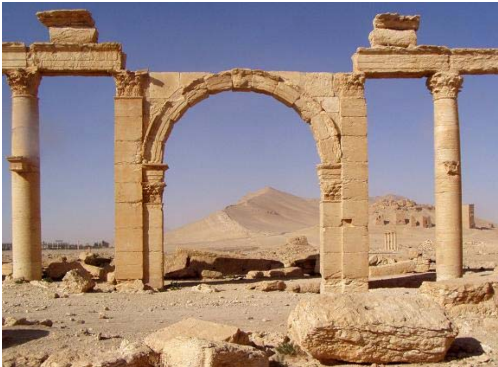
Fig. 3. L'arco della Grande Via Colonnata nel settore che corrisponde al limite nord-ovest del quartiere oggetto di indagine.

Il confine orientale del quartiere sud-ovest è definito da un'altra via colonnata, che ha origine dal Tetracylon e che è costituita, nel suo stato attuale, da 21 colonne integre (UR 2). Essa peraltro non risulta allineata né con le vie identificate all'interno del quartiere sud-ovest e nemmeno con il vicino muro occidentale dell'Agorà.