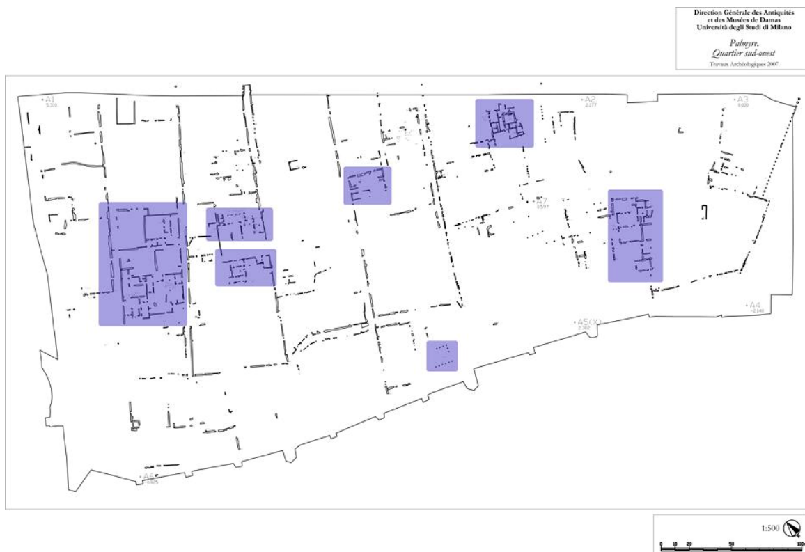
Fig. 4. Palmira, quartiere sud-occidentale: il nuovo rilievo effettuato dalla Missione italo-siriana nel 2007, con le unità edilizie in evidenza.

L'indagine sul campo ha consentito di identificare anche altre strutture, definite come unità edilizie (fig. 4): in esse si riescono a definire alcuni ambienti, alternati a spazi aperti, delimitati da allineamenti in blocchi lapidei in gran parte analoghi a quelli che delimitano le strade, ma di dimensioni inferiori.