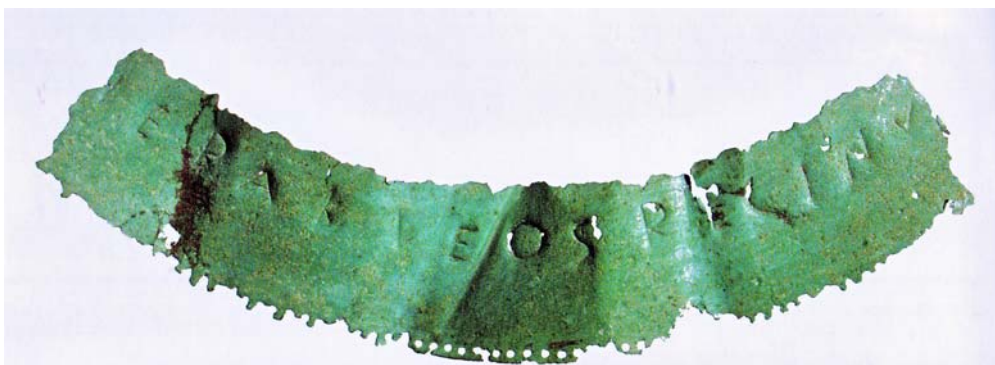
Fig. 2. Lamina in bronzo con dedica ad Eracle Reggino (da SPADEA 1987).