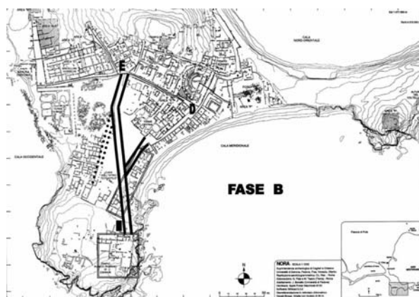
Fig. 9. Nora. Viabilità principale nel V secolo d.C.

A Nora proprio questo periodo risulta oggi splendidamente testimoniato, 7 con la possibilità, anche in questo caso, di avere una ricostruzione grafica di intere abitazioni e del loro complessivo aspetto, come si vedrà negli interventi che seguiranno. E non è ancora finita, perché tra la fine dello stesso V secolo ed il secolo successivo anche questo abitato si impoverisce, le abitazioni si riducono ad un unico ambiente, e i cortili vengono uniti tra di loro a formare un sistema di campielli e di tortuosi vicoletti, che tanto ricordano le nostre città portuali del pieno Medio Evo.