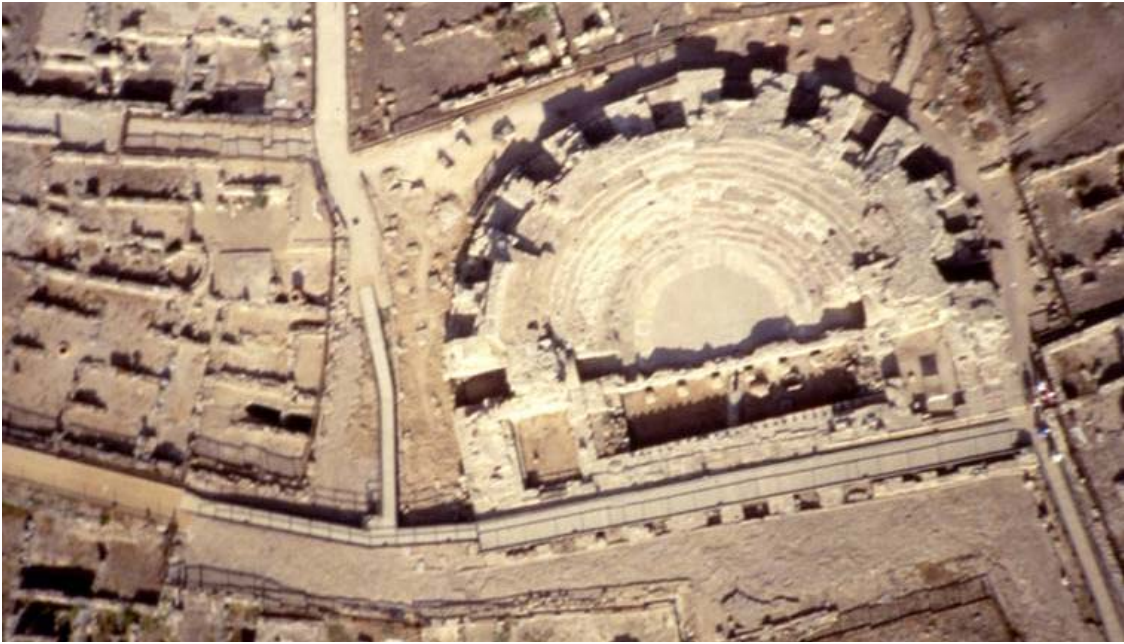
Fig. 3. Nora, teatro. Foto aerea.

L'intervento di scavo nel settore centrale, da me iniziato nel 1995 con l'Università di Pisa, dove allora insegnavo, e poi proseguito con l'Università di Venezia e, dal 2002, con quella di Milano, ha chiarito meglio la qualità e la portata delle trasformazioni subite da Nora tra il II secolo a. C. e il VII d.C., tanto che è stato possibile ricostruire i diversi aspetti che lo stesso quartiere assunse in ciascun periodo della sua lunga storia. (Figg. 4-7).