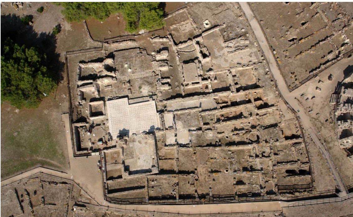
Fig. 4. Nora, isolato delle terme centrali. I. Foto aerea.

L'intervento di scavo nel settore centrale, da me iniziato nel 1995 con l'Università di Pisa, dove allora insegnavo, e poi proseguito con l'Università di Venezia e, dal 2002, con quella di Milano, ha chiarito meglio la qualità e la portata delle trasformazioni subite da Nora tra il II secolo a. C. e il VII d.C., tanto che è stato possibile ricostruire i diversi aspetti che lo stesso quartiere assunse in ciascun periodo della sua lunga storia. (Figg. 4-7).