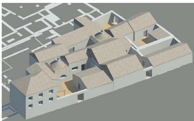
Fig. 6. Nora, isolato delle terme centrali. III. Le case del 420-450 d.C. (ric. Belgiovine - Capuzzo).