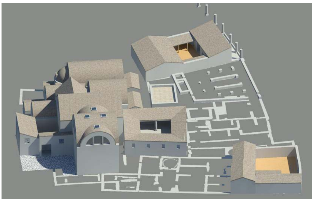
Fig. 5. Nora, isolato delle terme centrali. II. Terme e case di II-III secolo d.C. (ric. Belgiovine - Capuzzo).