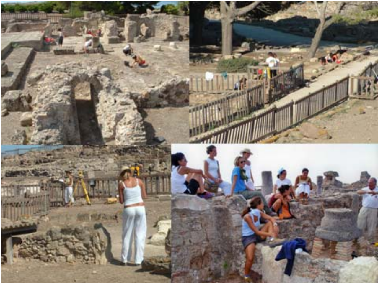
Fig. 10. Nora. Fasi dello scavo dell'Università di Milano.

riferimenti ai simili risultati che, contemporaneamente, le università con cui abbiamo sempre strettamente collaborato, di Genova Padova e Viterbo, hanno ottenuto nelle aree da loro indagate: rispettivamente l'area a Nord della nostra; quella del foro e delle zone circostanti; e quelle occupate almeno sin dal VII secolo a.C. dal primitivo insediamento, prima fenicio, e poi punico, su tre leggere elevazioni attorno al nucleo centrale dell'abitato. (Fig. 10).