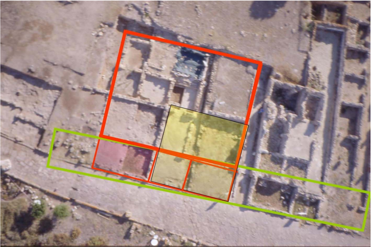
Fig. 2. Nora, area AB. Foto aerea.

Tra il '93 ed il '95 trasformazioni ancora più profonde poterono essere colte nell'area del teatro.