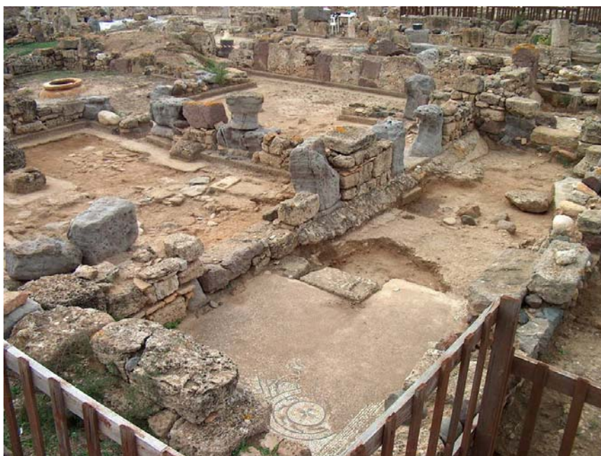
Fig. 1. Nora, area E. Murature di V secolo sovrapposte a mosaici di II-III secolod.C.

La pluristratificazione è veramente una caratteristica di Nora, una splendida opportunità di comprensione scientifica e di sperimentazione metodologica (Fig. 1).