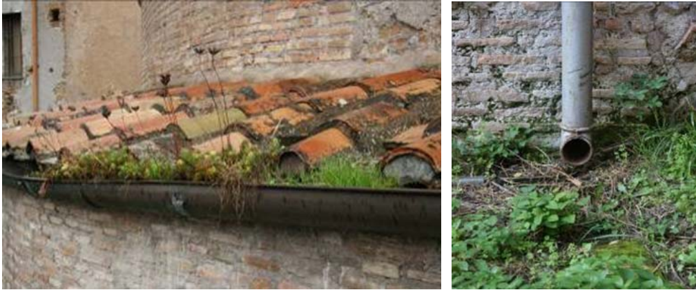
Figg. 6-7. Roma, Foro Romano, Tempio di Romolo. Inefficienza dei sistemi di allontanamento delle acque per intasamento dei canali di gronda e dispersione di acque al suolo non controllate.

Ciò dimostra ancora una volta che la conservazione dei beni culturali, anche dei beni archeologici, richiede attenzioni e "cure" per le quali, spesso, non necessariamente si deve fare ricorso a raffinate competenze di carattere archeologico, ma più semplicemente al buonsenso e alle conoscenze tecniche derivanti dalle regole dell'arte e dalle buone pratiche del costruire, ampiamente note e sperimentate. Senza sottovalutare, dunque, l'importanza delle competenze specialistiche, come condizione essenziale per consentire il riconoscimento di valore, e da qui derivare le opportune cautele nell'operare, si deve però considerare che le condizioni di degrado, il più delle volte causate da carenti o errate manutenzioni, non sono in genere dovute a limiti nelle conoscenze scientifiche o tecniche, ma a difetti e omissioni di tipo operativo, previsionale, organizzativo e pianificatorio.