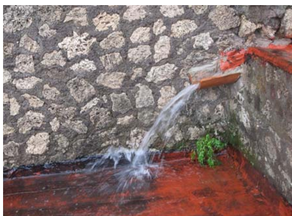
Fig. 4. Pompei, Casa della Fontana Piccola. Inefficienze nei sistemi di allontanamento delle acque piovane.