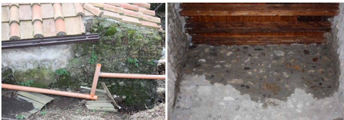
Figg. 2-3. Pompei, Casa di Trebio Valente. Infiltrazioni di acqua da coperture recenti con carenti impermeabilizzazioni e inefficienze nei sistemi di allontanamento delle acque piovane.

Si veda per esempio il caso di Pompei. Le attività ispettive eseguite a campione su alcune domus (casa della Fontana Piccola, Casa di Trebio Valente, Casa del Moralista, via Stabiana) richieste dal Segretariato Generale MiBAC a seguito del crollo della Schola armaturarum nell'autunno 2010 24 , hanno messo bene in evidenza errori di carattere tecnologico e costruttivo, a volte del tutto banali, e quindi facilmente evitabili, compiuti sulle strutture più recenti (murature di completamento, solai, coperture e strati di impermeabilizzazione, sistemi di convogliamento e regimazione delle acque piovane). Di conseguenza i danni derivanti, p. es., dalle copiose infiltrazioni di acqua (Figg. 2-7), hanno coinvolto anche le murature archeologiche con inumidimenti, efflorescenze, patine biologiche, ecc., che hanno causato degradi su murature antiche, intonaci, dipinti.