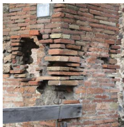
Fig. 5. Pompei. Carenti manutenzioni mettono in pericolo la stabilità delle murature.