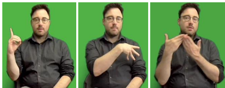
Figura 3. LIS: SOV/ OSV

LIS: Davide (conf. D) Maria (conf. M) aiutare (SOV) Maria Davide aiutare. (OSV) IT: Davide aiuta Maria (SVO)