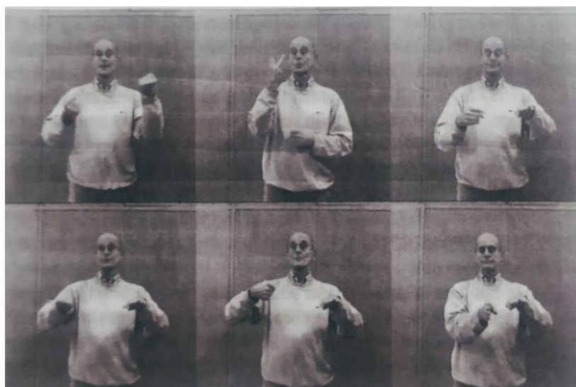
Figura 2. LIS: « Ci sono due auto, la moto in mezzo » / « La moto sta tra le due auto »

Come possiamo vedere in Figura 1, il grado dell'aggettivo viene sempre articolato con le CNM. Mentre in alcune lingue il grado superlativo si crea per suffissazione ( Magrissimo , in italiano; Delgadísimo , in spagnolo) o aggiungendo degli avverbi di quantità ( Molto magro , in italiano; Muy delgado , in spagnolo), in LIS è obbligatorio aggiungere alle componenti manuali, l'impersonamento per intensificare una certa caratteristica fisica: più è intenso il grado dell'aggettivo, più si contraggono le guance e si protrae la lingua. Alla base della forme linguistiche segniche c'è infine, lo spazio neutro che rende la LIS «una lingua tridimensionale» (Mantovan, 2021) in quanto, utilizzando una dimensione spaziale metaforica, non esistente nelle lingue vocali, il segnante riesce a dare vita a immagini e concetti visivi spesso complicati da tradurre in parole (Russo Cardona, Volterra, 2007). Se nelle lingue vocali un parlante riesce a restituire un contesto fatto di suoni ai suoi interlocutori, il segnante è costretto a raffigurare ciò che sta segnando, immaginandosi di posizionare i classificatori su uno spazio ideale come le pedine su un tavolo da gioco (cfr. Figura 2):