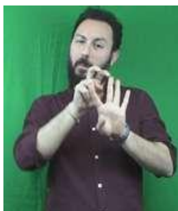
Figura 5. LIS: «Il bambino scavalca con difficoltà la recinzione»

«L’esempio mostra una complessa costruzione simultanea in cui la mano dominante (mano destra) e la mano non dominante (mano sinistra) si riferiscono a due entità diverse rispettivamente un bambino, conf. v̇ (indice e medio ripiegati e contratti) e una recinzione, conf. 4 (le quattro dita della mano stese e divise) e i marcatori non manuali trasmettono informazioni sul modo in cui sta avvenendo l’azione di scavalcare la recinzione, cioè «con difficoltà». Il movimento applicato alla mano dominante mostra come il bambino si muove per scavalcare la recinzione» (Branchini, Mantovan, 2020: 237) 20 .