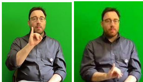
Figura 1. LIS: Magro (agg.)

Come possiamo vedere in Figura 1, il grado dell'aggettivo viene sempre articolato con le CNM. Mentre in alcune lingue il grado superlativo si crea per suffissazione ( Magrissimo , in italiano; Delgadísimo , in spagnolo) o aggiungendo degli avverbi di quantità ( Molto magro , in italiano; Muy delgado , in spagnolo), in LIS è obbligatorio aggiungere alle componenti manuali, l'impersonamento per intensificare una certa caratteristica fisica: più è intenso il grado dell'aggettivo, più si contraggono le guance e si protrae la lingua. Alla base della forme linguistiche segniche c'è infine, lo spazio neutro che rende la LIS «una lingua tridimensionale» (Mantovan, 2021) in quanto, utilizzando una dimensione spaziale metaforica, non esistente nelle lingue vocali, il segnante riesce a dare vita a immagini e concetti visivi spesso complicati da tradurre in parole (Russo Cardona, Volterra, 2007). Se nelle lingue vocali un parlante riesce a restituire un contesto fatto di suoni ai suoi interlocutori, il segnante è costretto a raffigurare ciò che sta segnando, immaginandosi di posizionare i classificatori su uno spazio ideale come le pedine su un tavolo da gioco (cfr. Figura 2):