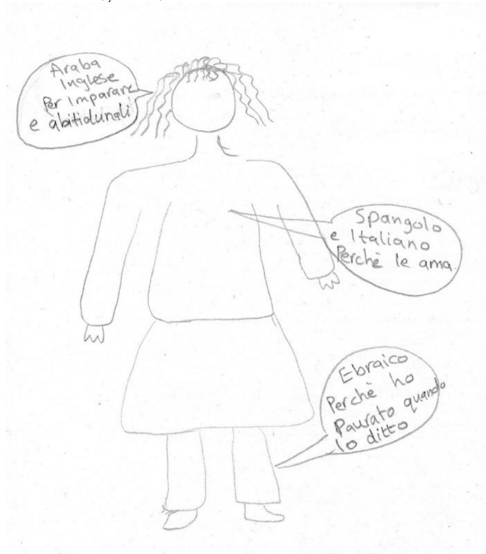
Figura 1. Silhouette di H., palestinese, A2

Anche in situazioni meno drammatiche, le immagini permettono agli studenti con competenza linguistica intermedia di utilizzare un linguaggio più espressivo del solito, come nel caso di M., tedesca, B1 (Figura 2), che affianca al suo disegno delle didascalie nelle quali ricorre a metafore e similitudini che altrove non usa. L'italiano per lei è la lingua che «si sente in bocca e nelle mani». 14