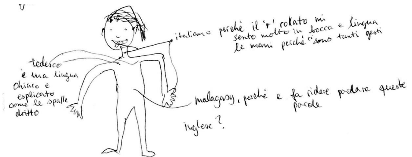
Figura 2. Silhouette di M., tedesca, B1

C., svizzero-tedesca (Figura 3), ha nel cuore tre lingue romanze (tra cui l'italiano), e paragona invece la sua conoscenza un po' vaga del polacco alla confusione dei suoi capelli ricci.