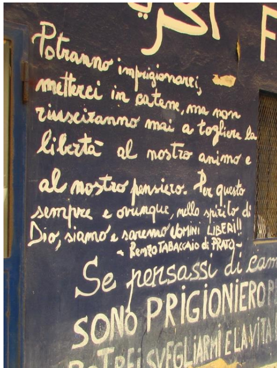
Figura 3 Rappresentazione IST.6