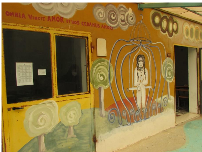
Figura 8 Rappresentazione IST.6

Proseguendo si trova un'altra rappresentazione anche questa collegata al sentimento dell'amore ma in questo caso quello per il valore religioso. Osserviamo infatti la scritta « che cos'è... l'amore – ho fatto te » associata alla predominante figura di Cristo con in mano un cuore, con all'interno un uomo e una donna che si tengono per mano e come sfondo un elefante, sulla sinistra di questo un altro cuore che incornicia la figura di un elefante con quella di un ragazzo e sulla destra un altro cuore integralmente coperto dall'immagine di una ragazza. Questo murale sembra quasi essere un trittico che racconta la storia di un ragazzo e delle sue origini, dell'incontro con una ragazza etnicamente distante da lui e