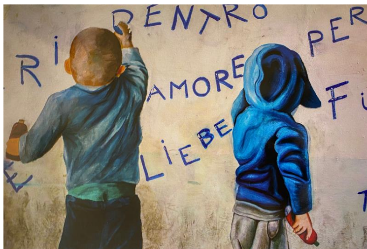
Figura 6. Rappresentazione IST.3

È molto difficile che una rappresentazione artistica sia fine a sé stessa: quasi sempre, all'interno di un'opera è possibile trovare dei messaggi, degli ideali o delle idee, siano esse nascoste o ben chiare agli occhi di chi le osserva. Un messaggio può essere di protesta contro la guerra, la politica, fonte per determinati destinatari, può simboleggiare la pace o semplicemente la felicità e l'allegria; ognuno ha il suo scopo. Nella rappresentazione delle Figura 6 l'autore mette in contrapposizione lingua e immagine con la riproduzione di due figure di writers che stanno realizzando delle scritte mistilingue sulla parete.