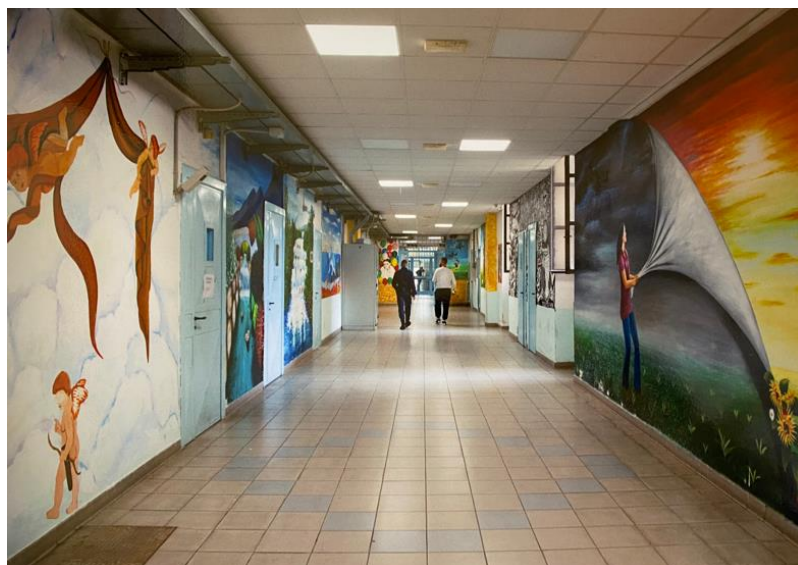
Figura 11. Rappresentazioni IST. 3

Nella Figura 11 si osserva una sequenza di murales che percorrono tutta la navata di un corridoio ai quali si attribuiscono differenti significati: è il caso dalla ragazza sulla destra, che con un gesto è come se stesse cambiando paesaggio per portare coloro che lo stanno guardando da un panorama malinconico ad uno meraviglioso con un tramonto, forse per esortare ad un momento di cambiamento nella vita di coloro che si trovano a dover passare i loro anni in un ambiente angusto. Sulla sinistra invece, si nota un quadro di carattere più religioso con degli angeli che gravitano in uno scenario fatto di nuvole, che indubbiamente rimanda al paradiso, ma anche alla ricorrenza di segni con valore religioso. In entrambi i casi si tratta di un invito a sollevare un “velo”, a voltare pagina, e a guardare oltre al presente, a quello che c’è di più bello dopo una brutta esperienza.