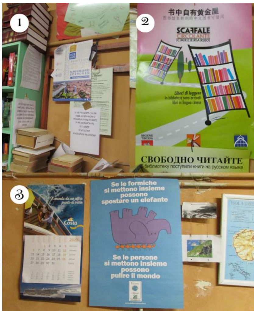
Figura 7. Biblioteca IST.6

Immagini interessanti sono inoltre quelle dei casi inseriti all'interno dell'IST.6, in cui una buona percentuale di occorrenze è stata osservata negli spazi di socialità: nella biblioteca, nelle aule didattiche e nei corridoi. La biblioteca per esempio, è uno spazio ristretto, utilizzato non solo per la consultazione di libri ma anche come appoggio per studenti e docenti per la realizzazione di attività formative. In essa è possibile trovare tanto volantini e poster pubblicitari in più lingue quanto documenti regolativi o informativi, oltre ad una cartina geografica del territorio nel quale si colloca la struttura (Figura 7).