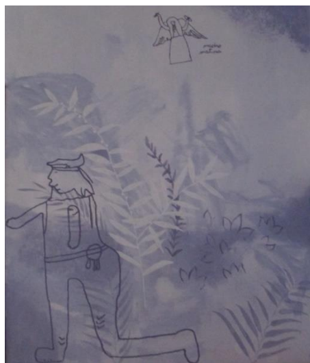
Figura 10. Rappresentazioni IST.7

Procedendo, sono state rilevate delle immagini raffiguranti graffiti effettuati nelle pareti della stanza colloqui, unico spazio dell'intero Istituto (IST.7) che raccoglie segni di questo tipo. Nelle rappresentazioni si notano tre elementi costanti: la natura, il desiderio di nascondersi o di fuggire e il valore religioso. La natura è rappresentata come una madre – dal testo si legge «madre natura» – con delle ali come se fosse una figura angelica, anche se posta in un luogo apparentemente selvaggio, inserita in uno spazio che accoglie e che protegge. Si evince inoltre il tentativo di voler nascondersi da qualcosa o da qualcuno (si nota la figura stilizzata di un poliziotto), se non da una condizione. Questo ultimo elemento potrebbe essere associato al numero che compare, 79: un numero di matricola? un ruolo? un luogo che si rifiuta? È importante notare inoltre la figura dalle sembianze mediorientali che in qualche modo crea un legame fra la cultura araba con le altre forme occidentali rappresentate.