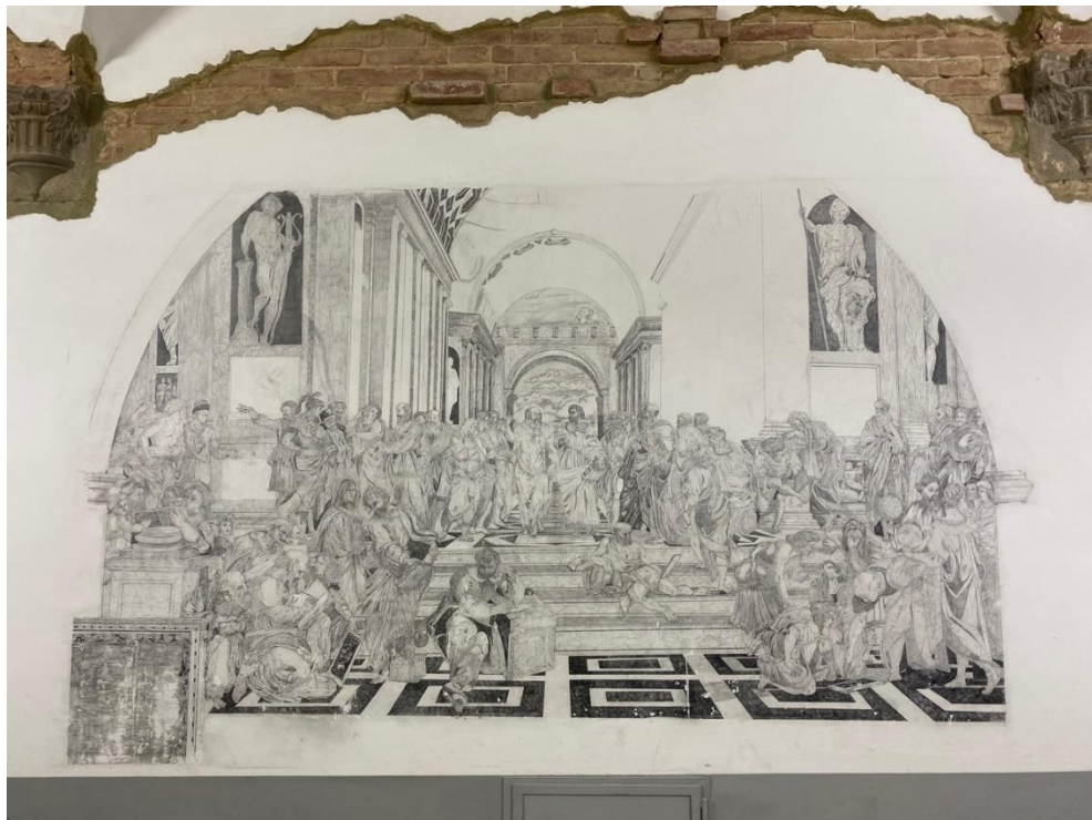
Figura 13. Rappresentazione IST.5

Le altre immagini acquisite riportano tutti elementi pittorici, alcuni collocati all'interno degli ambienti dedicati alla didattica e altri in spazi di condivisione, come nel caso della figura collocata in una sezione di fronte alle camere di pernottamento dell'IST5. Quest'ultima, come confermato dal personale presente al momento della visita, è stata interamente prodotta da un'artista detenuto che ha deciso di intervenire con la tecnica del tratteggio attraverso l'uso di una penna ad inchiostro. Il lavoro rappresenta la riproduzione fedele di un'opera di Raffaello, La Scuola di Atene (conservata ai musei Vaticani e datata 1509-1511), che il detenuto ha inserito all'interno di una parte della parete usurata che sembra fargli da cornice.