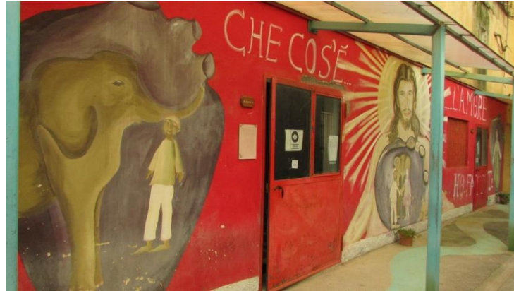
Figura 9. Rappresentazione IST.6

Procedendo, sono state rilevate delle immagini raffiguranti graffiti effettuati nelle pareti della stanza colloqui, unico spazio dell'intero Istituto (IST.7) che raccoglie segni di questo tipo. Nelle rappresentazioni si notano tre elementi costanti: la natura, il desiderio di nascondersi o di fuggire e il valore religioso. La natura è rappresentata come una madre – dal testo si legge «madre natura» – con delle ali come se fosse una figura angelica, anche se posta in un luogo apparentemente selvaggio, inserita in uno spazio che accoglie e che protegge. Si evince inoltre il tentativo di voler nascondersi da qualcosa o da qualcuno (si nota la figura stilizzata di un poliziotto), se non da una condizione. Questo ultimo elemento potrebbe essere associato al numero che compare, 79: un numero di matricola? un ruolo? un luogo che si rifiuta? È importante notare inoltre la figura dalle sembianze mediorientali che in qualche modo crea un legame fra la cultura araba con le altre forme occidentali rappresentate.