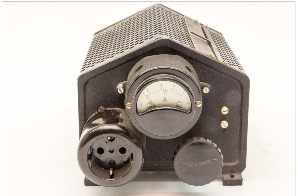
Fig 1 – Resistenza per proiettore, seconda metà del XX secolo (inv. IGB-16635), donazione M. Pedone, Museo Nazionale Scienza e Tecnologia Leonardo da Vinci, Milano (© Museo Nazionale Scienza e Tecnologia Leonardo da Vinci, Milano).

Possiamo dunque leggere la cultura materiale come un “filtro” che i musei applicano alla realtà, permettendoci di isolare e osservare alcuni dei suoi «lumps» (lacerti) sotto questa prospettiva 37 . Per l’etnografo Alberto Cirese, figura di spicco nel movimento di studio della cultura contadina e popolare italiana degli anni Settanta, la musealizzazione costituiva un atto conoscitivo fondamentale, diverso dall’esplorazione dell’oggetto nel suo contesto abituale. Secondo questi approcci, i musei – inclusi quelli derivati da una visione positivista della conoscenza e della storia, come quelli tecnoscientifici – non servono dunque a presentare fedelmente i fenomeni del mondo tramite le loro collezioni, ma, al contrario, a introdurre una fondamentale «discontinuità» nella realtà, isolando e risignificando gli oggetti raccolti, che nel museo divengono «documenti di sé stessi»: è questa operazione a permettere di metterci in distanza per osservare meglio, riflettere e conoscere altri mondi – o anche il nostro mondo – con altri occhi 38 .