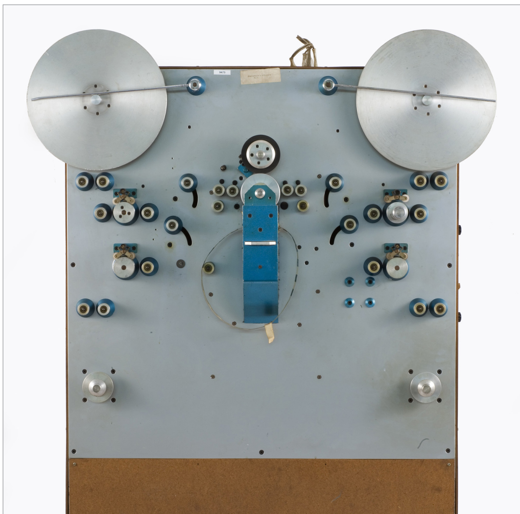
Fig 4 – Stampatrice per la duplicazione di pellicole 8mm del laboratorio Saga-Film di Milano, anni Ottanta del XX secolo (inv. IGB-9473), donazione C. Saska, Museo Nazionale Scienza e Tecnologia Leonardo da Vinci, Milano.

oggetti tecnici dotati di date istanze culturali, storicamente situati in un «grande sistema tecnologico» 56 .