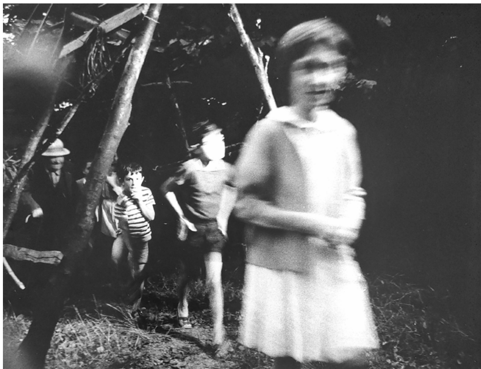
Fig. 6. Il pubblico durante la serata di Azione Proiezione Intervento Utopia , Monte Lonzina, 14 luglio 1973

cava del Monte Lonzina e la distribuzione di mele ecologiche. Tra le fotografie che rendono conto di questo incontro ve ne sono diverse in cui i partecipanti, tra i quali bambini e anziani, attraversano il piano di cava, superando costruzioni di legno rudimentali in una sorta di percorso esplorativo (fig. 6). Anche la distribuzione delle mele rappresenta un momento di condivisione per il pubblico che, seduto su teli stesi a terra per assistere alle proiezioni, diventa protagonista di un happening collettivo. Mangiare quelle mele assume così una valenza sinestetica, un gesto che si carica di significato di fronte alle immagini proiettate sul grande lenzuolo appeso alle pareti della cava. Le diapositive dei rilevamenti