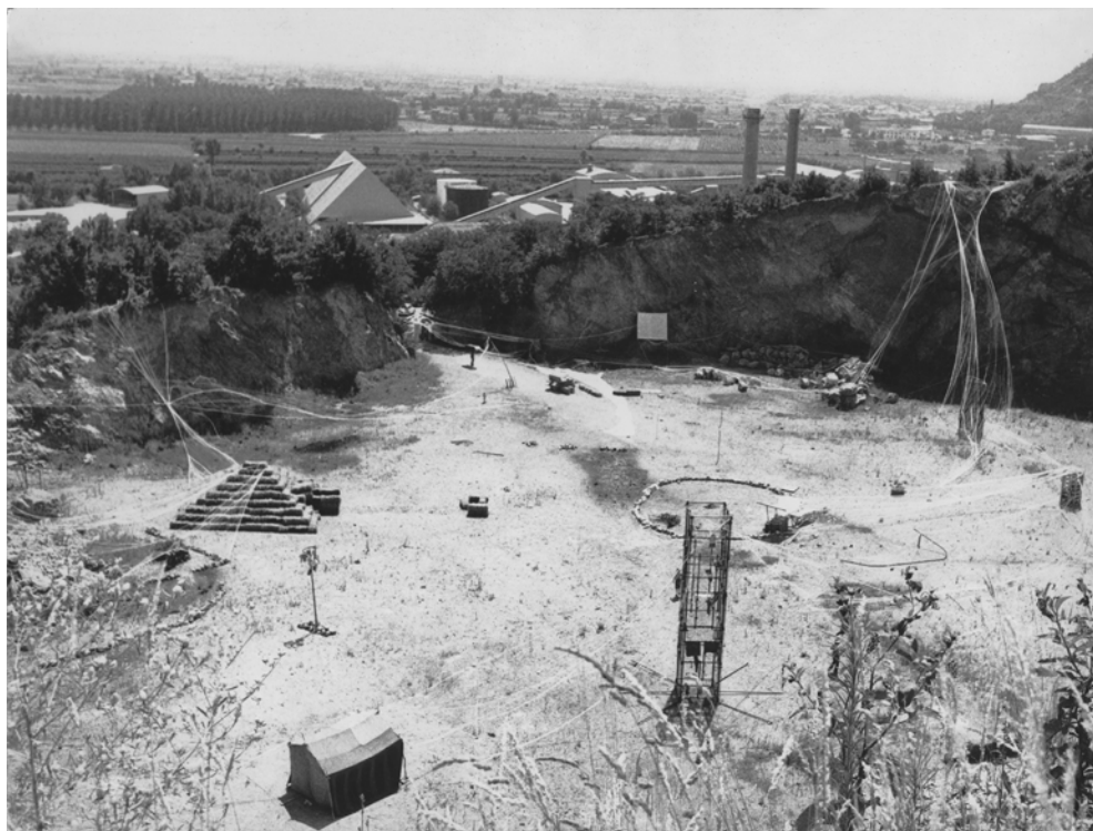
Fig. 15. Seminario per la progettazione di Architetture Culturalmente Impossibili organizzato da Cavart, Monselice (Padova), luglio 1975, Archivio Michele De Lucchi, Milano. Courtesy Archivio Michele De Lucchi

voracemente, senza alcun riguardo per l'ecosistema di quell'area, intendeva ricavarne il maggior profitto. Cavart ha saputo intessere un discorso rivoluzionario sul paesaggio, prefigurando una realtà utopica in cui le arti visive sono state precorritrici di nuovi orizzonti resilienti. Lo scenario dei Colli Euganei, martoriato per decenni dall'uomo, assume negli scatti e nei film di Cavart un'aura surreale, diventando sfondo di azioni performative e architetture radicali che danno prova di come l'uomo possa entrare in armonia con la natura, senza dover necessariamente interferire con l'ambiente (fig. 15). L'approccio multidisciplinare con cui il collettivo ha portato avanti i