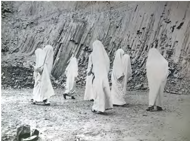
Fig. 4. Attori del Teatro Popolare di Ricerca durante le prove generali di Azione Proiezione Intervento Utopia , Monte Lonzina, luglio 1973, Archivio privato di Piero Brombin e Piera Paola Bortolami, Luvigliano (Padova). Courtesy Piero Brombin e Piera Paola Bortolami