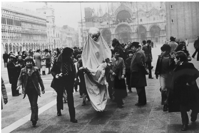
Fig. 5. Attore del Teatro Popolare di Ricerca, Venezia, Piazza San Marco, Archivio privato di Piero Brombin e Piera Paola Bortolami, Luvigliano (Padova). Courtesy Piero Brombin e Piera Paola Bortolami