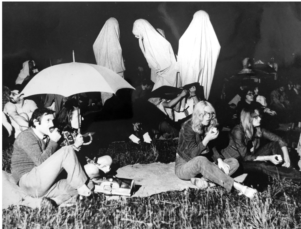
Fig. 7. Il pubblico durante la serata di Azione Proiezione Intervento Utopia, Monte Lonzina, 14 luglio 1973

gere la cittadinanza per “individuare la più opportuna destinazione urbanistica dei piazzali di cava esistenti sui versanti del Monte Ricco e, in senso più esteso, del Colle stesso” 25 . Cavart decide di parteciparvi inviando il materiale documentativo dell’evento, senza tuttavia ricevere riscontro positivo dalla commissione giudicatrice che, come si legge in un articolo pubblicato due anni dopo su “Il Gazzettino” di Padova, aveva stabilito di chiudere la gara senza alcun vincitore 26 .