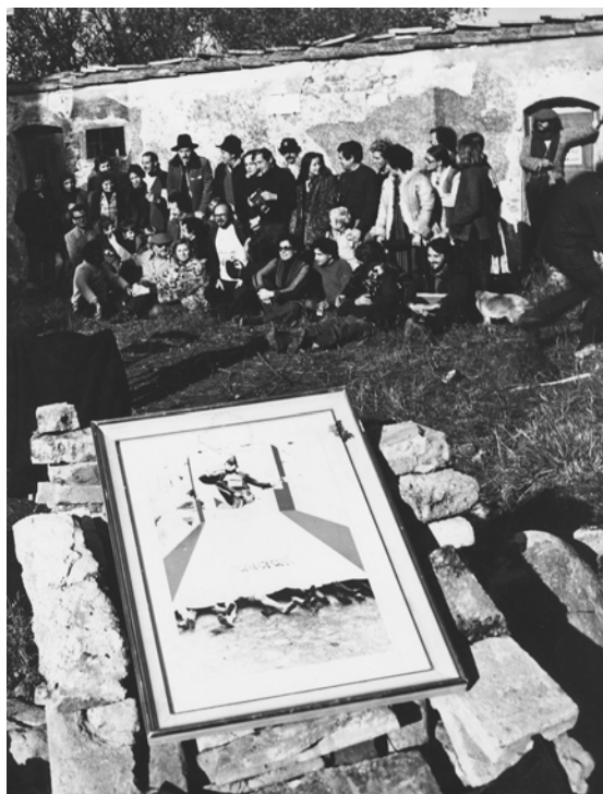
Fig. 10. Seminario Global Tools, Sambuca Val di Pesa (FI), novembre 1974, fotografia di Piero Brombin, Archivio Michele De Lucchi, Milano. Courtesy Archivio Michele De Lucchi