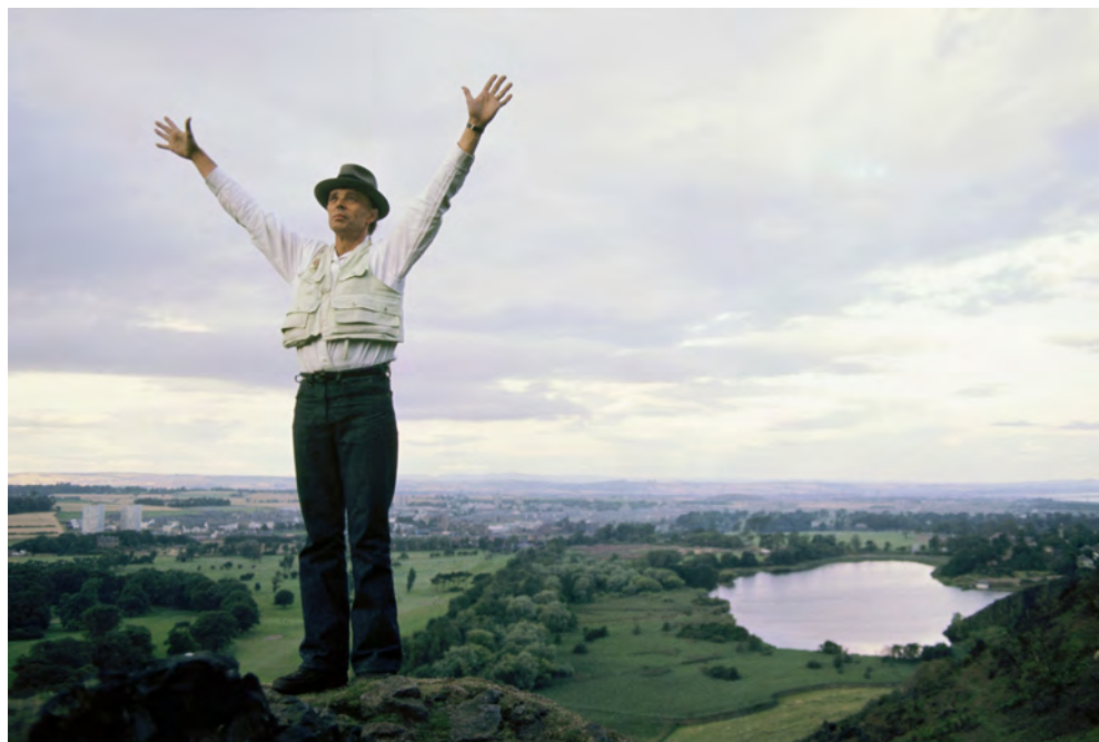
Fig. 12. Beuys in Scozia nel 1974

un quartiere ad alta densità edilizia e infrastrutturale 74 e “un’istituzione permanente di ricerca e di esperienza ecoartistica con il pubblico, con gli artisti e con un ampio range di interlocutori culturali e sociali” 75 . Con l’apertura del PAV, Gilardi risitua gli obiettivi di una ricerca estetica impegnata, condivisa e orizzontale, nel perimetro degli interessi pubblici, e proponendosi di sperimentare “una nuova forma di istituzione artistica nel contesto della crisi delle istituzioni artistiche tradizionali, quali il museo e la galleria d’arte contemporanea” 76 sembra rispondere direttamente all’auspicio di quella funzione sociale dell’arte di cui Beuys è stato instancabile promotore. La filosofia e progettuale di questo “museo interattivo nella natura” si fondano sulla partecipazione e su un agire relazionale declinato su un doppio binario di senso, artistico ed ecologico, che promuove una attitudine non contemplativa,