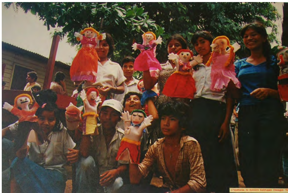
Fig. 6. Animazione teatrale in un quartiere popolare della città di Managua, Nicaragua, 1981

catrici lasciate dall'intreccio di sfruttamento delle risorse, ingiustizie sociali e cambiamento climatico.