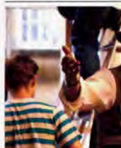
Fig. 11. Beuys a Londra e Gilardi in Africa , in "Domus", n. 667, dicembre 1985, p. 187

BEUYS A LONDRA. «Non voglio essere pessimista ma per me questo è un momento cruciale. La gente si interessa sempre meno a noi e che succede nel mondo. Si rassegna al potere del sistema. Proprio ora che il capitalismo e il comunismo si sono riuniti incapaci di far trovare all'uomo la propria identità. La gente vuole il facile, l'effimero, una vita da cui la parola "pensare" è bandita. Il peggio è che i giovani diventano sempre più conservatori. Il Nord, per esempio, fa da paraggiato con entusiasmo e non diventa un partito politico come gli altri... E allora si abbandonano alla disperazione negativa, al cinismo, droga, suicidio, e non si accorgono di alzarsi dai veri valori della vita. Non sanno più che cosa è la socialità... «Bisogna che il pubblico si riappropri del rapporto con l'arte, da passivo al attivo. Questa è la chiave per capire il mio lavoro. Anche l'uomo della strada ha, insomma, un gesto creativo, che nell'ave assommo un ruolo. Riorganizzare, costantemente questa potenzialità dell'individuo, resistendo all'azione identitaria e liberata. Se la gente comincia a capire... «La mia influenza sull'arte in Germania? Io sono stato, insieme artistico, non so rispondere. Nella società in generale, credo aver indicato un certo modo di cambiare le