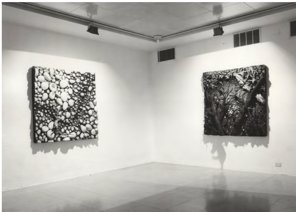
Fig. 8. Piero Gilardi, Tappeti-natura , allestimento della mostra personale Stop Pollution! allo Studio Marconi, Milano, 23 febbraio-20 marzo 1989, foto Giorgio Colombo

governative di cereali sono state vendute sottocosto per ingrassare i maiali inglesi. La cosiddetta civilizzazione [è arrivata] a lambire anche Barsaloi, ma creando dipendenza economica e squilibri sociali” 58 .