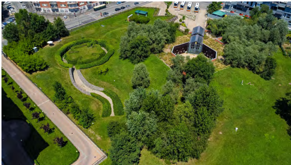
Fig. 13. Veduta panoramica del Parco Arte Vivente a Torino, Fondazione Centro Studi Piero Gilardi, Torino