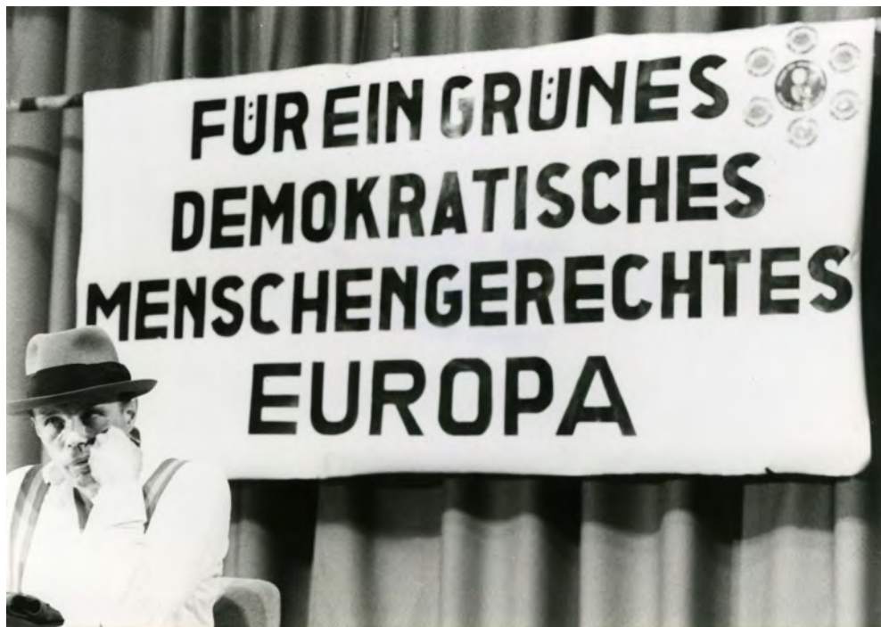
Fig. 10. Joseph Beuys durante un evento della campagna elettorale per il Partito dei Verdi, Colonia-Mühlheim, 20 maggio 1979

riafferma energicamente il messaggio di una creatività diffusa e universale, lo fa in un momento chiave della sua elaborazione del nesso tra natura e cultura: “il bisogno fondamentale che muove l’uomo contemporaneo”, scrive Gilardi nel 1984, “credo sia quello di dare più spazio alla natura nei confronti della cultura”, di trovare cioè “un rapporto dialettico più aperto tra le esigenze naturali, quindi anche quelle interne connesse con i nostri istinti, e il modo di pensare, di produrre, insomma di stare insieme” 70 . Tra queste esigenze naturali , quella di un’espressività libera, spontanea, non professionistica e dispiegata nella reciprocità della relazione, è quella maggiormente carica di una tensione trasformativa incanalabile in una nuova progettualità culturale.