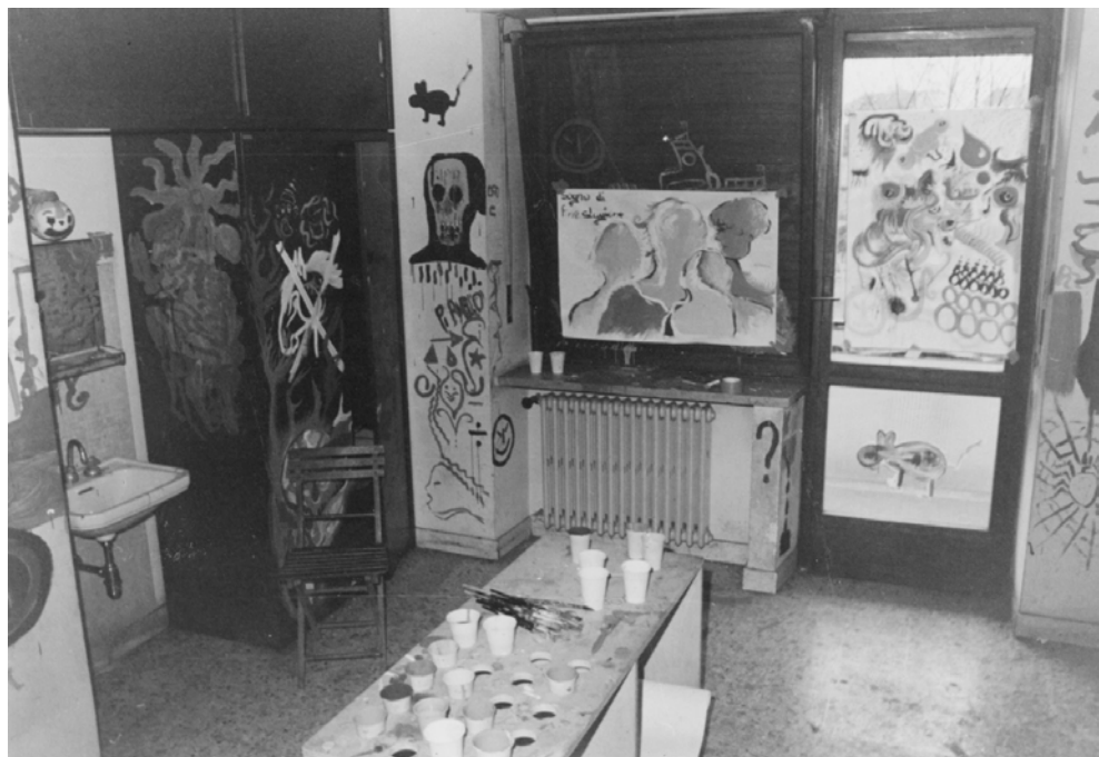
Fig. 5. Atelier di libera espressione con pazienti psichiatrici, Torino, anni Settanta, Fondazione Centro Studi Piero Gilardi, Torino

L'esperienza maturata a contatto con pratiche artistiche che recuperano la dimensione estetica in ambiti interstiziali della vita quotidiana lascia in eredità a Gilardi la consapevolezza di poter esprimere la creatività ben oltre il perimetro dell'istituzione. L'intensa vicenda dei movimenti del Sessantotto, i cui contraccolpi non hanno risparmiato la pratica dell'arte, aveva infatti prodotto, oltre alle richieste dal basso per una società diversa, anche un inaspettato protagonismo culturale dei singoli, senza il quale sarebbe stato impossibile parlare di un'azione creativamente politica, o politicamente creativa 48 (fig. 5).