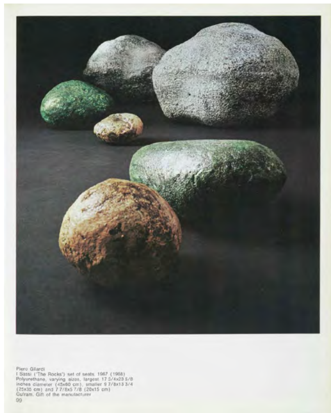
Fig. 4 Piero Gilardi, Sassi , 1967, dal catalogo Italy. The New Domestic Landscape. Achievements and Problems of Italian Design , a c. di Emilio Ambasz, MoMA-Museum of Modern Art, New York, e Centro Di, Firenze, 1972, p. 99

“neonati insensibili ai traumi infantili, [...] dotati di un sicuro equilibrio fisico-psichico, di un ordinato senso sociale e di una viva attitudine alle attività tecniche” 27 .