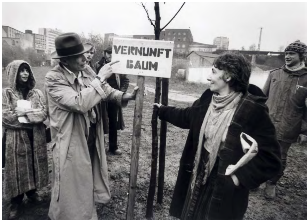
Fig. 1. Joseph Beuys, Vernunft Baum (L'albero della ragione), 1984, foto Dieter Schwerdtle, Stiftung 7000 Eichen, Kassel