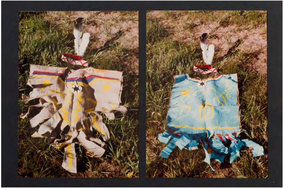
Fig. 7. Stop Pollution! , animazione nella riserva irochese Akwesasne, New York, 1983, Fondazione Centro Studi Piero Gilardi, Torino

In questa e in altre “periferie urbane e mondiali”, dove sono più drammaticamente tangibili le ricadute ambientali e sociali dello sfruttamento e della disparità di accesso alle risorse, Gilardi sceglie consapevolmente di proporre lo strumento del teatro di comunità per catalizzare relazioni e incoraggiare la libera espressività dei partecipanti, con l’intento di rafforzare in loro la presa di coscienza di una “identità culturale collettiva di fronte alla disgregazione portata, anche qui, dai primordi di una modernizzazione distorta” 55 . I ragazzi “hanno recitato compresi nei loro ruoli, con un senso forte e innato di ritualità” 56 , rammenta Gilardi, al quale l’esperienza effimera dell’animazione ha permesso di vincere la sfida della diversità culturale con i nativi e cogliere il senso profondo della Weltanschauung irochese: